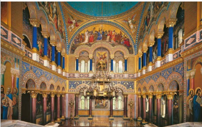
Sala del trono nel Castello di Neuschwanstein

Fatto costruire da Ludovico II a partire dal 1868 in un ambiente intimo e in posizione dominante rispetto al castello paterno di Hohenschwangau, il Castello di Neuschwanstein, mai portato a compimento, simboleggiava per lui un monumento alla cultura e alla regalità medievali, che Ludovico ammirava e ambiva ricostruire. Realizzato e arredato con forme e stili medievali, pur facendo ricorso alla più moderna tecnica di allora, è uno degli edifici più conosciuti al mondo nonché un simbolo fondamentale dell'idealismo tedesco. Gli interni mostrano cicli di dipinti murali di antiche saghe nordiche e cavalleresche. La Sala dei cantori rievoca con un sentimento di venerazione due sale della Fortezza della Wartburg; la Sala del trono, spazio sacrale della monarchia, rimanda alle chiese bizantine e paleocristiane.