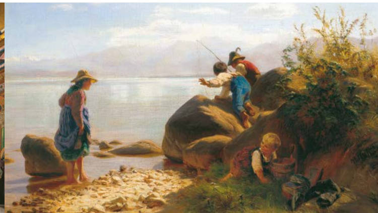
'Bambini che pescano sul lago Chiemsee', F. W. Pfeiffer

Il più antico convento bavarese venne fondato nella prima metà del settimo secolo. Dal 1215 fino alla secolarizzazione nel 1803 fu anche sede vescovile con relativo duomo. Ancora oggi i saloni della Biblioteca, dell'Imperatore e del Giardino rimandano alla sontuosità barocca dell'antico convento. Nel 1873, dopo aver acquistato la Herreninsel, il re Ludovico II fece sistemare alcune stanze residenziali all'interno del complesso conventuale in base alle sue disposizioni. Qui soleva soggiornare quando intendeva supervisionare i lavori del Nuovo Castello. Nel 1948 nell'ex convento, in seguito denominato Vecchio Castello, si riunirono i delegati dell'Assemblea Costituente, incaricata della stesura della Legge Fondamentale tedesca. Inoltre il Vecchio Castello ospita nelle sue sale anche la galleria dei pittori del Chiemsee e le opere di Julius Exter.