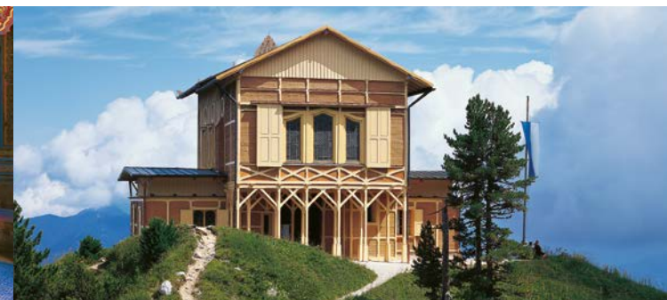
La Casa Reale dello Schachen

Ludovico II fece erigere un castelletto a 1800 m di altezza in una posizione grandiosa, prospiciente il massiccio alpino del Wetterstein. Sobria all'esterno e negli interni del pianterreno, la costruzione in legno rivela uno sfarzo orientale al piano superiore. Nel sontuoso Salotto turco, arredato con divani e provvisto di una fontana a getto, il re soleva festeggiare in solitudine il suo compleanno e il suo onomastico. La Casa Reale è raggiungibile solo a piedi partendo da Elmau, da Garmisch-Partenkirchen o da Mittenwald.