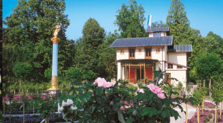
Il giardino delle rose visto dal lato est del villino