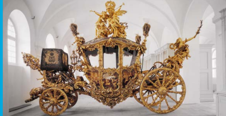
Nuova carrozza di gala del re Ludovico II nel Museo Marstall

Bayerischer Staatsminister der Finanzen und für Heimat