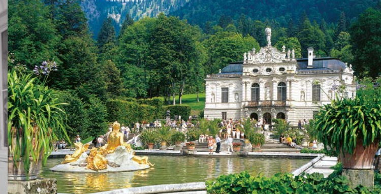
Facciata principale del Castello di Linderhof