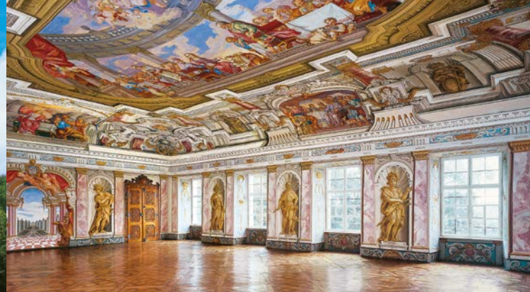
Il Salone imperiale barocco (Castello Vecchio)