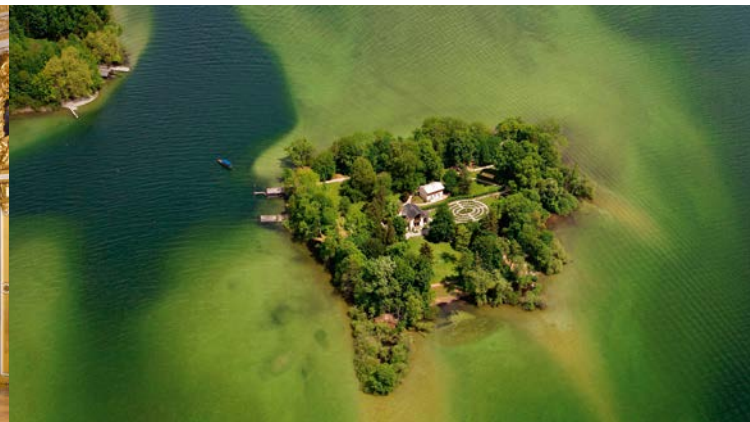
L'Isola delle rose e le circostanti zone di acqua bassa

Ludovico II amava questa isoletta dove si trovava il Casinò di suo padre, arredato in stile pompeiano. Negli anni giovanili vi invitò ospiti speciali, ad esempio la zarina russa Maria Alexandrovna. Di tanto in tanto vi si incontrava con l'imperatrice Elisabetta d'Austria, a lui spiritualmente affine. Il giardino delle rose venne ricostruito piantandovi molte specie storiche profumate. Il Casinò, restaurato in modo impeccabile, può essere visitato insieme al suo raffinato arredo. Nella Casa del giardiniere una piccola mostra informa sulla sorprendente lunga storia dell'isola. I resti di palafitte preistoriche sul fondale del lago di Starnberg intorno all'Isola delle rose sono stati dichiarati Patrimonio mondiale da parte dell'UNESCO. Sulla sponda orientale del lago, prospiciente l'Isola delle rose, si trova la Cappella Votiva. Venne costruita proprio al di sopra del punto in cui Ludovico II trovò la morte, il 13 giugno 1886, nelle vicinanze del suo castello di Berg.