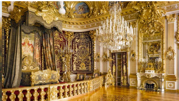
La Stanza da letto da parata nel Castello di Herrenchiemsee

Questo monumento alla monarchia assolutista sorse a partire dal 1878 e superò di molto il suo modello di Versailles nella sontuosità degli arredi. La Stanza da letto da cerimonia nell'Appartamento Grande fu la stanza più dispendiosa del XIX secolo. La dotazione di porcellana dell'Appartamento Piccolo è la più grande committenza singola che la manifattura di Meissen abbia mai ricevuto. I ricami dei tessuti non temono paragoni per ricchezza e qualità. Herrenchiemsee peraltro è rimasto incompiuto come il parco circostante, ispirato al modello di Versailles e ai suoi grandi giochi d'acqua, che avrebbe dovuto comprendere la maggior parte dell'isola. Oggigiorno il parco è circondato da un'area allo stato naturale con importanti biotopi. Nel castello l'ampio Museo di Ludovico II illustra la vita e l'operato di questo 'vero unico re dell'Ottocento', come lo definì Paul Verlaine nel 1886.