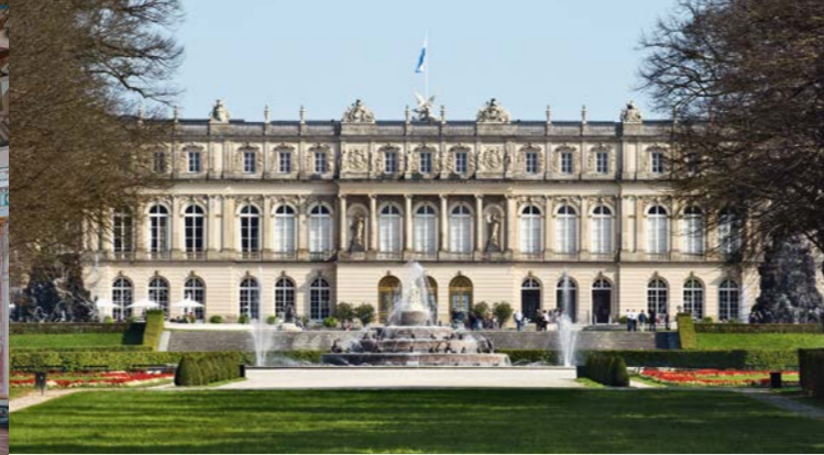
Il Castello di Herrenchiemsee (Castello Nuovo)