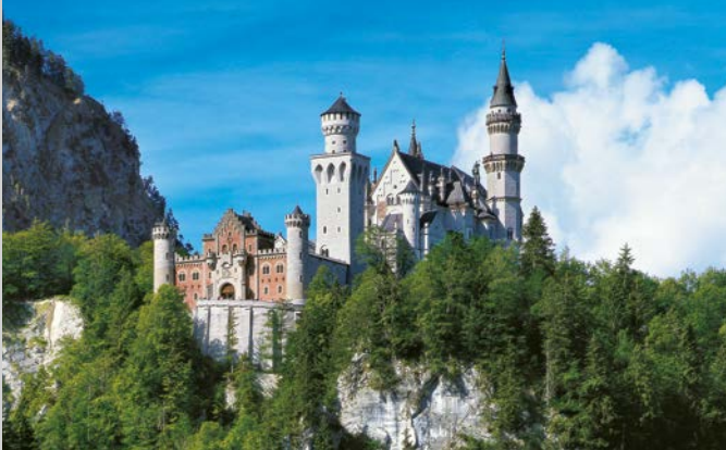
Il Castello di Neuschwanstein