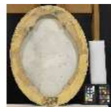
Lin.III,G, Herzog Moritz von Sachsen, Inv.-Nr. Lin.G0026, DI013876, BSV