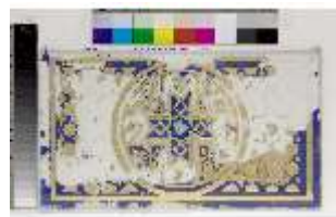
Lin.II, Maurischer Kiosk, Thronnische (Detail), DI021392, BSV-