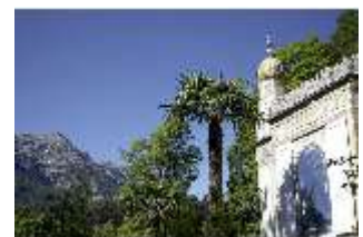
Lin.I, Maurischer Kiosk, Palmen, DI005517, BSV