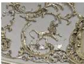
Lin.II, versilberter Deckenstück, Detail (R. 4), DI002008, BSV