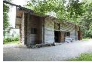
Lin. I, Hundinghütte, DI000373, BSV