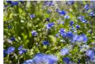
Lin.V, Wasserparterre, Blumenrabatten (Detail), DI016723, BSV-