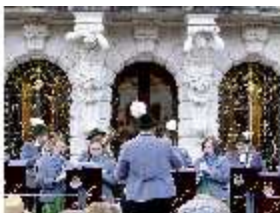
Lin.VI, Ludwignacht 2015, DI008627, BSV-