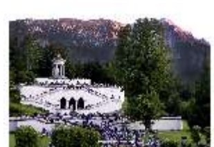
Lin.VI, Ludwignacht 2015, DI008626, BSV-