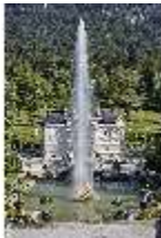
Lin.V, Hauptfassade mit Wasserparterre und Flora-Brunnen, DI027031, BSV-