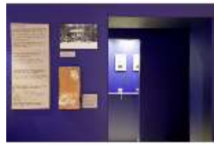
Lin.VII, Ausstellung im Königshäuschen, DI021125, BSV-