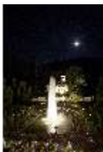
Lin.VI, Ludwignacht 2015, DI008647, BSV-