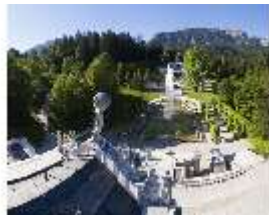
Lin.V, Blick vom Dach des Schlosses, DI016677, BSV-