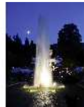
Lin.VI, Ludwignacht 2015, DI008625, BSV-