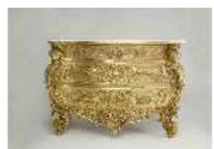
Lin.III,M, Kommode, Pössenbacher, DI015639, BSV-