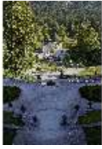
Lin.V, Hauptfassade u. Wasserparterre v. d. Terrassengärten aus, DI027047 BSV.