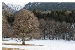
Lin.V, Schlosspark im Winter, DI025161, BSV-