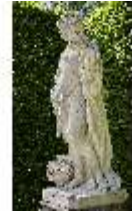
Lin.V, Gartenfigur Vier Jahreszeiten - Herbst, Lin.Gf0020, DI023321, BSV-