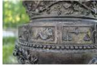
Lin.V, Wasserparterre, Zinkgussvase (Detail), DI016713, BSV-