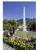
Lin.V, Hauptfassade mit Wasserparterre und Flora-Brunnen, DI027038, BSV-