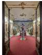
Lin.II, Treppenhaus, R. 2, DI013020, BSV-