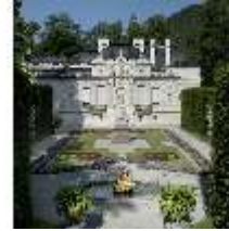
Lin.I, Ostseite und östl. Parterre, Brunnenfigur "Amor", DI000364, BSV