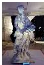
Lin.V,P, Frühling, im UV-Licht, Lin.Gr0022, DI019655, BSV