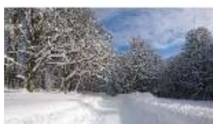
Lin.V, Garten mit Schnee im Winter, DI013272, BSV-