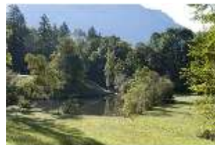
Lin.V, Schwanenweiher, DI005735, BSV