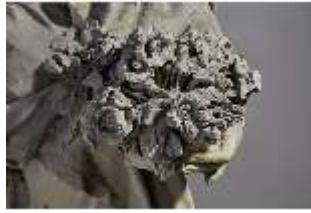
Lin.V,P, Frühling, Lin.Gf0022, DI017602, BSV