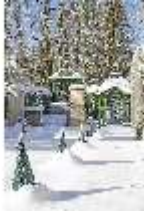
Lin.V, Westliches Gartenparterre verschneit im Winter, DI007325, BSV-