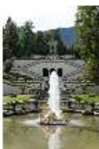
Lin.V, Wasserparterre, Terrassengärten und Venustempel, DI006041, BSV