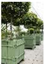
Lin.V, Gärtnerei, DI016801, BSV-