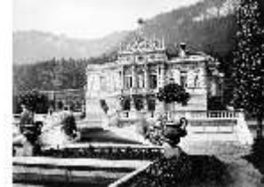
Lin. I, Linderhof, Foto um 1887, DE002263, BSV