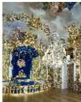
Lin.II, Schlafzimmer, R. 7, DI013236, BSV-