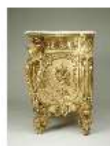
Lin.III,M, Kommode, Pössenbacher, DI015638, BSV-