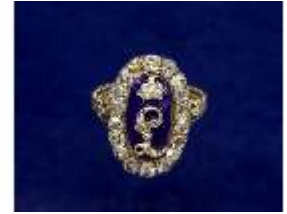
Lin.III,V, Ring, Inv.-Nr.: Lin.V0038, DI025122, BSV