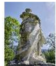
Lin.V, Gartenfigur Vier Erdteile - Asia, Lin.Gf0011, DI023313, BSV-