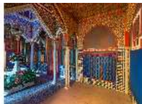
Lin.II, Marokkanisches Haus, Rauchzimmer, DI008948, BSV-