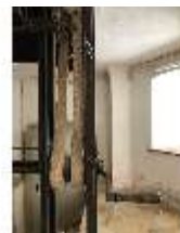
Lin.II, Technik, Tischlein deck dich, DI015996, BSV-