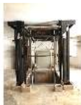
Lin.II, Technik, Tischlein deck dich, DI015995, BSV-