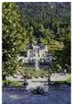
Lin.V, Hauptfassade u. Wasserparterre v. d. Terrassengärten aus, DI027059 BSV.