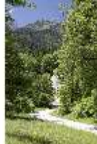
Lin.V, Weg, DI005560, BSV