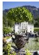
Lin.V, Zinkgußvase mit Bepflanzung, Balustrade am Wasserparterre, DI027067, BSV-