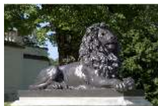
Lin.V, Terrassengärten, Löwe, DI000387, BSV