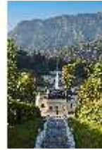
Lin.V, Kaskade und nördliche Schlossfassade, DI027024, BSV-