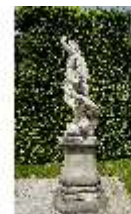
Lin.V, Gartenfigur Vier Elemente - Luft, Lin.Gf0004, DI023267, BSV-