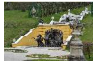
Lin.V, Neptun-Brunnen, restaurierte Kaskade (2023), Nordhang, DI028283, BSV-