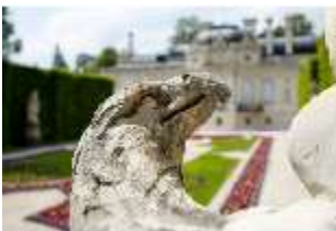
Lin.V,P, Gartenfigur: Vier Elemente - Luft (Detail: Adler), DI023231, BSV