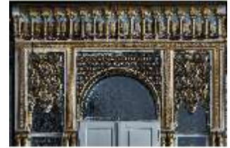
Lin.I, Maurischer Kiosk, Süd-West Fassade, DI008886, BSV