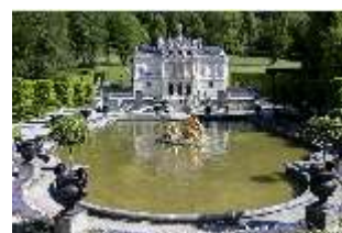
Lin.V, Wasserparterre vor der Schlossfassade, DI016727, BSV-