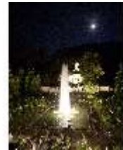
Lin.VI, Ludwignacht 2015, DI008646, BSV-