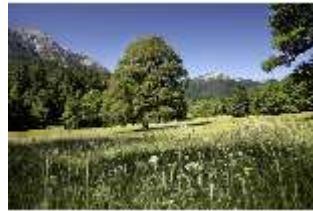
Lin.V, Wiese, DI005530, BSV