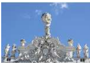
Lin.I, Giebel Mittelrisalit, Atlas, DI016711, BSV-