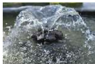
Lin.V, Schalenbrunnen mit Najaden, Detail, DI016736, BSV-