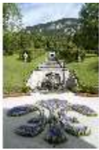
Lin.V, Nordhang mit Kaskade, Neptunbrunnen, DI005728, BSV