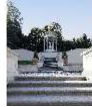
Lin.V, Terrassengärten, Venustempel, DI027071, BSV-