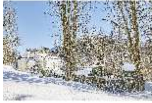
Lin.V, Laubengang und Hauptschloss verschneit, DI007356, BSV-