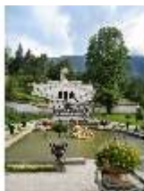
Lin.V, Wasserparterre, Terrassengärten mit Venustempel, DI006127, BSV