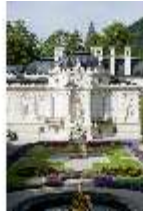
Lin.I, Ostfassade und östliches Parterre, DI005862, BSV