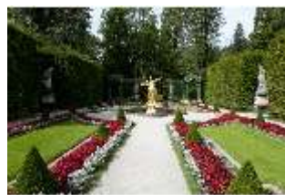
Lin.V, Westliches Parterre, Brunnenfigur der "Fama", DI005971, BSV