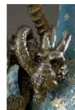
Lin.III,V, Cloisonné-Vase, DI019009, BSV-