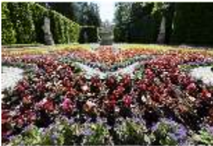
Lin.V, Östliches Parterre, DI016689, BSV-