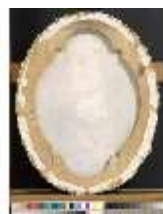
Lin.III,G, Pastell, König Ludwig XV., Lin.G0030, DI019925, BSV