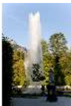
Lin.V, Wasserparterre, Fontäne, DI006076, BSV