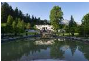
Lin.V, Wasserparterre, Terrassengärten mit Venustempel, DI014810, BSV