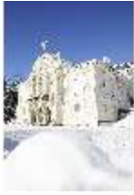
Lin.I, Hauptfassade verschneit im Winter, DI007347, BSV-