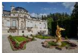
Lin.V, Westfassade und westliches Gartenparterre, DI023238, BSV