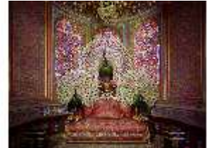
Lin.II, Maurischer Kiosk, Pfauenthron, DI005595, BSV-