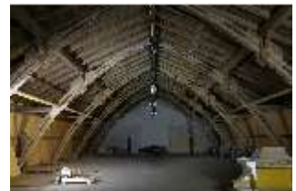
Lin.II, Tenne, DI021094, BSV-