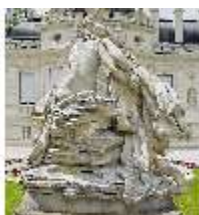
Lin.V, Figurengruppe Venus und Adonis, Lin.Gf0007, DI023290, BSV-