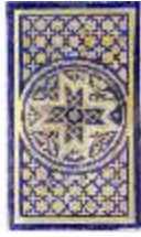
Lin.II, Maurischer Kiosk, Thronische Det. (Simulation), DI021389, BSV-