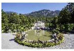
Lin.V, Hauptfassade mit Wasserparterre und Flora-Brunnen, DI027032, BSV-