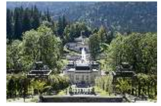
Lin.I,Nordfassade, Kaskade d.Nordhanges bis Terrassengärten, DI005865, RSV