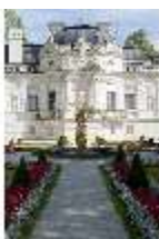
Lin.I, Westfassade, Parterre, mit Brunnenfigur "Fama", DI005894, BSV