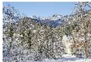
Lin.V, Seitenblick auf das Schloss, verschneiter Park, Berge, DI007344, BSV-