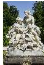
Lin.V, Figurengruppe Venus und Adonis, Lin.Gf0007, DI023284, BSV-