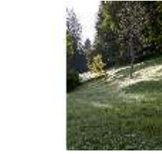
Lin.V, Landschaftlicher Garten, DI005965, BSV