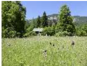
Lin.V, Königshäuschen, DI005572, BSV