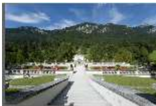
Lin.I, Hauptfassade von S, von Terrassengärten auf Nordhang, DI005807, BSV