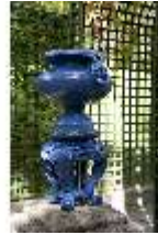
Lin.V, Westl. Parterre, Vase mit Faunköpfen als Handhaben, DI006051, BSV