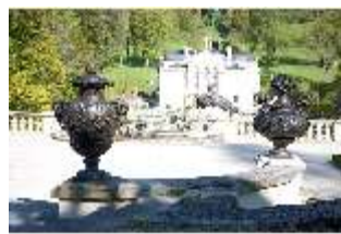
Lin.V, Vasen aus Zinkguss im Terrassengarten, DI009146, BSV-