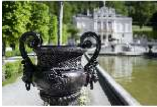
Lin.V, Wasserparterre, Zinkgussvase (Detail), DI016725, BSV-