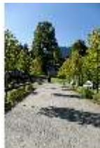
Lin.V, Schmalseite großes Bassin, 300-jährige Linde, DI005908, BSV