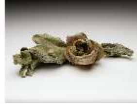
Lin.III,V, Stück Blatt- u. Rosenblütengirlande, Relikt Grotte Lin., DI027499, BSV-