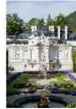
Lin.I, Ostfassade und östliches Parterre, DI005857, BSV