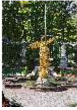
Lin.I, Südfassade und Parterre, DI008099, BSV-