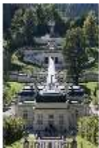
Lin.I,Nordfassade, Kaskade d.Nordhanges bis Terrassengärten, DI005866, RSV