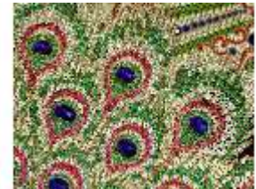
Lin.II, Maurischer Kiosk, Pfauenthron (Federdetail), DI005587, BSV-