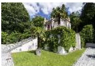
Lin.I, Maurischer Kiosk, DI016780, BSV-