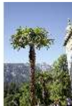
Lin.I, Maurischer Kiosk, Palme, DI005524, BSV