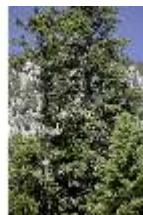
Lin.V, Baum Detail, DI005553, BSV