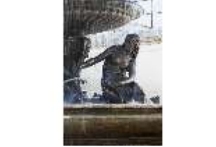
Lin.V, Terrassengärten, Najade, DI000385, BSV