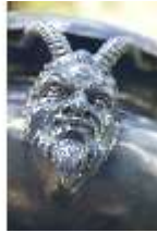
Lin.V, Westl. Parterre, Vase mit Faunköpfen als Handhaben, DI006050, BSV