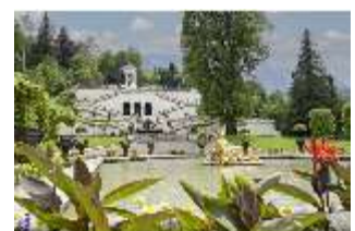
Lin.V, Wasserparterre und Terrassengärten, DI023208, BSV