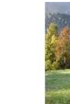
Lin.V, Blick Richtung Königshäuschen, DI009126, BSV-