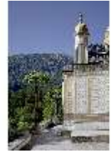
Lin.I, Maurischer Kiosk, DI005508, BSV