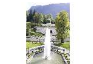
Lin.V, Parterre, Fontäne, Terrassengärten, Venustempel, DI006085, BSV