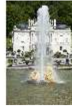
Lin.I, Hauptfassade, großes Bassin, DI005797, BSV