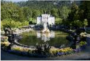
Lin.I, Hauptfassade von Süden, Wasserparterre mit Bassin, DI005754, BSV