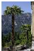
Lin.I, Maurischer Kiosk, Palmen, DI005515, BSV