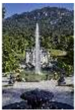
Lin.V, Hauptfassade und Wasserparterre mit Flora-Brunnen, DI027063, BSV-