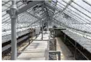
Lin.V, Gärtnerei, DI016809, BSV-