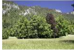
Lin.V, Blick auf Berge, DI005549, BSV