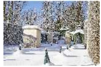
Lin.V, Westliches Gartenparterre verschneit im Winter, DI007323, BSV-