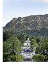
Lin.VI, Ludwignacht 2015, DI008621, BSV-