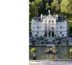
Lin.I, Hauptfassade von S, großes Bassin/Springbrunnengruppe, DI005772, BSV