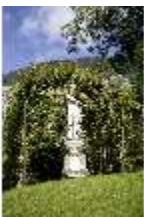
Lin.V, Nordhang, Lindenlaubengang, allegor. Figur "Amerika", DI006093, BSV