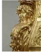
Lin.III,M,Kommode, Pössenbacher, DI015645, BSV-