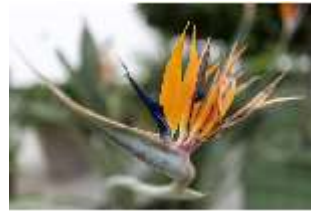
Lin.V, Gärtnerei, Strelizia reginae, DI016798, BSV-