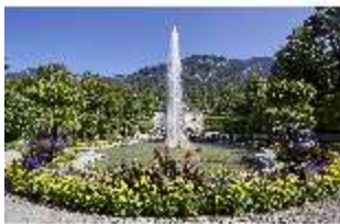
Lin.V, Hauptfassade mit Wasserparterre und Flora-Brunnen, DI027039, BSV-