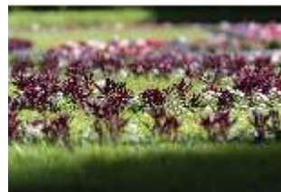
Lin.V, Östliches Parterre, Blumenrabatten, DI016704, BSV-