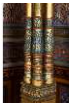
Lin.II, Maurischer Kiosk, Säulenbündel (Detail), DI008918, BSV-