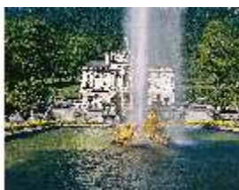
Lin.I, Südfassade und Parterre, DI008095, BSV-