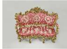
Lin.III,M, Kanapee, Lin.M0032, DI024872, BSV-