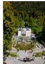
Lin.V, Blick vom Terrassengarten Richtung Schloss, DI009143, BSV-