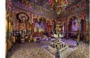
Lin.II, Maurischer Kiosk, Hauptraum, DI008905, BSV-