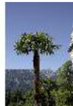
Lin.I, Maurischer Kiosk, Palme, DI005510, BSV