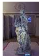
Lin.V,P, Frühling, im UV-Licht, Lin.Gr0022, DI019656, BSV