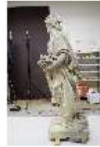
Lin.V,P, Frühling, UV-Licht_Vergl., Lin.Gf0022, DI019662, BSV