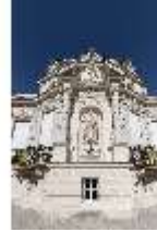
Lin.I, Ostfassade, Nischenfigur "Aurora", DI016690, BSV-