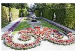
Lin.V, Östliches Parterre, DI006098, BSV