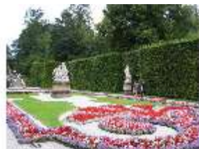
Lin.V, Östl. Parterre, Teppichparterre mit Blumenrabatten, DI006131, RSV