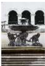
Lin.V, Terrassengärten, Schalenbrunnen mit Nereiden/Najaden, DI000381, BSV