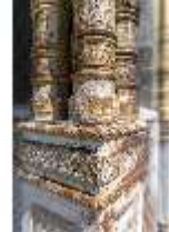
Lin.V, Maurischer Kiosk, Fassade (Detail), DI016782, BSV-