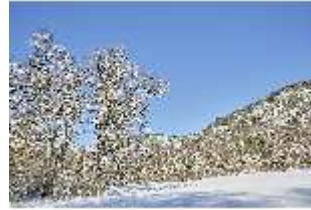
Lin.V, Schlosspark und Berge verschneit im Winter, DI007327, BSV-