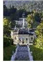
Lin.V, Kaskade und nördliche Schlossfassade, DI027021, BSV-