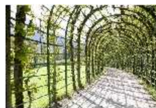
Lin.V, Nordhang mit Kaskade, Lindenlaubengang, DI006094, BSV