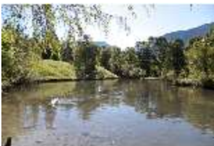
Lin.V, Schwanenweiher, DI005737, BSV