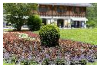
Lin.V, Blumenrabatten, DI016817, BSV-