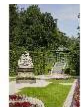
Lin.V, Östliches Parterre, DI023227, BSV