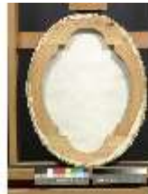
Lin.III,G, Porträt Béatrix de Choiseul-Stainville (Rückseite), DI004353, BSV