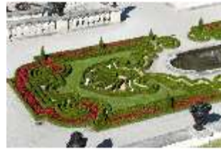
Lin.V, Terrassengärten, 1. Terrasse, DI005660, BSV