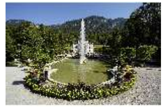
Lin.V, Hauptfassade mit Wasserparterre und Flora-Brunnen, DI027034, BSV-