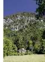
Lin.V, Maurischer Kiosk, DI005542, BSV