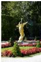
Lin.V, Westliches Parterre, Brunnenfigur der "Fama", DI006109, BSV