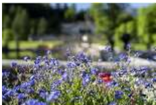
Lin.V, Wasserparterre, Detail Blumenrabatte, DI016682, BSV-