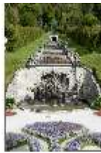
Lin.V, Nordhang mit Kaskade, Neptunbrunnen, DI005729, BSV