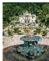
Lin.I, Südfassade und Parterre, DI008097, BSV-