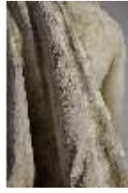
Lin.V,P, Frühling, Lin.Gf0022, DI017619, BSV