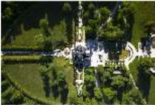
Lin.I, Vogelperspektive, DI016656, BSV-