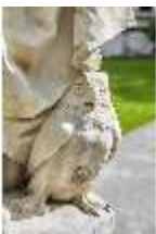
Lin.V,P, Gartenfigur: Vier Tagzeiten-Nacht-Proserpina, DI023217, BSV