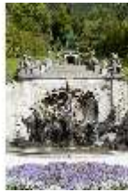
Lin.V, Nordhang mit Kaskade, Neptunbrunnen, DI005733, BSV