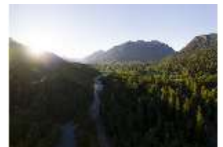
Lin.V, Graswangtal, Linder, DI016671, BSV-