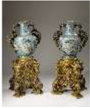
Lin.III,V, Cloisonné-Vasen, DI019007, BSV-