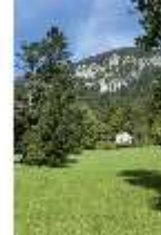
Lin.I, Maurischer Kiosk, Hauptfassade Schrägansicht, DI005851, BSV