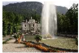
Lin.I, Blick über das Hauptparterre zur Hauptfassade, DI011891, BSV-