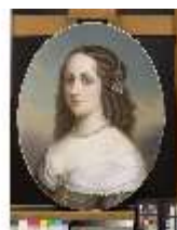
Lin.III,G, Porträt (Pastell), Louise Julie de Mailly-Nesle, DI012084, BSV