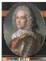
Lin.III,G, Louis Charles Auguste Duc de Belle-Isle, Lin.G0028, DI014819, BSV