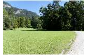
Lin.V, Landschaftlicher Garten, DI005919, BSV