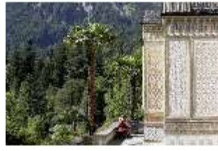
Lin.I, Maurischer Kiosk, Palmen und Besucher, DI005511, BSV