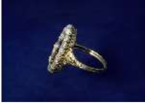
Lin.III,V, Ring, Inv.-Nr.: Lin.V0038, DI025123, BSV