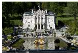
Lin.I, Hauptfassade von S, Wasserparterre mit großem Bassin, DI005764, BSV