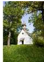
Lin.I, St.-Anna-Kapelle, DI009123, BSV-