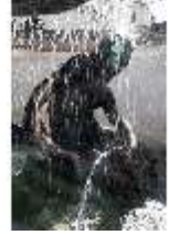
Lin.V, Terrassengärten, Najaden-Brunnen, DI005928, BSV