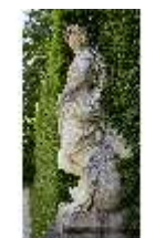
Lin.V, Gartenfigur Vier Elemente - Wasser, Lin.Gf0005, DI023275, BSV-