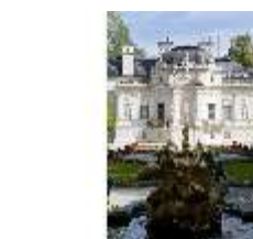
Lin.I,Westfassade, Parterre, Brunnenfigur "Amor mit Delphinen", DI005896, BSV