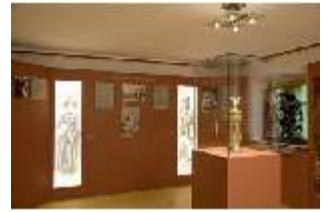
Lin.VII, Ausstellung im Königshäuschen, DI021102, BSV-