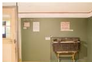
Lin.VII, Ausstellung im Königshäuschen, DI021120, BSV-