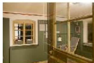
Lin.VII, Ausstellung im Königshäuschen, DI021121, BSV-