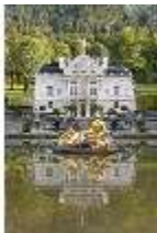
Lin.I, Hauptfassade, großes Bassin, DI005782, BSV