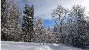
Lin.V, Garten mit Schnee im Winter, DI013276, BSV-