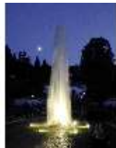
Lin.VI, Ludwignacht 2015, DI008624, BSV-