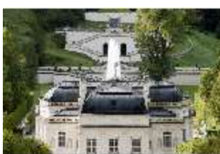
Lin.I,Nordfassade, Kaskade d.Nordhanges bis Terrassengärten, DI005886, RSV