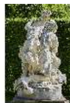
Lin.V, Figurengruppe Venus und Adonis, Lin.Gf0007, DI023288, BSV-