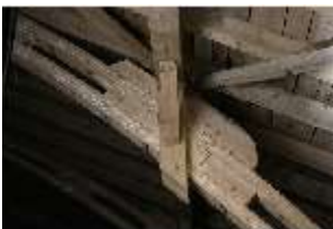
Lin.II, Tenne Dachkonstruktion Detail, DI021085, BSV-