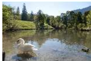
Lin.V, Schwanenweiher, DI005742, BSV