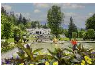
Lin.V, Wasserparterre und Terrassengärten, DI023209, BSV