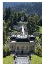
Lin.I, Nordfassade, Kaskade d. Nordhanges bis Terrassengärten, DI005869, BSV