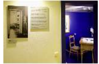
Lin.VII, Ausstellung im Königshäuschen, DI021110, BSV-