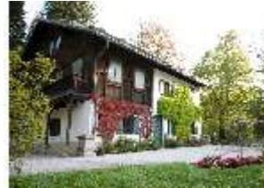
Lin. I, Königshäuschen, DI009132, BSV