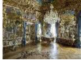
Lin.II, Spiegelsaal, R. 12, DI015951, BSV