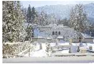
Lin.V, Terrassengärten verschneit im Winter, DI007340, BSV-