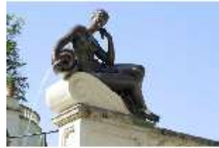
Lin.V, Terrassengärten, Quellnympe, DI000386, BSV