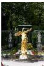
Lin.V, Westliches Parterre, Brunnenfigur der "Fama", DI005970, BSV