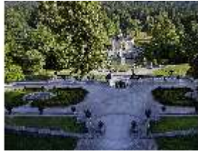
Lin.V, Hauptfassade u. Wasserparterre v. d. Terrassengärten aus, DI027052 BSV.