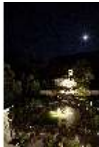
Lin.VI, Ludwignacht 2015, DI008644, BSV-