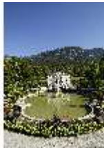
Lin.V, Hauptfassade mit Wasserparterre und Flora-Brunnen, DI027033, BSV-