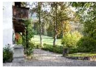
Lin.V, Blick vom Königshäuschen in den Park, DI009131, BSV-