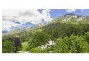
Lin.I, Maurischer Kiosk, DI016675, BSV-