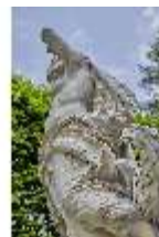
Lin.V, Gartenfigur Vier Elemente - Luft, Lin.Gf0004, DI023270, BSV-