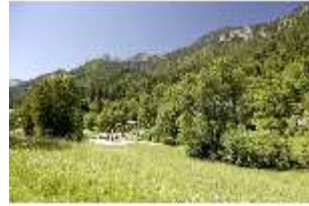
Lin.V, Kaskade, DI005561, BSV