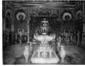
Lin.II, Maurischer Kiosk, Thronsaal, DE001189, BSV-