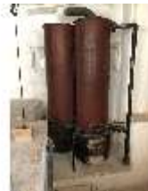
Lin.II, Technik, Heizung, DI015990, BSV-