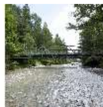
Lin.V, Historische Brücke, DI000797, BSV