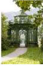
Lin.V, Musikpavillon, DI005724, BSV