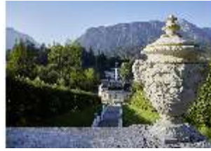
Lin.V, Obere Kaskade, Kalksteinvase (Detail) v. Philipp Perron, DI027028, RSV.