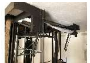
Lin.II, Technik, Tischlein deck dich, DI016001, BSV-