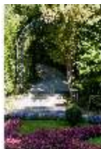
Lin.V, Östliches Parterre, Laubengang mit Sternbeet, DI005639, BSV