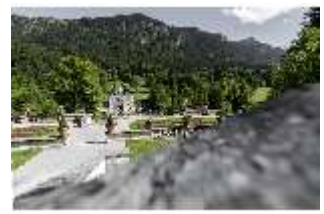
Lin.V, Blick von den Terrassengärten auf das Schloss, DI016760, BSV-