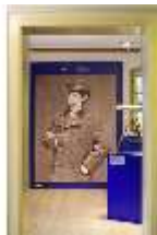
Lin.VII, Ausstellung im Königshäuschen, DI021104, BSV-