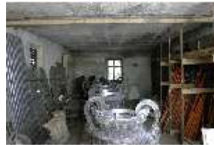
Lin.II, Tenne, DI021088, BSV-