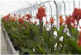
Lin.V, Gärtnerei, Canna x generalis, DI016797, BSV-