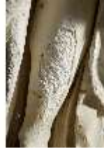
Lin.V,P, Frühling, Lin.Gf0022, DI017604, BSV