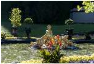
Lin.V, Wasserparterre, Springbrunnengruppe "Flora/Putten", DI005637, BSV