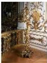
Lin.III, V, Räucherständer (1:2), R.7, DE003410, BSV-