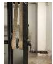
Lin.II, Technik, Tischlein deck dich, DI015997, BSV-