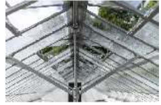
Lin.V, Gärtnerei, DI016811, BSV-