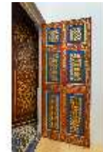
Lin.II, Marokkanisches Haus, jetziger Elektroraum, Blick zur Türe, DI008951, BSV-