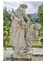
Lin.V, Gartenfigur Die vier Tagzeiten - Mittag - Venus, Lin.Gf0027, DI023345, BSV-