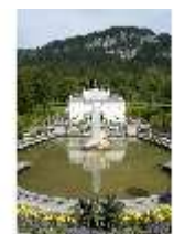
Lin.I, Hauptfassade, großes Bassin, DI005793, BSV