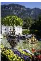
Lin.V, Zinkgußvase mit Bepflanzung, Balustrade am Wasserparterre, DI027068, BSV-