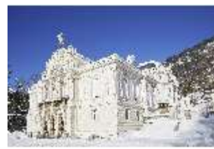
Lin.V, Hauptfassade verschneit im Winter, DI007337, BSV-