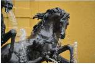
Lin.V, Pferd, Neptun-Brunnen, Nordhang, DI028297, BSV-