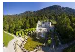
Lin.V, Wasserparterre und Schloss, DI016673, BSV-