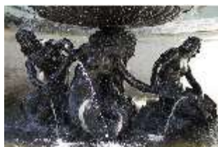
Lin.V, Schalenbrunnen mit Najaden, Detail, DI016731, BSV-