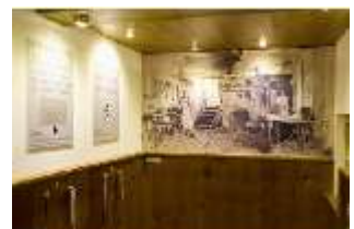
Lin.VII, Ausstellung im Königshäuschen, DI021122, BSV-