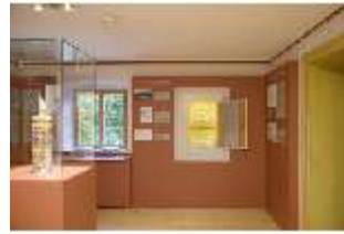
Lin.VII, Ausstellung im Königshäuschen, DI021101, BSV-