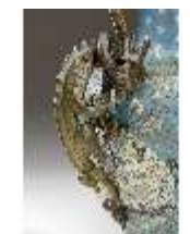
Lin.III,V, Cloisonné-Vase, DI019010, BSV-