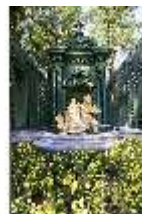
Lin.V, West. Parterre, Springbrunnengruppe "Amor mit Delphinen", DI005676, BSV