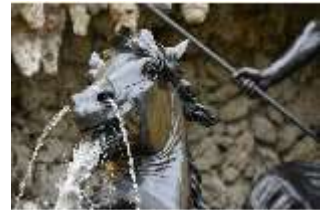
Lin.V, Pferdekopf, Neptun-Brunnen, Nordhang, DI028290, BSV-