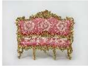
Lin.III,M, Kanapee, Lin.M0032, DI024871, BSV-