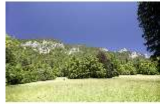
Lin.V, Blick auf Berge, DI005550, BSV