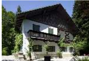
Lin. I, Königshäuschen, DI000388, BSV