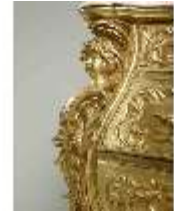
Lin.III,M,Kommode, Pössenbacher, DI015643, BSV-