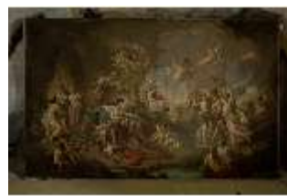
Lin.III,G, Tannhäuser im Venusberg, August von Heckel, DI029148, BSV