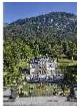
Lin.V, Hauptfassade und Wasserparterre mit Flora-Brunnen, DI027062, BSV-