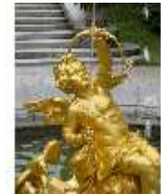
Lin.V, Östl. Parterre, Springbrunnengruppe "Amor mit Putten", DI006137, BSV