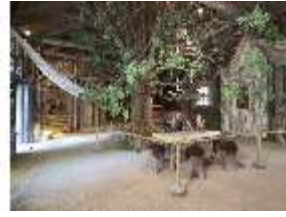
Lin.II, Hundinghütte, DI000375, BSV