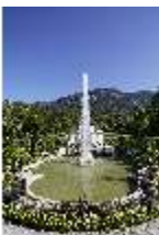
Lin.V, Hauptfassade mit Wasserparterre und Flora-Brunnen, DI027035, BSV-