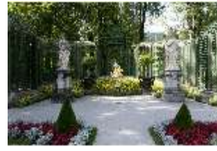
Lin.V, Westl. Parterre, Treillage-Architektur, DI006044, BSV