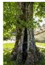
Lin.V, Königslinde, Baumstamm, DI016777, BSV-