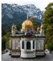
Lin. I, Maurischer Kiosk, DI008881, BSV