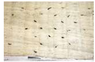
Lin.III,T, Hermelinbehang, DI018761, BSV