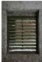
Lin.II, Tenne, DI021091, BSV-