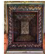
Lin.II, Marokkanisches Haus, pyramidenförmiges Oberlicht, DI008927, BSV-