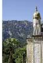
Lin.I, Maurischer Kiosk, Berge, DI005512, BSV