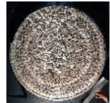
Lin.III,M, Muscheltischplatte, Inv.-Nr. LinGr.M0003, DI014823, BSV-