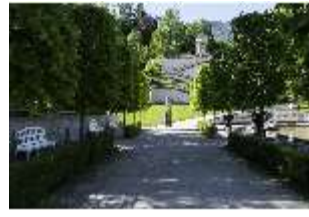
Lin.V, Wasserparterre, Weg zu den Terrassengärten, DI016717, BSV-