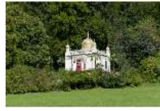
Lin.I, Maurischer Kiosk, Schrägansicht der Hauptfassade, DI005845, BSV