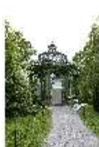
Lin.VI, Ludwignacht 2015, DI008628, BSV-