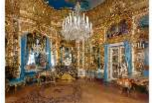
Lin.II, Spiegelsaal, R.12, DE001266, BSV-