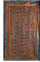
Lin.II, Maurischer Kiosk, Wandfeld mit orient. Ornamenten, DI008921, BSV-