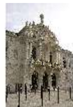
Lin.I, Hauptfassade, DI011889, BSV-