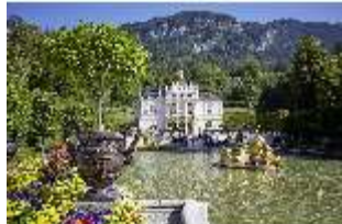
Lin.V, Hauptfassade mit Wasserparterre und Flora-Brunnen, DI027040, BSV-