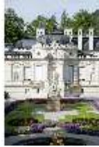
Lin.I, Ostfassade und östliches Parterre mit Brunnenfigur "Amor" und Figurengruppe "Venus und Amor", DI016690, BSV-