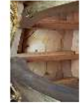
Lin.III,M,Kommode, Pössenbacher, DI015647, BSV-