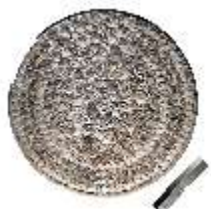
Lin.III,M, Muscheltischplatte, Inv.-Nr. LinGr.M0003, DI014824, BSV-