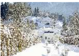
Lin.V, Hauptschloss bis zu den Terrassengärten verschneit, DI007352, BSV-