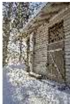
Lin.I, Einsiedelei des Gurnemannz verschneit im Winter, DI007333, BSV-