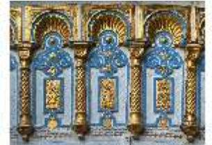
Lin.I, Maurischer Kiosk, Kuppel der Apsis (Detail), DI008895, BSV-