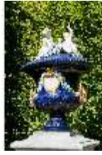
Lin.V, Westliches Parterre, Majolika-Vase, J. Löbnitz, DI005672, BSV