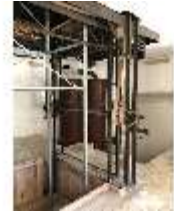
Lin.II, Technik, Tischlein deck dich, DI016005, BSV-