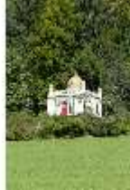
Lin.I, Maurischer Kiosk, Schrägansicht der Hauptfassade, DI005848, BSV