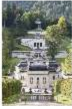
Lin.I,Nordfassade, Kaskade d.Nordhanges bis Terrassengärten, DI005874, RSV