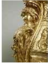
Lin.III,M,Kommode, Pössenbacher, DI015644, BSV-