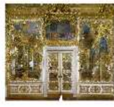
Lin.II, Spiegelsaal, R.12, Ruhebett und Kamine, DI014639, BSV-