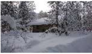
Lin.V, Hundinghütte mit Schnee im Winter, DI013278, BSV-