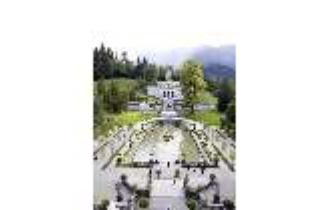
Lin.V, Wasserparterre, Blick von den Terrassengärten, DI006083, BSV