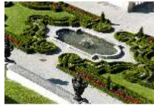
Lin.V, Terrassengärten, 1. Terrasse mit Brunnen, DI005663, BSV