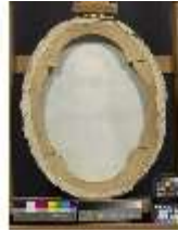
Lin.III,G, Porträt (Pastellgemälde), Germain Louis Chauvelin, marquis de Craheois (1685-1762), Inv. -