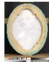
Lin.III,G, Étienne-François Duc de Choiseul-Stainville, DI019928, BSV