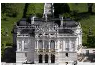
Lin.I, Hauptfassade, DI016762, BSV-