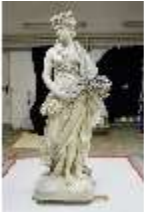
Lin.V,P, Frühling, UV-Licht_Vergl., Lin.Gf0022, DI019659, BSV