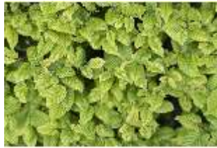
Lin.V, Hainbuchenhecke (Detail), DI016696, BSV-