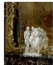
Lin.III,K, Die Drei Grazien, Inv.-Nr. Lin.P0005, DI013238, BSV-