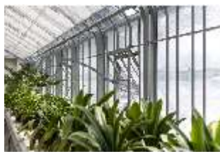
Lin.V, Gärtnerei, DI016802, BSV-