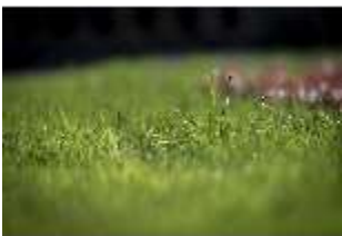
Lin.V, Terrassengärten, Rasen (Detail), DI016755, BSV-