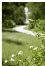
Lin.V, Weg mit Blumendetail, DI005559, BSV