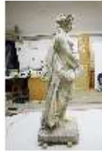
Lin.V,P, Frühling, UV-Licht_Vergl., Lin.Gf0022, DI019661, BSV