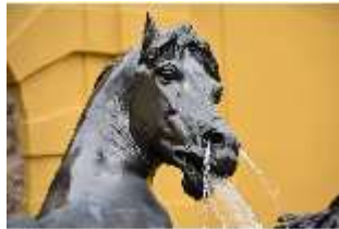
Lin.V, Pferdekopf, Neptun-Brunnen, Nordhang, DI028293, BSV-