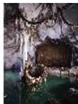
Lin.II, Venusgrotte, DE000073, BSV-