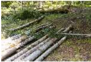
Lin.V, Wald, Baumarbeiten, DI016790, BSV-