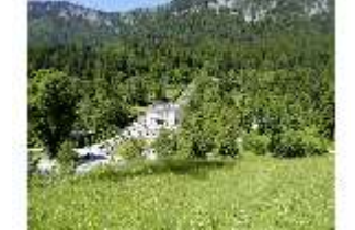
Lin.V, Blick auf das Schloss, DI005570, BSV