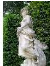
Lin.V, Östl. Parterre, Steinskulptur "Allegorie des "Wassers", DI006133, BSV