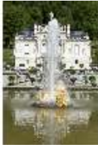
Lin.I, Hauptfassade, großes Bassin, DI005794, BSV