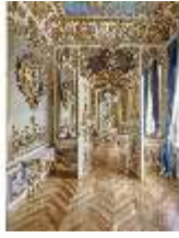
Lin.II, Blaues Kabinett, R. 10, DI015944, BSV