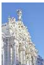
Lin.I, Hauptfassade verschneit im Winter, DI007322, BSV-