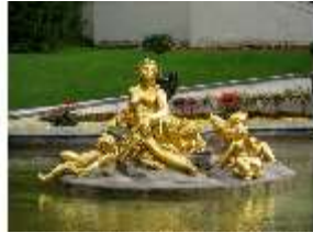
Lin.V, Wasserparterre, Springbrunnengruppe "Flora und Putten", DI006122, BSV