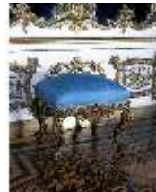
Lin.III, M, Tabouret (1:6), R.12, DE003403, BSV-