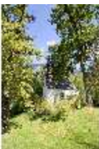
Lin.I, St.-Anna-Kapelle, DI009124, BSV-