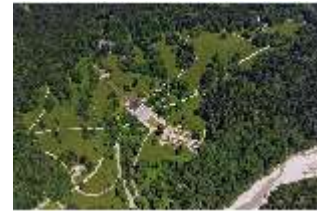
Lin. I, Luftaufnahme Schloss u. Schlosspark v. SW, DI024446, BSV