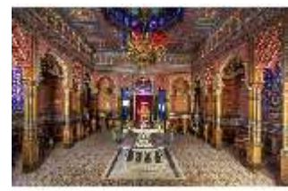
Lin.II, Maurischer Kiosk, Hauptraum, DI008901, BSV-