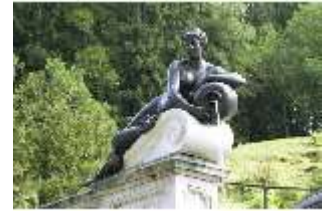
Lin.V, Terrassengärten, Quellnympe, DI000382, BSV