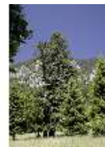
Lin.V, Bäume, DI005552, BSV