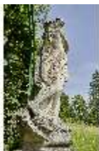
Lin.V, Gartenfigur Vier Erdteile - Amerika, Lin.Gf0009, DI023301, BSV-