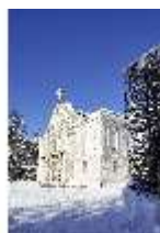
Lin.I, Hauptfassade verschneit im Winter, DI007336, BSV-