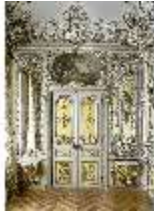
Lin.II, Gelbes Kabinett, R. 4, DI013234, BSV-