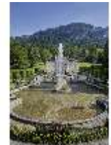
Lin.V, Wasserparterre mit Flora-Brunnen vor Hauptfassade, DI023211, BSV