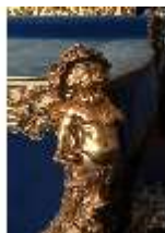
Lin.III, Prunkbett, R. 7, Lin.M0093, DI019608, BSV