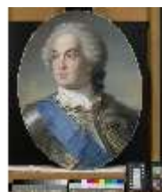
Lin.III,G, Herzog Moritz von Sachsen, Inv.-Nr. Lin.G0026, DI013875, BSV