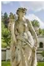
Lin.V,P, Gartenfigur: Vier Tagzeiten-Nacht-Proserpina, DI023214, BSV