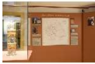
Lin.VII, Ausstellung im Königshäuschen, DI021100, BSV-