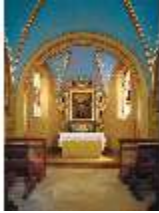
Lin.II, St. Anna-Kapelle, DE001820, BSV-