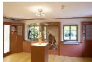
Lin.VII, Ausstellung im Königshäuschen, DI021097, BSV-