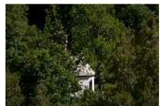
Lin.V, St.-Anna-Kapelle, DI016763, BSV-