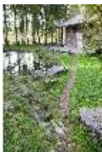
Lin.V, Weg vom See zur Hundinghütte, DI009117, BSV-