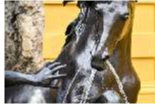
Lin.V, Pferd, Neptun-Brunnen, Nordhang, DI028299, BSV-