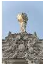
Lin.I, Hauptfassade, von Süden aus, Giebel mit Atlas-Figur, DI005961, BSV