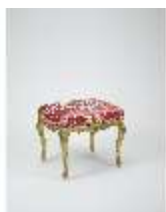
Lin.III,M, Tabouret, Lin.M0081, DI024878, BSV-