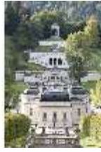
Lin.I,Nordfassade, Kaskade d.Nordhanges bis Terrassengärten, DI005875, RSV