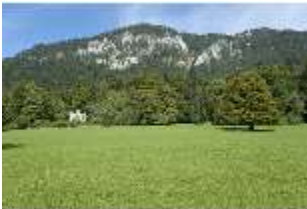
Lin.I, Maurischer Kiosk, Hauptfassade Schrägansicht, DI005852, BSV