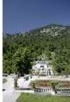
Lin.V, Blick auf das Schloss, DI005567, BSV