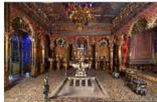
Lin.II, Maurischer Kiosk, Hauptraum, DI008903, BSV-