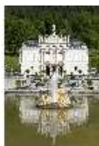
Lin.I, Hauptfassade, großes Bassin, DI005791, BSV