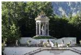
Lin.V, Terrassengärten, Rundtempel mit Venus-Statue, DI016695, BSV-