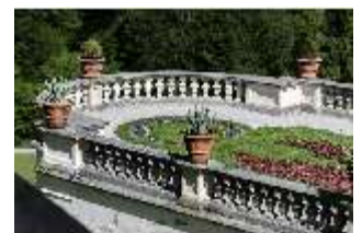
Lin.V, Terrassengärten, Teppichparterre, DI016764, BSV-