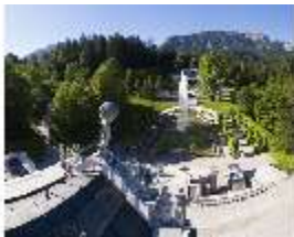
Lin.V, Blick vom Dach des Schlosses, DI016676, BSV-