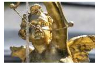
Lin.V, "Pfeilschießender Amor mit Tauben", DI016706, BSV-