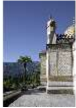
Lin.I, Maurischer Kiosk, DI005505, BSV