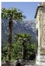
Lin.I, Maurischer Kiosk, Palmen, DI005513, BSV