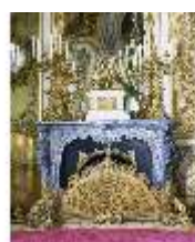
Lin.II, Audienzzimmer, R.5, Kamin, DE000738, BSV-