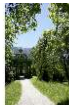
Lin.I, Musikapavillon, DI005555, BSV