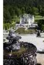
Lin.II, Schalenbrunnen mit Blick auf das Schloss, DI016745, BSV-