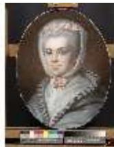
Lin.III,G, Porträt, Béatrix de Choiseul-Stainville, Lin.G0033, DI002861, BSV