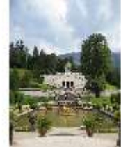
Lin.V, Wasserparterre, Terrassengärten mit Venustempel, DI006125, BSV