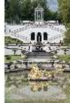
Lin.V, Wasserparterre, Terrassengärten mit Venustempel, DI005963, BSV