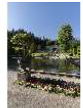
Lin.V, Wasserparterre mit Springbrunnengruppe und Terrassengärten, DI016681, RSV-