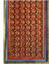
Lin.II, Maurischer Kiosk, Wandfeld mit orient. Ornamenten, DI008922, BSV-