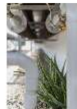
Lin.V, Gärtnerei, DI016807, BSV-