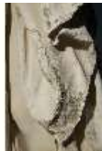
Lin.V,P, Frühling, Lin.Gf0022, DI017607, BSV