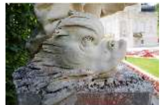
Lin.V,P, Gartenfigur: Vier Elemente - Wasser (Detail: Delfin), DI023234, BSV