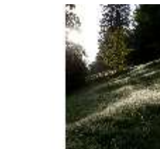
Lin.V, Landschaftlicher Garten, DI005700, BSV