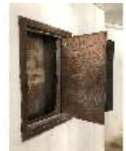
Lin.II, Technik, Heizung, DI015991, BSV-