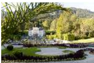
Lin.I, Hauptfassade von S, Wasserparterre, Blumenrabatte, DI005830, RSV