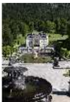
Lin.V, Schalenbrunnen mit Blick auf das Schloss, DI016744, BSV-