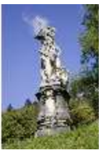
Lin.V, Nordhang, allegor. Steinfigur (einer der 4 Kontinente), DI006103, BSV