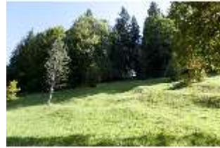
Lin.V, Landschaftlicher Garten, DI005930, BSV