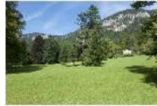
Lin.I, Maurischer Kiosk, Hauptfassade Schrägansicht, DI005850, BSV