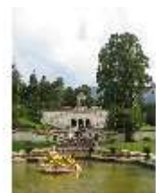
Lin.V, Wasserparterre, Terrassengärten, 300-jährige Linde, DI006118, BSV