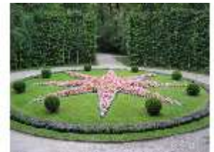
Lin.V, Östl. Parterre, sternförmiges Blumenbeet (Sternbeet), DI006140, BSV