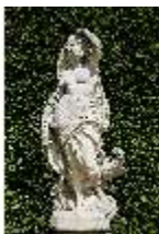
Lin.V, Gartenfigur Vier Elemente - Luft, Lin.Gf0004, DI023264, BSV-