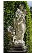
Lin.V, Gartenfigur Vier Elemente - Erde, Lin.Gf0006, DI023283, BSV-