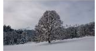
Lin.V, Garten mit Schnee im Winter, DI013281, BSV-