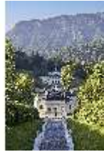
Lin.V, Kaskade und nördliche Schlossfassade, DI027023, BSV-