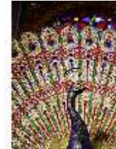
Lin.II, Maurischer Kiosk, Pfauenthron (Detail), DI005594, BSV-