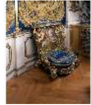
Lin.III, M, Betbank, R.7, M 95, DE003411, BSV-