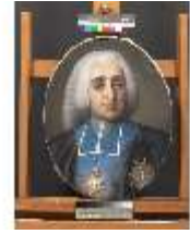
Lin.III,G, Porträt (Pastellgemälde), Augustin de Maupeou, DI009053, BSV