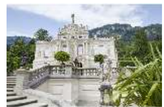
Lin.I, Hauptfassade/Südfassade des Schlosses, DI023206, RSV