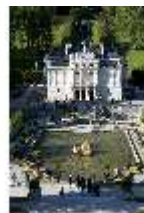
Lin.I, Hauptfassade, Wasserparterre, von den Terrassengärten, DI005771, RSV