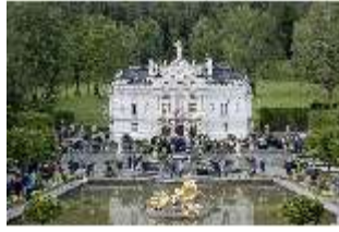
Lin.VI, Ludwignacht 2015, DI008636, BSV-