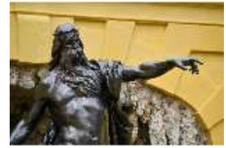
Lin.V, Neptun, Neptun- Brunnen, Nordhang, DI028296, BSV-