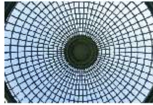
Lin.V, Westliches Parterre, Treillage-Architektur, DI005915, BSV