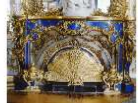
Lin.II, Kamin im Spiegelsaal, R. 12, DE002571, BSV-