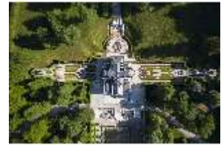
Lin.I, Vogelperspektive, DI016655, BSV-