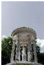
Lin.V, Rundtempel mit Venus-Statue, DI016756, BSV-