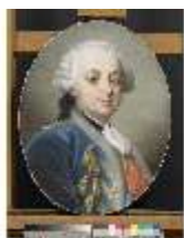
Lin.III,G, Étienne-François Duc de Choiseul-Stainville, DI020772, BSV-