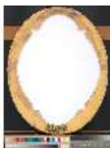
Lin.III,G, Herzog Moritz von Sachsen, Rückansicht, Inv.-Nr. Lin.G0026, DI014818, BSV