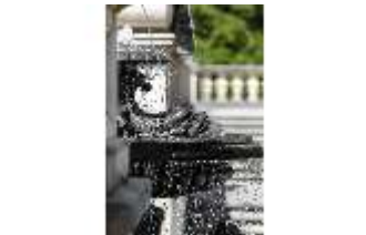
Lin.V, Terrassengärten, Schalenbrunnen mit Najaden, Seitenansicht, DI016768, BSV-