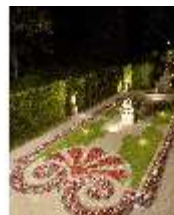
Lin.VI, Ludwignacht 2015, DI008653, BSV-