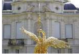
Lin.V, Brunnenfigur "Fama", westl. Gartenparterre, DI023242, BSV