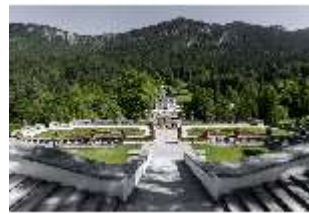
Lin.V, Blick von den Terrassengärten auf das Schloss, DI016759, BSV-