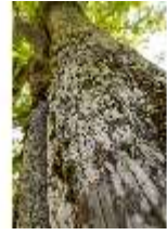
Lin.V, Königslinde, Blick in den Baum, DI016775, BSV-