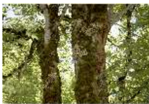
Lin.V, Baum Detail, DI005534, BSV