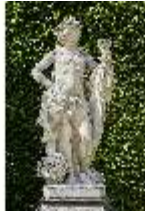
Lin.V, Gartenfigur Vier Jahreszeiten - Herbst, Lin.Gf0020, DI023319, BSV-