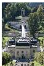
Lin.I, Nordfassade, Kaskade d. Nordhanges bis Terrassengärten, DI005864, BSV