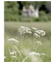
Lin.V, Blumendetail, DI005545, BSV