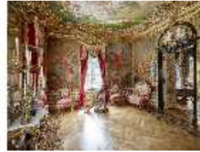
Lin.II, Östliches Gobelinzimmer, R. 11., DI015945, BSV