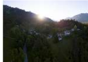
Lin.I, Vogelperspektive, DI016669, BSV-