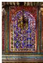
Lin.II, Maurischer Kiosk, Rundbogen mit Glasmosaik, Laterne, DI008912, BSV-