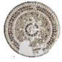
Lin.II,M, Muscheltischplatte, Inv.-Nr. LinGr.M0003, DI029147, BSV