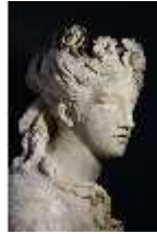
Lin.V,P, Frühling, Lin.Gf0022, DI017599, BSV