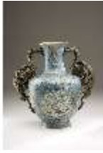
Lin.III,V, Cloisonné-Vase, DI019015, BSV-