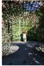
Lin.V, Westliches Parterre, Treillage-Architektur, DI005914, BSV