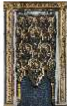
Lin.I, Maurischer Kiosk, Süd-West Fassade, DI008887, BSV