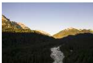
Lin.V, Graswangtal, Linder, DI016650, BSV-