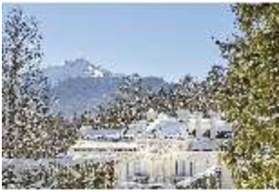
Lin.V, Blick über das Schloss auf die Berge verschneit im Winter, DI007349, BSV-