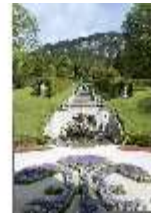
Lin.V, Nordhang mit Kaskade, Neptunbrunnen, DI005727, BSV