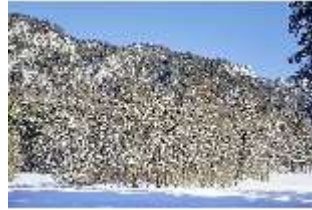
Lin.V, Schlosspark und Berge verschneit im Winter, DI007326, BSV-