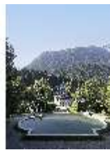
Lin.V, Nordhang, Bassin vor dem Musikpavillon, DI027020, BSV-