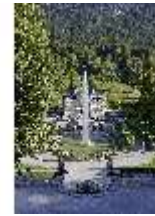
Lin.V, Hauptfassade u. Wasserparterre v. d. Terrassengärten aus, DI027058 BSV.