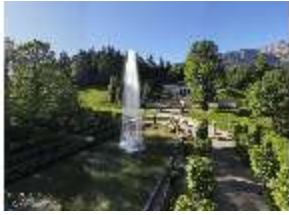
Lin.V, Vogelperspektive, DI016652, BSV-