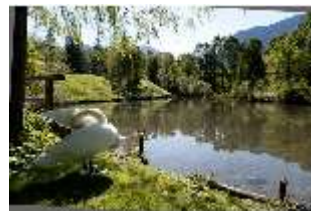
Lin.V, Schwanenweiher, DI005743, BSV