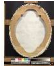
Lin.III,G, Porträt Béatrix de Choiseul-Stainville (Rückseite), DI002862, BSV