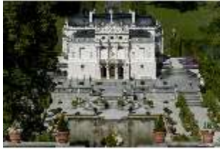
Lin.I, Hauptfassade von S, auf Höhe d. oberen Terrassengärten, DI005802, RSV