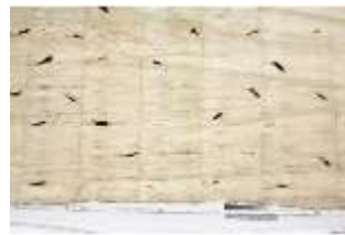
Lin.III,T, Hermelinbehang, DI018763, BSV