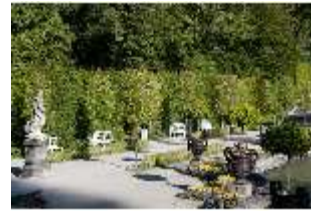
Lin.V, Wasserparterre, Bänke, DI005902, BSV