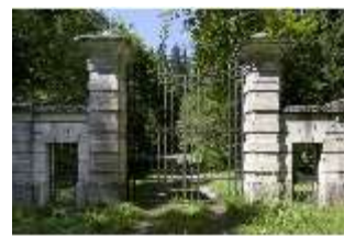
Lin.V, Verbotenes Tor, DI000377, BSV