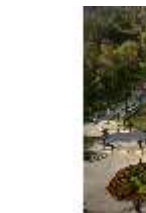
Lin.V, Blick Richtung Schloss mit Wasserparterre, DI009137, BSV-