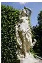
Lin.V, Gartenfigur Vier Elemente - Luft, Lin.Gf0004, DI023272, BSV-