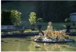
Lin.V, Wasserparterre, Blick auf die Springbrunnengruppe "Flora und Putten", DI005901, BSV