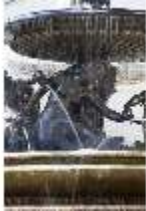
Lin.V, Terrassengärten, Nereiden-/Najaden-Brunnen, Detail, DI000384, BSV