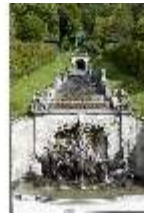
Lin.V, Nordhang mit Kaskade, Neptunbrunnen, DI005726, BSV