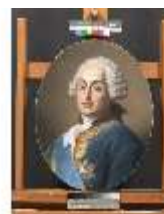
Lin.III,G, Porträt (Pastell), César Gabriel de Choiseul, DI009057