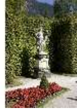
Lin.V, Westliches Parterre, Allegorie des "Herbstes", DI006112, BSV