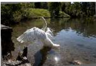
Lin.V, Schwanenweiher, DI005741, BSV