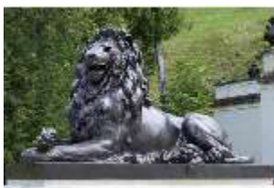
Lin.V, Terrassengärten, Löwe, DI000383, BSV