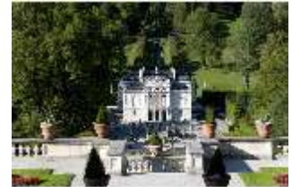
Lin.I, Hauptfassade, von S, von den oberen Terrassengärten, DI005769, RSV