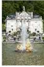
Lin.I, Hauptfassade, großes Bassin, DI005799, BSV