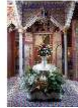
Lin.II, Marokkanisches Haus, DI000380, BSV