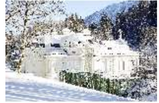
Lin.V, Laubengang und Hauptschloss verschneit, DI007358, BSV-