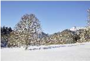
Lin.V, Schlosspark und Berge verschneit im Winter, DI007329, BSV-