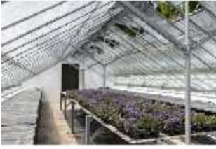
Lin.V, Gärtnerei, DI016808, BSV-