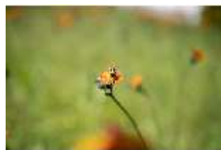
Lin.V, Wiese hinter der Gärtnerei, Biene (Detail), DI016815, BSV-