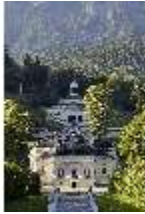
Lin.V, Kaskade und nördliche Schlossfassade, DI027022, BSV-