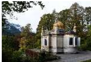
Lin. I, Maurischer Kiosk, DI008882, BSV