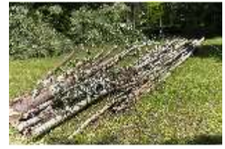
Lin.V, Wald, Baumarbeiten, DI016789, BSV-