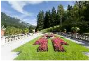
Lin.V, Terrassengärten, 2. Terrasse, DI006046, BSV