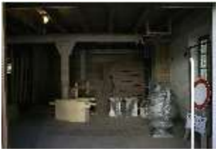
Lin.II, Tenne, DI021086, BSV-