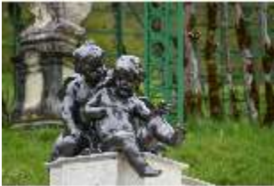
Lin.V, Putti am Neptun-Brunnen, Nordhang, DI028286, BSV-