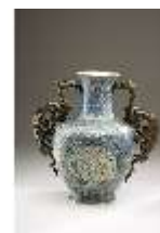
Lin.III,V, Cloisonné-Vase, DI019013, BSV-