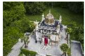
Lin.I, Maurischer Kiosk, DI016665, BSV-