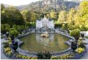
Lin.I, Hauptfassade, großes Bassin, DI005778, BSV