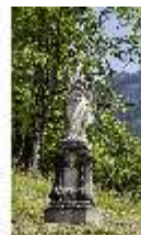
Lin.V, Gartenfigur Vier Erdteile - Asia, Lin.Gf0011, DI023308, BSV-