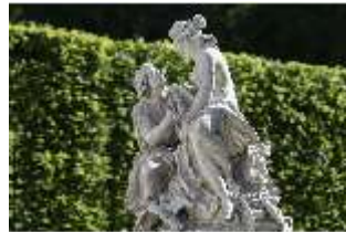
Lin.V, Östliches Parterre, "Venus und Adonis", DI016697, BSV-