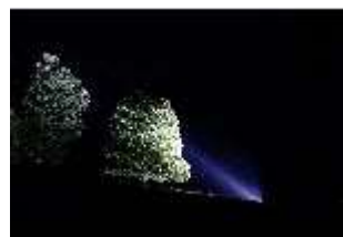
Lin.VI, Ludwignacht 2015, DI008649, BSV-