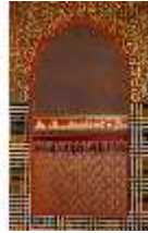
Lin.II, Marokkanisches Haus, Speisezimmer, Wandfeld mit Ornamenten, DI008940, BSV-