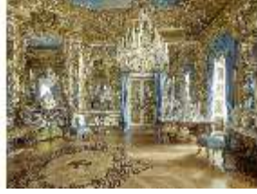
Lin.II, Spiegelsaal, R. 12, DI015950, BSV