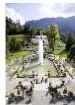
Lin.V, Parterre, Fontäne, Terrassengärten und Venustempel, DI006086, BSV