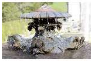
Lin.V, Terrassengärten, Najaden-Brunnen, Detail, DI006081, BSV