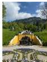
Lin.V, Nordhang, restaurierte Kaskade (2023), DI026552, BSV