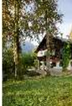
Lin. I, Königshäuschen, DI009129, BSV