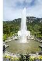
Lin.I, Hauptfassade, großes Bassin, DI005796, BSV