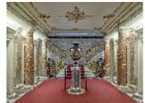
Lin.II, Treppenhaus, R.2, DI013021, BSV-