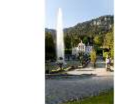
Lin.I, Hauptfassade von S, großes Bassin, Fontäne, DI005826, BSV