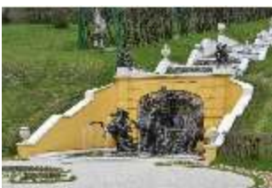
Lin.V, Neptun-Brunnen, restaurierte Kaskade (2023), Nordhang, DI028284, BSV-