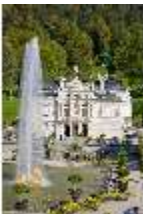
Lin.I, Schloss mit Wasserparterre, DI009141, BSV-