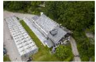
Lin.V, Gärtnerei, Vogelperspektive, DI016644, BSV-