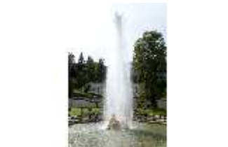
Lin.V, Wasserparterre, Fontäne, DI006043, BSV