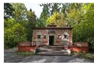
Lin. I, Marokkanisches Haus, Süd-West Fassade, DI008925, BSV