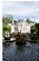
Lin.I, Westfassade, Parterre, Brunnenfigur "Amor mit Delphinen", DI005897, BSV