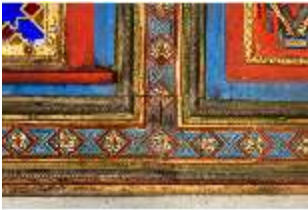
Lin.II, Maurischer Kiosk, orientalisierende Ornamente (Detail), DI008920, BSV-