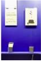
Lin.VII, Ausstellung im Königshäuschen, DI021123, BSV-

Beschreibung Linderhof, Stand: Januar 2024