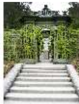
Lin.V, östl. Parterre, Steinbüste König Ludwigs XVI., DI006139, BSV