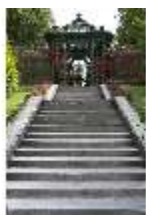
Lin.V, östl. Parterre, Treppenaufgang zur Treillage-Architektur, DI005969, BSV