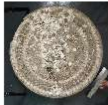
Lin.III,M, Muscheltischplatte, Inv.-Nr. LinGr.M0003, DI014821, BSV-