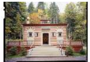
Lin. I, Marokkanisches Haus, DE000098, BSV