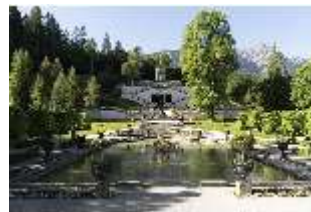
Lin.V, Wasserparterre mit Springbrunnengruppe und Terrassengärten, DI016679, RSV-