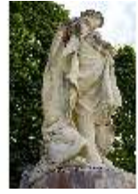
Lin.V, Gartenfigur Vier Elemente - Wasser, Lin.Gf0005, DI023279, BSV-