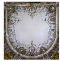
Lin.II, Decke, Gelbes Kabinett (R. 4), DI014113, BSV