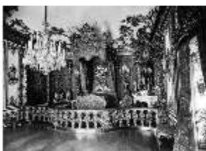
Lin.II, Erstes Schlafzimmer (R.7), Albert, vor 1884, DE002489, BSV-