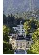
Lin.V, Kaskade und nördliche Schlossfassade, DI027025, BSV-