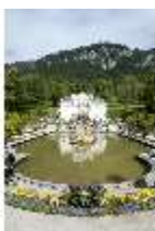
Lin.I, Hauptfassade, großes Bassin, DI005790, BSV