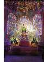
Lin.II, Maurischer Kiosk, Pfauenthron, DI004557, BSV-