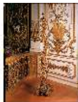
Lin.III,M, Räucherständer (1:2), R.7, DE003400, BSV-