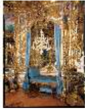
Lin.II, Spiegelsaal, R.12, Ruhebett, DE002539, BSV-