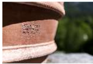
Lin.V, Terrassengärten, Terrakottatopf mit Buchsbaum (Detail), DI016747, BSV-