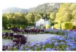
Lin.I, Hauptfassade, von Süden, Blumenrabatte, DI005828, BSV