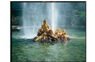
Lin.V, Springbrunnengruppe, DE000648, BSV-