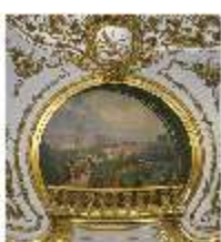
Lin.II, Audienzzimmer (R. 5) Versailles, DI014636, BSV-