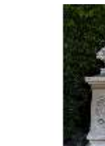
Lin.V, Terrassengärten, Marie Antoinette, DI016740, BSV-