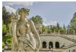
Lin.V,P, Gartenfigur: Vier Tagzeiten-Nacht-Proserpina, DI023215, BSV