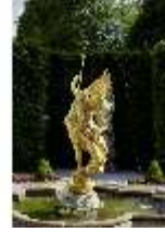
Lin.V, Brunnenfigur "Fama", westl. Gartenparterre, DI023240, BSV