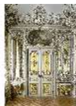
Lin.II, Gelbes Kabinett, R. 4, DI013023, BSV-