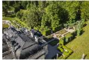
Lin.V, Westparterre, Vogelperspektive, DI016658, BSV-