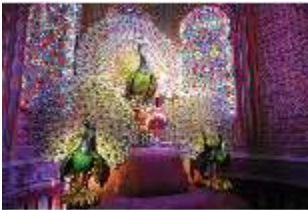
Lin.II, Maurischer Kiosk, Pfauenthron, DI004561, BSV-