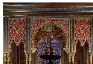
Lin.II, Maurischer Kiosk, Seitennische (Detail), DI008914, BSV-