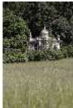
Lin.I, Maurischer Kiosk, DI005541, BSV