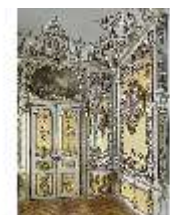
Lin.II, Gelbes Kabinett, R. 4, DI013233, BSV-