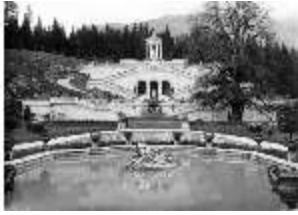
Lin.V, Terrassengärten und Königslinde, historisches Foto, DE002497, BSV