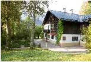
Lin. I, Königshäuschen, DI009128, BSV