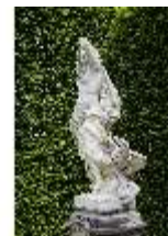
Lin.V, Gartenfigur Vier Elemente - Luft, Lin.Gf0004, DI023271, BSV-