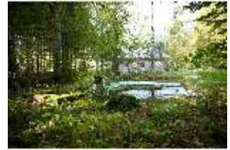
Lin.V, See vor der Hundinghütte, DI009121, BSV-