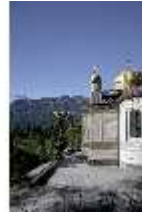
Lin.I, Maurischer Kiosk, DI005507, BSV