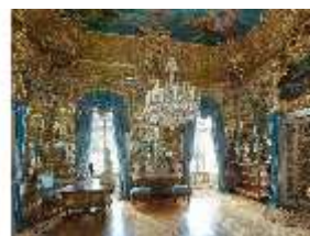
Lin.II, Spiegelsaal, R. 12, DI015947, BSV