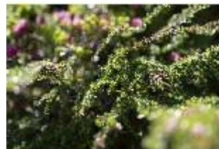
Lin.V, Terrassengärten, Detail Bepflanzung, DI016748, BSV-