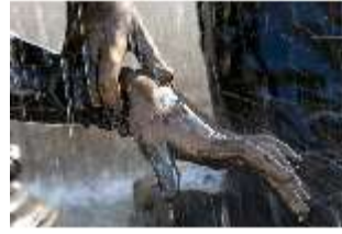
Lin.V, Terrassengärten, Najaden-Brunnen, DI005927, BSV