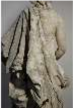
Lin.V,P, Frühling, Lin.Gf0022, DI017617, BSV