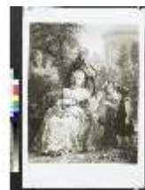
Lin.III,G, Marie Antoinette à Trianon, DI021126, BSV