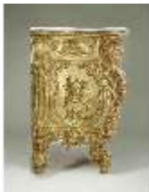
Lin.III,M, Kommode, Pössenbacher, DI015632, BSV-