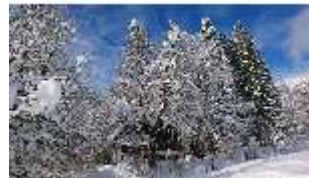
Lin.V, Königshäuschen mit Schnee im Winter, DI013264, BSV-