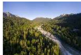
Lin.V, Graswangtal, Linder, DI016670, BSV-