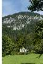
Lin.I, Maurischer Kiosk, Hauptfassade Schrägansicht, DI005849, BSV