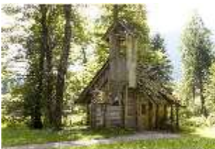
Lin.V, Einsiedelei des Gurnemanz, DI005716, BSV