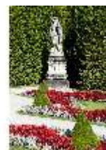
Lin.V, Westl. Parterre, Steinskulptur "Allegorie des Herbstes", DI005765, BSV