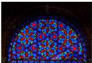
Lin.II, Maurischer Kiosk, Rundbogen mit Glasmosaik, DI008911, BSV-