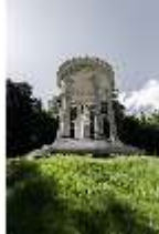
Lin.II, Rundtempel mit Venus-Statue, DI016758, BSV-