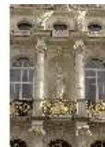
Lin.I, Nischenfigur der Victoria in der Hauptfassade, DI011890, BSV