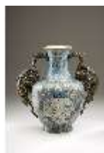
Lin.III,V, Cloisonné-Vase, DI019019, BSV-