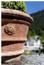
Lin.V, Terrassengärten, Terrakottatopf mit Buchsbaum, DI016746, BSV-