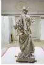
Lin.V,P, Frühling, UV-Licht_Vergl., Lin.Gf0022, DI019660, BSV