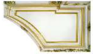
Lin.II, Decke, DI014110, BSV