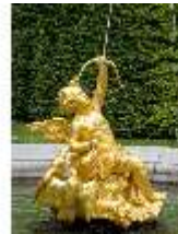
Lin.V, Östl. Parterre, Springbrunnengruppe "Amor mit Putten", DI006136, BSV