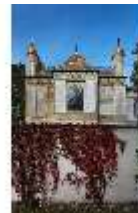
Lin. I, Maurischer Kiosk, DI008883, BSV