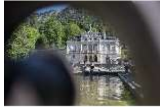
Lin.V, Wasserparterre, Blick auf Hauptfassade, DI016721, BSV-