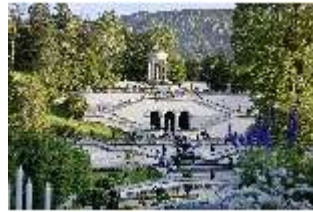
Lin.VI, Ludwignacht 2015, DI008616, BSV-