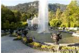
Lin.I, Hauptfassade von S, großes Bassin, Fontäne, DI005825, BSV