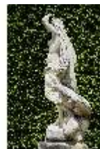
Lin.V, Gartenfigur Vier Elemente - Luft, Lin.Gf0004, DI023266, BSV-