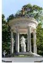
Lin.V, Terrassengärten, Venustempel, DI005689, BSV