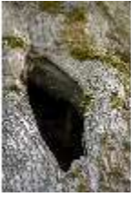
Lin.V, Königslinde, Loch, DI016770, BSV-