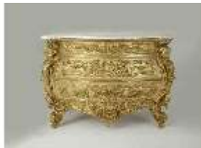
Lin.III,M, Kommode, Pössenbacher, DI015633, BSV-