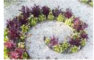
Lin.V, Wasserparterre, Blumenrabatt (Detail), DI005958, BSV