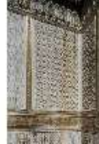
Lin.I, Maurischer Kiosk, Detail, DI000370, BSV