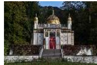
Lin. I, Maurischer Kiosk, DI008884, BSV