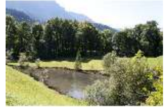
Lin.V, Schwanenweiher, DI005748, BSV