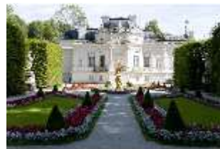
Lin.I, Westfassade, Parterre, mit Brunnenfigur "Fama", DI005888, BSV