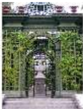
Lin.V, östl. Parterre, Steinbüste König Ludwigs XVI., DI006138, BSV