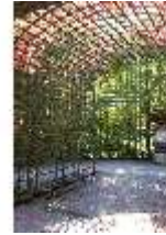
Lin.V, Westliches Parterre, Treillage-Architektur, DI005916, BSV