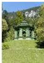
Lin.V, Musikpavillon, DI005699, BSV