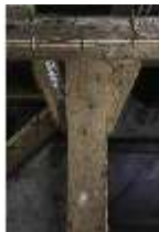
Lin.II, Tenne Träger, DI021092, BSV-