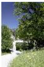
Lin.V, Blumendetail, DI005547, BSV