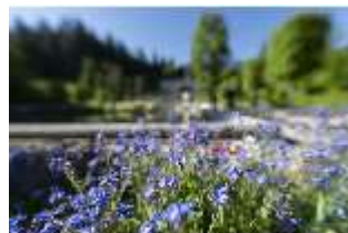
Lin.V, Wasserparterre, Detail Blumenrabatte, DI016683, BSV-