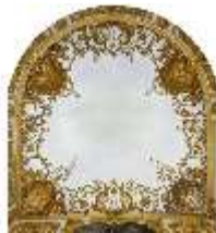
Lin.II, Decke, Lila Kabinett (R. 6), DI014115, BSV