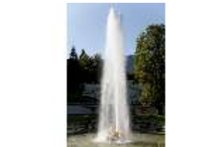
Lin.V, Wasserparterre, Fontäne, DI005906, BSV