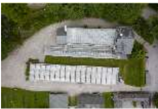
Lin.V, Gärtnerei, Vogelperspektive, DI016645, BSV-