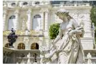
Lin.V,P, Gartenfigur: Die vier Tagzeiten - Mittag - Venus, DI023221, BSV