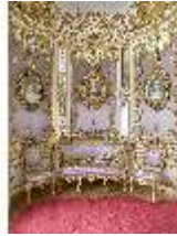
Lin.II, Lila Kabinett, R. 6, DI013024, BSV-