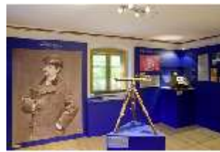
Lin.VII, Ausstellung im Königshäuschen, DI021105, BSV-