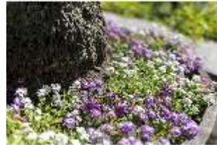
Lin.V, Maurischer Kiosk, Bepflanzung, DI016787, BSV-