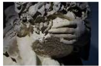
Lin.V,P, Frühling, Lin.Gf0022, DI017608, BSV