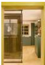
Lin.VII, Ausstellung im Königshäuschen, DI021115, BSV-