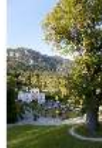
Lin.I, Hauptfassade von S-W, von der unteren Terrasse, Linde, DI005774, BSV