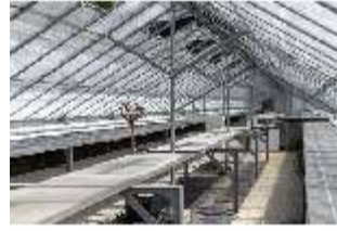
Lin.V, Gärtnerei, DI016810, BSV-