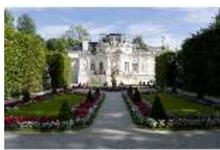
Lin.I, Westfassade, Parterre, mit Brunnenfigur "Fama", DI005891, BSV