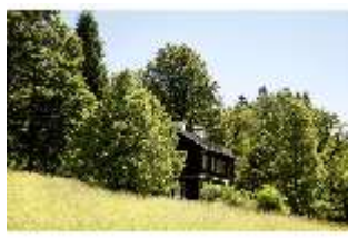
Lin.I, Ehemalige Bauhütte, DI005535, BSV