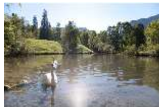
Lin.V, Schwanenweiher, DI005738, BSV