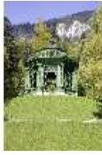
Lin.V, Musikpavillon, DI006095, BSV