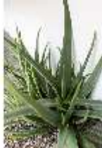
Lin.V, Gärtnerei, Aloe vera, DI016806, BSV-