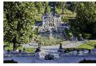
Lin.V, Hauptfassade u. Wasserparterre v. d. Terrassengärten aus, DI027053 BSV.