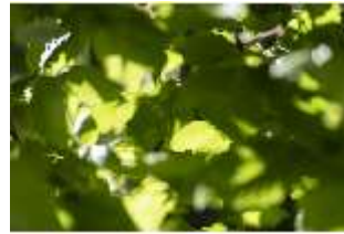
Lin.V, Hainbuchenhecke (Detail), DI016702, BSV-