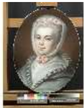
Lin.III,G, Porträt, Béatrix de Choiseul-Stainville, Lin.G0033, DI004352, BSV