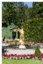
Lin.V, Westliches Parterre, Brunnenfigur der "Fama", DI005909, BSV