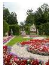
Lin.V, Östl. Parterre, Teppichparterre mit Blumenrabatten, DI006132, RSV