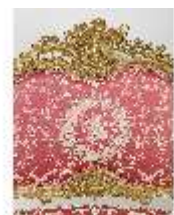
Lin.III,M, Kanapee (Lehne), Lin.M0032, DI024873, BSV-