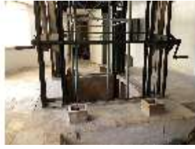
Lin.II, Technik, Tischlein deck dich, DI016003, BSV-