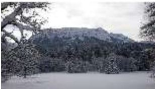
Lin.V, Garten mit Schnee im Winter, DI013282, BSV-