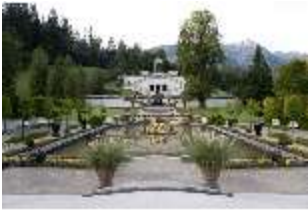
Lin.V, Wasserparterre, großes Bassin, Terrassengärten, DI005712, BSV