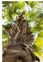
Lin.V, Maurischer Kiosk, Palmen-Bepflanzung davor, DI016788, BSV-