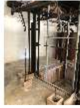
Lin.II, Technik, Tischlein deck dich, DI016004, BSV-