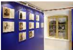
Lin.VII, Ausstellung im Königshäuschen, DI021111, BSV-