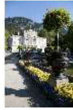
Lin.I, Hauptfassade, großes Bassin, Volutenkratervasen, DI005822, BSV