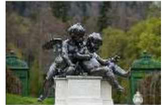
Lin.V, Putti am Neptun-Brunnen, Nordhang, DI028289, BSV-