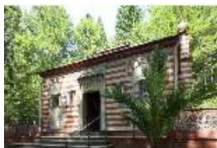
Lin. I, Marokkanisches Haus, DI000379, BSV