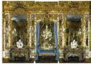
Lin.II, Spiegelsaal, R.12, Ruhebett und Kamine, DI013427, BSV-