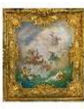
Lin.II, Deckengemälde, Östl. Gobelinzimmer (R. 11), DI014119, BSV