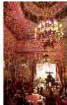
Lin.VI, Ludwignacht 2015, DI008643, BSV-