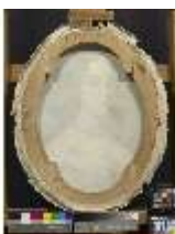
Lin.III,G, Porträt (Pastell), Louise Julie de Mailly-Nesle, DI009824