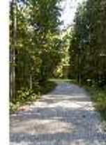
Lin.V, Weg durch den Wald, DI005935, BSV