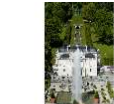
Lin.I, Hauptfassade von S, von Terrassengärten auf Nordhang, DI005804, BSV