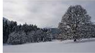
Lin.V, Garten mit Schnee im Winter, DI013280, BSV-