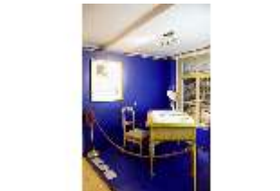
Lin.VII, Ausstellung im Königshäuschen, DI021113, BSV-