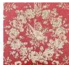
Lin.III,M, Kanapee (Det.), Lin.M0032, DI024875, BSV-