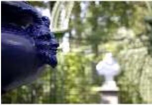
Lin.V, Westliches Parterre, Vase mit Faunköpfen als Handhaben, DI006113, BSV