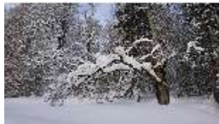
Lin.V, Garten mit Schnee im Winter, DI013283, BSV-