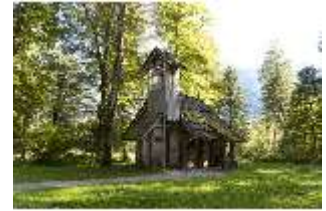
Lin.V, Einsiedelei des Gurnemanz, DI005715, BSV