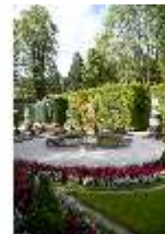
Lin.V, Westliches Parterre, Brunnenfigur der "Fama", DI006047, BSV