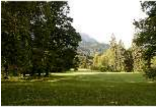
Lin.V, Landschaftlicher Garten, DI005967, BSV