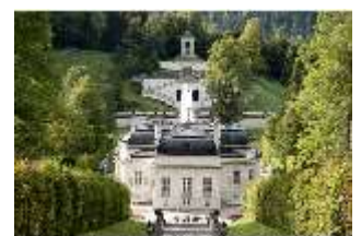
Lin.I,Nordfassade, Kaskade d.Nordhanges bis Terrassengärten, DI005885, RSV