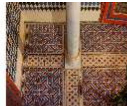
Lin.II, Marokkanisches Haus, Mosaik-Bodenfliesen, DI008947, BSV-