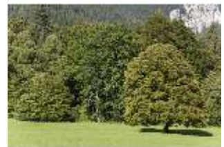
Lin.V, Landschaftlicher Garten, DI005694, BSV