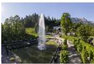
Lin.V, Wasserparterre mit Springbrunnengruppe, DI016672, BSV-