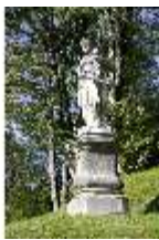
Lin.V, Nordhang, allegor. Steinfigur (einer der 4 Kontinente), DI006104, BSV