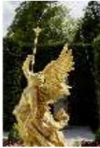
Lin.V, Brunnenfigur "Fama", westl. Gartenparterre, DI023241, BSV