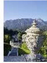
Lin.V, Obere Kaskade, Kalksteinvase (Detail) v. Philipp Perron, DI027029, RSV.