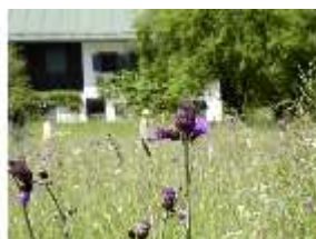
Lin.V, Blumendetail vor Königshäuschen, DI005573, BSV