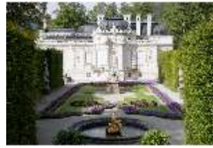
Lin.I, Ostfassade und östliches Parterre, DI005856, BSV