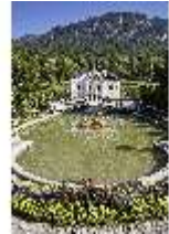
Lin.V, Hauptfassade mit Wasserparterre und Flora-Brunnen, DI027030, BSV-