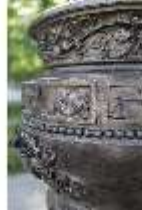
Lin.V, Wasserparterre, Zinkgussvase (Detail), DI016714, BSV-