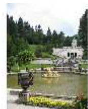
Lin.V, Wasserparterre, Terrassengärten und Venustempel, DI006121, BSV