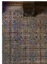
Lin.II, Maurischer Kiosk, Bodenfliesen, DI008924, BSV-