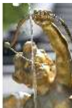
Lin.V, "Pfeilschießender Amor mit Tauben", DI016708, BSV-