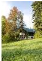
Lin.V, Blick Richtung Königshäuschen, DI009130, BSV-