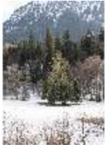
Lin.V, Schlosspark im Winter, DI025156, BSV-