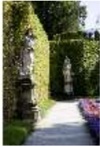
Lin.V, Östl. Parterre, allegori. Steinfiguren der vier Elemente, DI006100, BSV