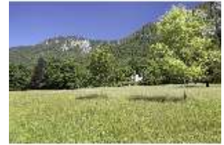
Lin.V, Wiese, DI005539, BSV