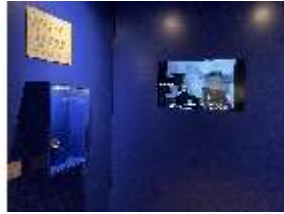
Lin.VII, Dauerausstellung im Königshäuschen, DI027018, BSV-