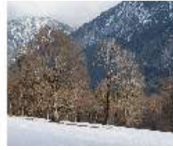
Lin.V, Schlosspark im Winter, DI025158, BSV-