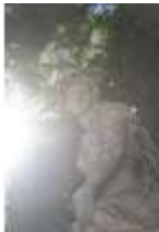
Lin.V, Östliches Parterre, Allegorie des Wassers, DI016699, BSV-