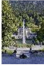
Lin.V, Hauptfassade u. Wasserparterre v. d. Terrassengärten aus, DI027048 BSV.