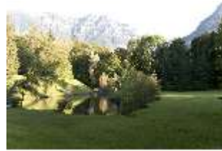
Lin.V, Schwanenweiher, DI005751, BSV