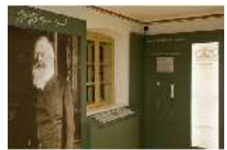
Lin.VII, Ausstellung im Königshäuschen, DI021118, BSV-