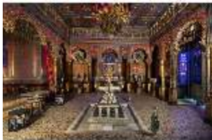
Lin.II, Maurischer Kiosk, Hauptraum, DI008902, BSV-