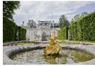
Lin.V, Östl. Parterre, Brunnenfigur "Amor mit Tauben", DI023229, BSV