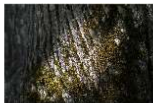
Lin.V, Königslinde, Baumrinde, DI016769, BSV-