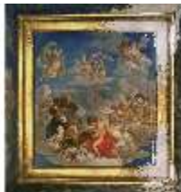
Lin.II, Deckengemälde, Bad, DI014109, BSV