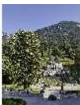
Lin.V, Hauptfassade mit Wasserparterre und sog. Königslinde, DI027044, BSV-