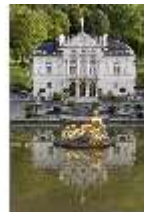
Lin.I, Hauptfassade, großes Bassin, DI005784, BSV