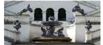
Lin.V, Terrassengärten, Najadenbrunnen/Nereidenbrunnen, DI000367, BSV