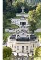
Lin.I,Nordfassade, Kaskade d.Nordhanges bis Terrassengärten, DI005876, RSV