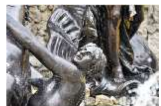
Lin.V, Fischschwänziger Reiter, Neptun-Brunnen, Nordhang, DI028291, BSV-