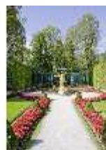
Lin.V, Westl. Parterre, Brunnenfigur der "Fama", DI006116, BSV