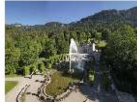
Lin.V, Vogelperspektive, DI016654, BSV-