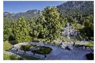
Lin.V, Hauptfassade u. Wasserparterre v. d. Terrassengärten aus, DI027050 BSV.