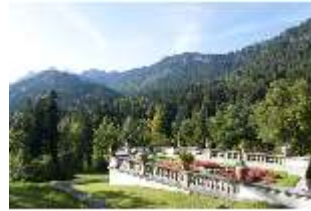
Lin.V, Terrassengärten, 2. Terrasse, DI005664, BSV