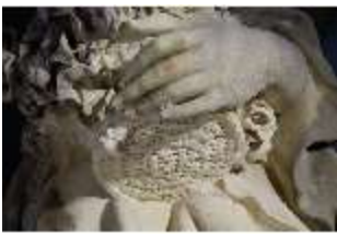
Lin.V,P, Frühling, Lin.Gf0022, DI017609, BSV