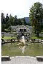
Lin.V, Wasserparterre, Terrassengärten, DI005977, BSV