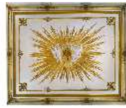
Lin.II, Decke, Äußeres Vestibül (R. 1) im Erdgeschoss, DI014106, BSV