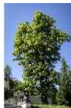
Lin.V, 300-Jährige Linde, DI016722, BSV-