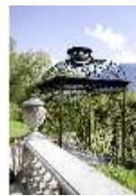
Lin.V, Nordhang, Lindenlaubengang mit Pavillon, DI006092, BSV