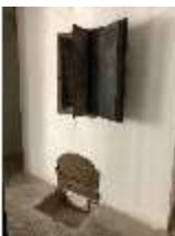
Lin.II, Technik, Heizung, DI015992, BSV-