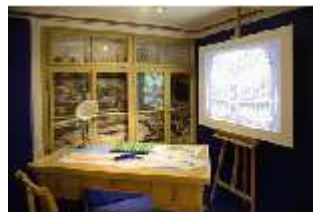
Lin.VII, Ausstellung im Königshäuschen, DI021112, BSV-