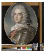
Lin.III,G, Louis Charles Auguste Duc de Belle-Isle, Lin.G0028, DI013877, BSV