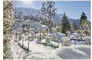
Lin.V, Blick auf die Terrassengärten verschneit im Winter, DI007341, BSV-