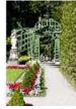
Lin.V, Westliches Parterre, Treillage-Architektur, DI005707, BSV