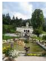
Lin.V, Wasserparterre, Terrassengärten mit Venustempel, DI006128, BSV