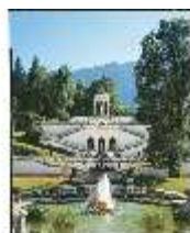
Lin.V, Wasserparterre mit Terrassengärten und Venustempel, DE001350, RSV-