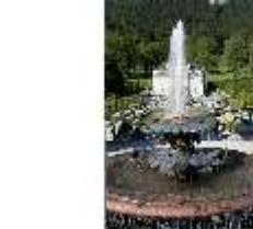
Lin.I, Hauptfassade von S, Terrassengärten mit Najadenbrunnen, DI005763, RSV