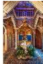
Lin.II, Marokkanisches Haus, Blick in den Hof Richtung Rauchzimmer, DI008942, BSV-