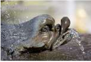
Lin.V, Terrassengärten, Najaden-Brunnen, Detail, DI006080, BSV