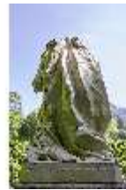
Lin.V, Gartenfigur Vier Jahreszeiten - Winter, Lin.Gf0019, DI023318, BSV-