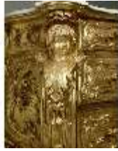
Lin.III,M,Kommode, Pössenbacher, DI015641, BSV-