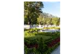
Lin.V, Terrassengärten, Teppichparterre, DI005960, BSV