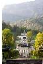
Lin.V, Blick über das Schloss zu den Terrassengärten, DI009135, BSV-