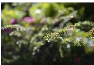
Lin.V, Terrassengärten, Detail Bepflanzung, DI016750, BSV-