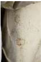
Lin.V,P, Frühling, Lin.Gf0022, DI017605, BSV