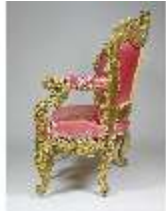
Lin.III,M, Kanapee (seitl.), Lin.M0032, DI024874, BSV-