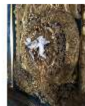
Lin.III,M, Weihwassergefäß, Schlafzimmer, R.7, DI019488, BSV