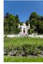
Lin.I, Maurischer Kiosk, Ansicht der Hauptfassade, DI005843, BSV