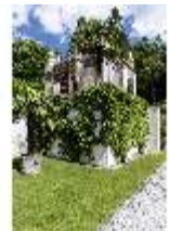
Lin.I, Maurischer Kiosk, DI016779, BSV-