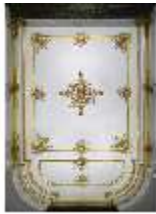
Lin.II, Decke, Inneres Vestibül im Erdgeschoss, DI014108, BSV