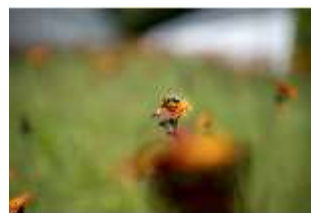
Lin.V, Wiese hinter der Gärtnerei, Biene (Detail), DI016816, BSV-