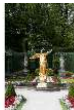
Lin.V, Westliches Parterre, Brunnenfigur der "Fama", DI005670, BSV