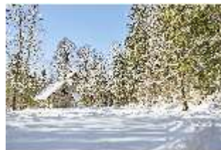
Lin.V, Einsiedelei des Gurnemanz verschneit im Winter, DI007334, BSV-