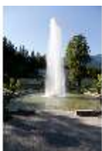
Lin.V, Wasserparterre mit Springbrunnengruppe/Fontäne, DI005634, BSV