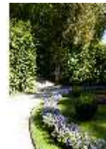
Lin.V, Östliches Parterre, Laubengang mit Sternbeet, DI005918, BSV