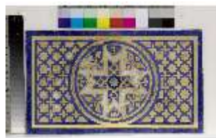
Lin.II, Maurischer Kiosk, Thronnische (Detail), DI021391, BSV-