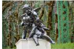
Lin.V, Putti am Neptun-Brunnen, Nordhang, DI028288, BSV-