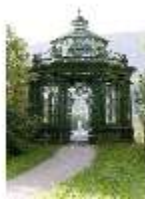
Lin.V, Musikpavillon, DI005720, BSV