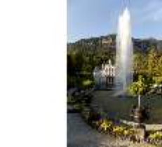
Lin.I, Hauptfassade von S, großes Bassin, Fontäne, DI005824, BSV