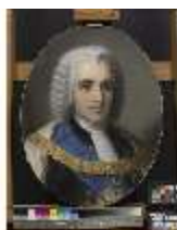
Lin.III,G, Porträt (Pastell), Franç.Arm.de Vignerot du Plessis, DI009830, BSV