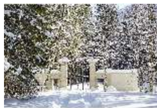
Lin.V, Verbotenes Tor verschneit im Winter, DI007332, BSV-