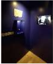
Lin.VII, Dauerausstellung im Königshäuschen, DI027017, BSV-