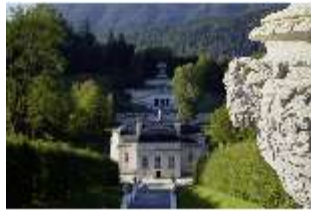
Lin.V, Obere Kaskade, Kalksteinvase (Detail) v. Philipp Perron, DI027027, RSV.