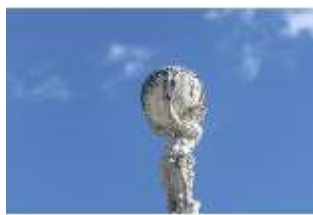
Lin.I, Giebel Mittelrisalit, Atlas, DI016712, BSV-