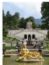
Lin.V, Wasserparterre, Terrassengärten und Venustempel, DI006120, BSV