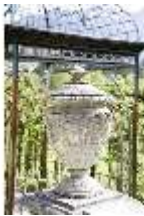
Lin.V, Nordhang mit Kaskade, Zervase, DI006091, BSV