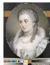
Lin.III,G, Herzogin von Egmont-Pignatelli, Lin.G0025, DI015486, BSV