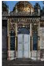
Lin.I, Maurischer Kiosk, Süd-West Fassade, Mittelrisalit, DI008885, BSV