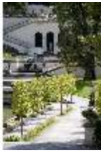
Lin.V, Wasserparterre, seitlicher Blick auf Terrassengärten, DI006049, BSV