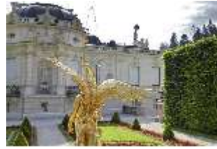
Lin.V, Brunnenfigur "Fama", westl. Gartenparterre, DI023243, BSV