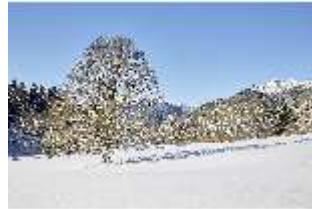
Lin.V, Schlosspark und Berge verschneit im Winter, DI007330, BSV-