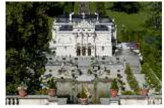
Lin.I, Hauptfassade von S, auf Höhe d. oberen Terrassengärten, DI005801, RSV