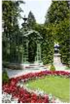
Lin.V, Westl. Parterre, Treillage-Architektur, Majolika-Vase, DI005976, BSV