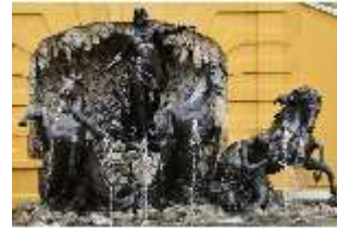
Lin.V, Neptun-Brunnen, restaurierte Kaskade (2023), Nordhang, DI028309, BSV-