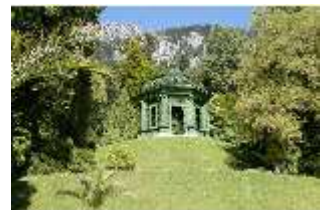
Lin.V, Musikpavillon, DI005645, BSV