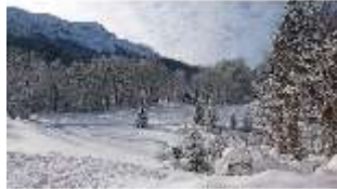
Lin.V, Garten mit Schnee im Winter, DI013260, BSV-