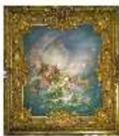
Lin.II, Deckengemälde, Westl. Gobelinzim. (Musikzimmer), DI014112, BSV