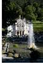
Lin.I, Hauptfassade von Süden, Bassin mit Springbrunnengruppe, DI005755, BSV