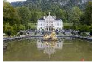
Lin.I, Hauptfassade, großes Bassin, DI005780, BSV