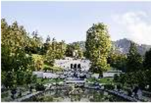
Lin.VI, Ludwignacht 2015, DI008619, BSV-