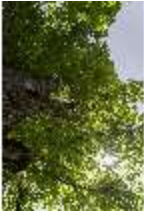
Lin.V, Königslinde, Blick in den Baum, DI016772, BSV-