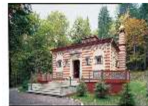
Lin. I, Marokkanisches Haus, DE000065, BSV