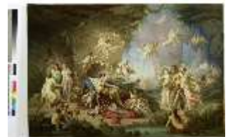
Lin.III, Tannhäuser im Venusberg, Heckel, Entwurf, DI012893, BSV