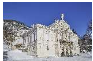
Lin.I, Hauptfassade verschneit im Winter, DI007339, BSV-