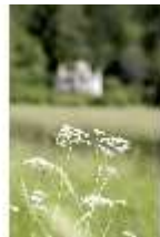
Lin.V, Blumendetail, DI005543, BSV