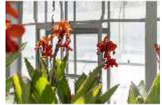
Lin.V, Gärtnerei, Canna x generalis, DI016804, BSV-