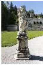
Lin.V, Wasserparterre, Skulptur "Tag", DI016719, BSV-