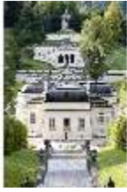
Lin.I,Nordfassade, Kaskade d.Nordhanges bis Terrassengärten, DI005878, RSV