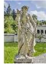
Lin.V, Gartenfigur Die vier Tagzeiten-Nacht-Proserpina, Lin.Gf0028, DI023354, BSV-