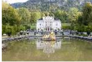
Lin.I, Hauptfassade, großes Bassin, DI005779, BSV