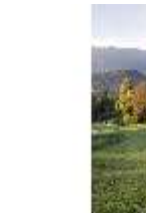
Lin.V, Blick Richtung Königshäuschen, DI009125, BSV-