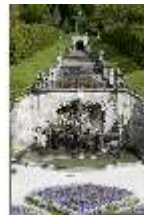
Lin.V, Nordhang mit Kaskade, Neptunbrunnen, DI005730, BSV