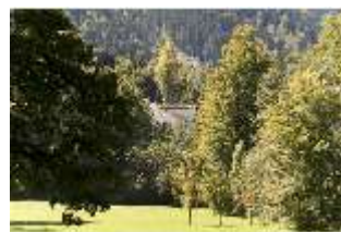
Lin.V, Landschaftsgarten, Hintergrund Terrassengärten, DI005921, BSV