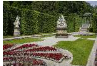
Lin.V, Östliches Parterre, "Venus und Adonis", DI023226, BSV