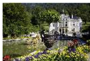
Lin.V, Hauptfassade mit Wasserparterre und Zinkgußvase, DI027042, BSV-