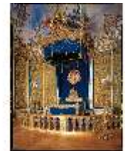
Lin.II, Schlafzimmer, R.7, Bettalkoven, DE001354, BSV-