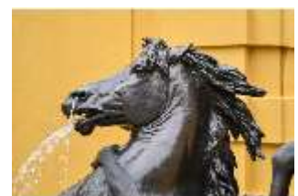
Lin.V, Pferd, Neptun-Brunnen, Nordhang, DI028306, BSV-