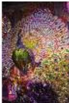
Lin.II, Maurischer Kiosk, Pfauenthron (Detail), DI004558, BSV-