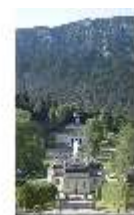
Lin.I, Nordfassade, Terrassengärten und Venustempel, DI000366, BSV