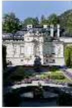
Lin.I, Ostfassade und östliches Parterre, DI005854, BSV