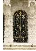
Lin.I, Türgitter der Hauptfassade, DI011894, BSV-