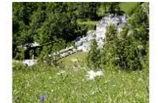
Lin.V, Blick durch Blumen auf das Schloss, DI005571, BSV