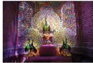
Lin.II, Maurischer Kiosk, Pfauenthron, DI004556, BSV-