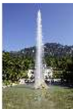
Lin.V, Hauptfassade mit Wasserparterre und Flora-Brunnen, DI027036, BSV-