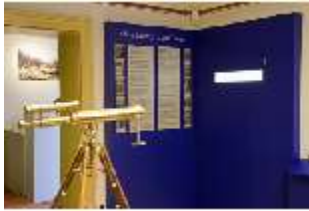
Lin.VII, Ausstellung im Königshäuschen, DI021107, BSV-