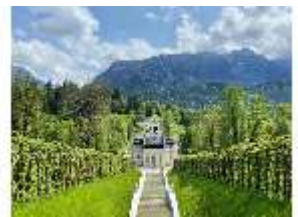
Lin.V, Nordhang, restaurierte Kaskade (2023), DI026554, BSV