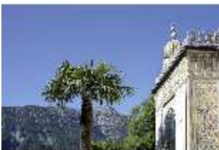
Lin.I, Maurischer Kiosk, Palme, DI005520, BSV