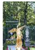
Lin.V, Westliches Parterre, Brunnenfigur der "Fama", DI005956, BSV