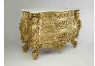
Lin.III,M, Kommode, Pössenbacher, DI015631, BSV-