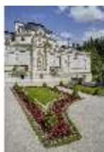
Lin.V, Westfassade und westliches Gartenparterre, DI023236, BSV