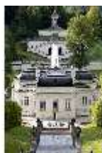
Lin.I,Nordfassade, Kaskade d.Nordhanges bis Terrassengärten, DI005883, RSV