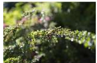
Lin.V, Terrassengärten, Detail Bepflanzung, DI016749, BSV-