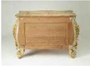
Lin.III,M,Kommode, Pössenbacher, DI015640, BSV-