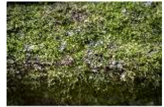
Lin.V, Wald, bemooster Baumstamm, DI016793, BSV-