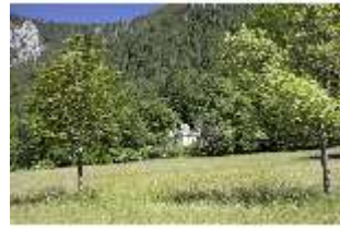
Lin.V, Maurischer Kiosk, DI005538, BSV