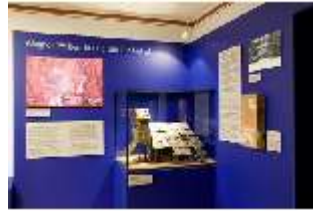
Lin.VII, Ausstellung im Königshäuschen, DI021108, BSV-