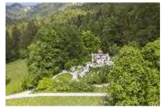
Lin.I, Maurischer Kiosk, DI016661, BSV-