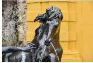
Lin.V, Pferd, Neptun-Brunnen, Nordhang, DI028298, BSV-