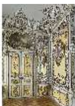
Lin.II, Gelbes Kabinett, R. 4, DI013022, BSV-