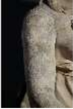
Lin.V,P, Frühling, Lin.Gf0022, DI017601, BSV