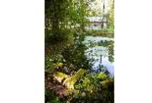
Lin.V, See vor der Hundinghütte, DI009120, BSV-