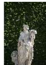
Lin.V, Allegorie der Frühling, DI016698, BSV-