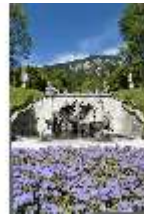
Lin.V, Nordhang mit Kaskade, Neptunbrunnen, DI005734, BSV