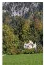
Lin.V, Blick Richtung Maurischer Kiosk, DI009133, BSV-