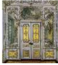
Lin.II, Gelbes Kabinett, R.4, DI010018, BSV-