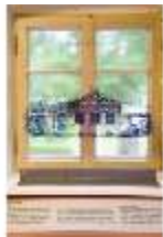
Lin.VII, Ausstellung im Königshäuschen, DI021103, BSV-