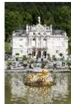
Lin.I, Hauptfassade, großes Bassin, DI005788, BSV