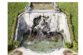
Lin.V, Nordhang mit Kaskade, Neptunbrunnen, DI006088, BSV