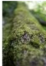
Lin.V, Wald, bemooster Baumstamm, DI016795, BSV-