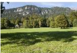
Lin.V, Landschaftlicher Garten, DI005696, BSV