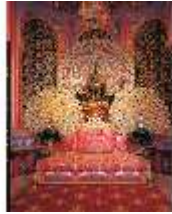
Lin.II, Maurischer Kiosk, Pfauenthron (Hochformat), DE001221, BSV-