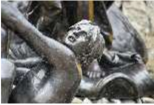
Lin.V, Fischschwänziger Reiter, Neptun-Brunnen, Nordhang, DI028295, BSV-