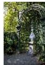
Lin.V, Westliches Parterre, Büste König Ludwig XIV., DI006114, BSV