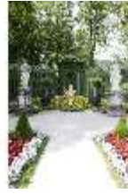
Lin.V, Westliches Parterre, Treillage-Architektur, DI005671, BSV