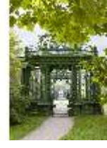
Lin.V, Musikpavillon, DI005723, BSV