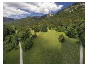
Lin.V, Vogelperspektive, DI016659, BSV-