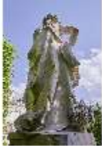
Lin.V, Gartenfigur Vier Jahreszeiten - Sommer, Lin.Gf0020, DI023326, BSV-