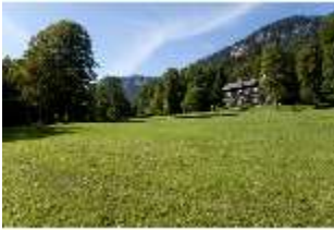
Lin.V, Ehemalige Bauhütte, DI005934, BSV