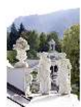
Lin.I, Hauptfassade, Blick vom Dach auf den Venustempel, DI006082, BSV