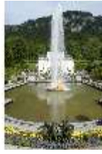
Lin.I, Hauptfassade, großes Bassin, DI005795, BSV