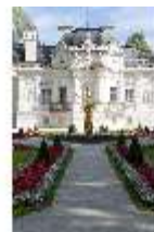
Lin.I, Westfassade, Parterre, mit Brunnenfigur "Fama", DI005892, BSV