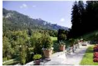
Lin.V, Terrassengärten, 2. Terrasse, DI006106, BSV