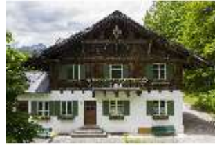
Lin.V, Gärtnerei, DI016642, BSV-