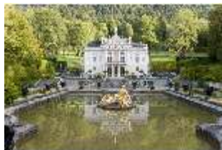
Lin.I, Hauptfassade, großes Bassin, DI005787, BSV