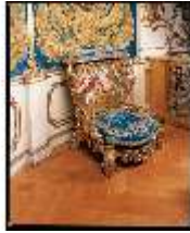
Lin.III, M, Betbank, R.7, M 95, DE003399, BSV-