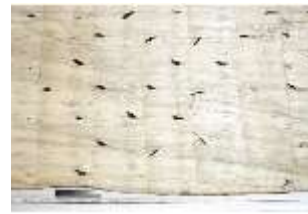
Lin.III,T, Hermelinbehang, DI018760, BSV