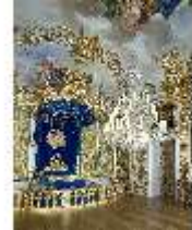
Lin.II, Schlafzimmer, R. 7, DI013025, BSV-