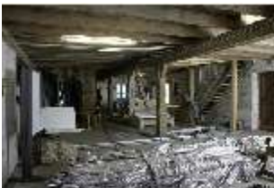
Lin.II, Tenne, DI021090, BSV-