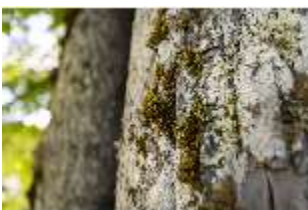
Lin.V, Königslinde, Baumrinde, DI016776, BSV-