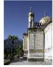
Lin.I, Maurischer Kiosk, DI005504, BSV