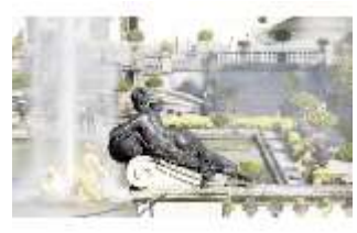
Lin.V, Terrassengärten, 1. Terrasse, lagernde Nymphe, DI006079, BSV