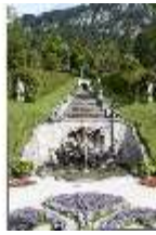
Lin.V, Nordhang mit Kaskade, Neptunbrunnen, DI005725, BSV