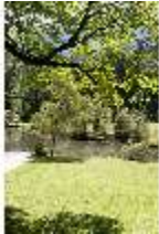
Lin.V, Schwanenweiher, DI005749, BSV