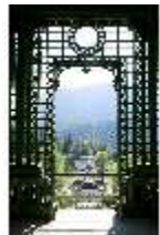
Lin.V, Blick aus dem Musikpavillon, DI009134, BSV-