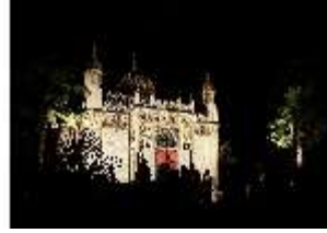
Lin.VI, Ludwignacht 2015, DI008637, BSV-