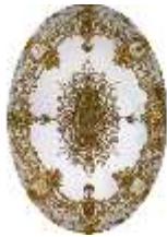
Lin.II, Decke, Audienzzimmer (R. 5), DI014114, BSV