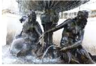
Lin.V, Terrassengärten, Najaden-Brunnen, DI005633, BSV