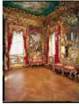
Lin.II, Westl. Gobelinzimmer, R.3 (Hochformat), DE001352, BSV-