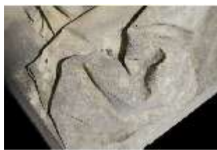
Lin.V,P, Frühling, Lin.Gf0022, DI017614, BSV