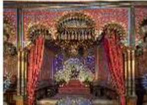
Lin.II, Maurischer Kiosk, Pfauenthron, DI008913, BSV-