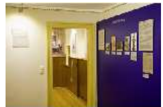
Lin.VII, Ausstellung im Königshäuschen, DI021114, BSV-