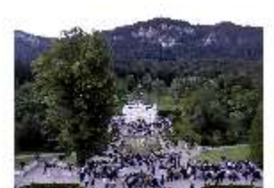
Lin.VI, Ludwignacht 2015, DI008623, BSV-