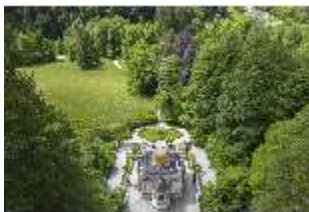
Lin.I, Maurischer Kiosk, DI016662, BSV-