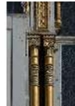
Lin.I, Maurischer Kiosk, Süd-West Fassade, Schmuckpfeiler, DI008889, BSV