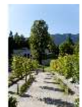
Lin.V, Wasserparterre westlich des großen Bassins, DI005635, BSV