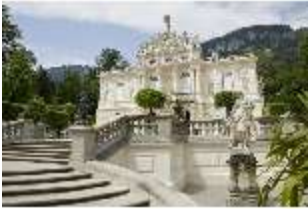
Lin. I, Hauptfassade/Südfassade des Schlosses, DI023207, BSV