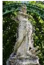
Lin.V, Gartenfigur Vier Erdteile - Amerika, Lin.Gf0009, DI023299, BSV-