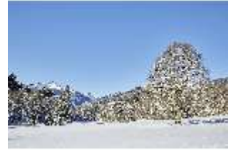
Lin.V, Schlosspark und Berge verschneit im Winter, DI007328, BSV-