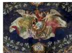
Lin.III,M, Tisch mit Mosaikplatte, R. 12, DI019605, BSV