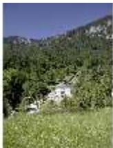
Lin.I, Blick auf das Schloss, DI005564, BSV