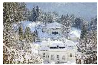
Lin.V, Hauptschloss bis zu den Terrassengärten verschneit, DI007351, BSV-