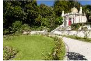
Lin.I, Maurischer Kiosk, Schrägansicht der Hauptfassade, DI005832, BSV