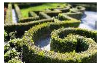
Lin.V, Terrassengärten, Teppichparterre (Detail), DI016735, BSV-