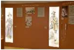
Lin.VII, Ausstellung im Königshäuschen, DI021099, BSV-