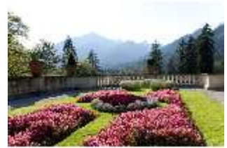
Lin.V, Terrassengärten, 2. Terrasse, DI005665, BSV