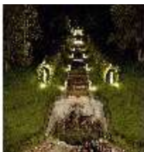
Lin.VI, Ludwignacht 2015, DI008651, BSV-