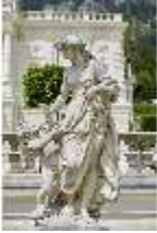
Lin.V,P, Gartenfigur: Die vier Tagzeiten - Mittag - Venus, DI023219, BSV