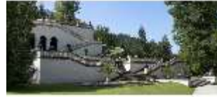
Lin.I, Terrassengärten, Schrägansicht, DI000368, BSV