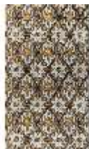
Lin.I, Maurischer Kiosk, Fassade, orienta. Ornamente, Detail, DI008899, BSV-