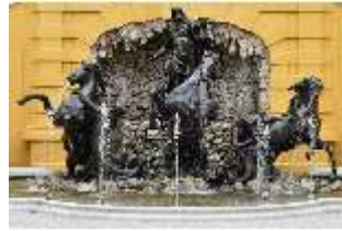
Lin.V, Neptun-Brunnen, restaurierte Kaskade (2023), Nordhang, DI028308, BSV-