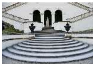
Lin.V, Terrassengärten, Steinbüste Königin Marie Antoinette, DI005903, BSV