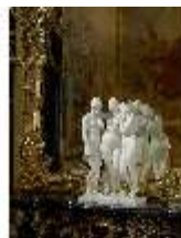
Lin.III,K, Die Drei Grazien, Inv.-Nr. Lin.P0005, DI013237, BSV-