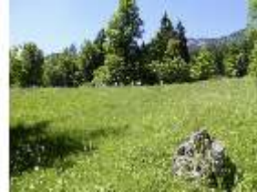
Lin.V, Wiese, DI005576, BSV