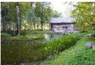
Lin.V, See vor der Hundinghütte, DI009122, BSV-