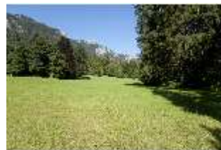
Lin.V, Landschaftlicher Garten, DI005692, BSV