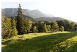
Lin.V, Landschaftlicher Garten, DI005697, BSV