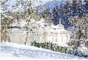
Lin.V, Laubengang und Hauptschloss verschneit, DI007355, BSV-