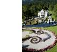
Lin.I, Hauptfassade von S, großes Bassin, Blumenrabatten, DI005823, RSV