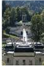
Lin.I,Nordfassade, Kaskade d.Nordhanges bis Terrassengärten, DI005870, RSV