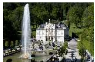
Lin.I, Hauptfassade von S-O, Bassin/Springbrunnengruppe, DI005761, BSV