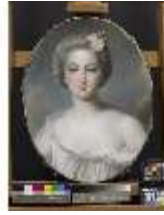
Lin.III,G, Porträt (Pastell), Pauline Félicité de Mailly-Nesle, DI009832, BSV