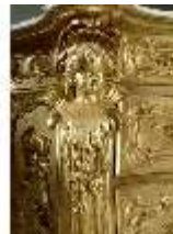
Lin.III,M, Kommode, Pössenbacher, DI015634, BSV-