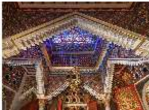
Lin.II, Marokkanisches Haus, Blick in das pyramidenförmige Oberlicht, DI008943, BSV-