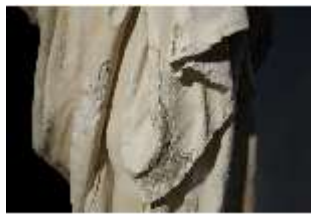
Lin.V,P, Frühling, Lin.Gf0022, DI017606, BSV