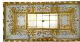
Lin.II, Decke, Treppenhaus (R. 2), DI014107, BSV