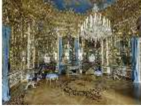
Lin.II, Spiegelsaal, R. 12, DI015949, BSV