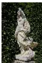
Lin.V, Gartenfigur Vier Elemente - Luft, Lin.Gf0004, DI023273, BSV-