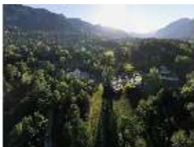
Lin.V, Gesamtanlage, Vogelperspektive, DI016651, BSV-