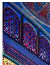
Lin.II, Maurischer Kiosk, Rundbogenöffnungen in der Tambourkuppel, DI008910, BSV-