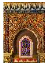
Lin.II, Marokkanisches Haus, Salon, Blendarkade (Detail), DI008931, BSV-