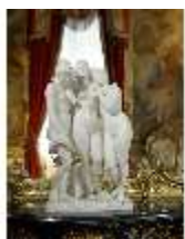
Lin.III,K, Die Drei Grazien, Inv.-Nr. Lin.P0005, DI013239, BSV-