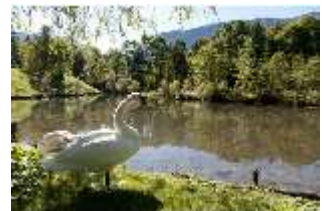
Lin.V, Schwanenweiher, DI005744, BSV