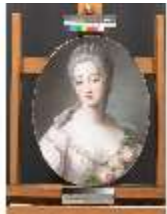
Lin.III,G, Porträt (Pastellgemälde), Jeanne Bécu, DI009055, BSV