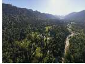
Lin.V, Vogelperspektive, DI016653, BSV-