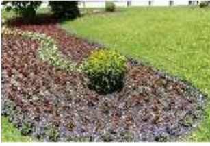
Lin.V, Blumenrabatten, DI016818, BSV-