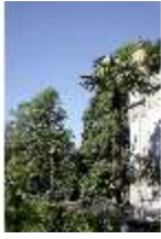
Lin.I, Maurischer Kiosk, Palmen, DI005518, BSV