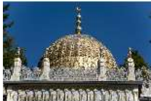
Lin.I, Maurischer Kiosk, Kuppel, DI005920, BSV