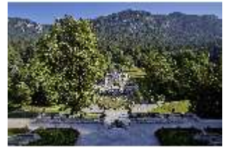
Lin.V, Hauptfassade u. Wasserparterre v. d. Terrassengärten aus, DI027054 BSV.