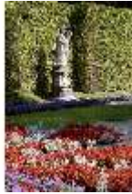
Lin.V, Östl. Parterre, allegorische Steinfigur der "Erde", DI006099, BSV