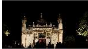
Lin.VI, Ludwignacht 2015, DI008641, BSV-