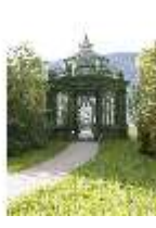
Lin.V, Musikpavillon, DI005721, BSV