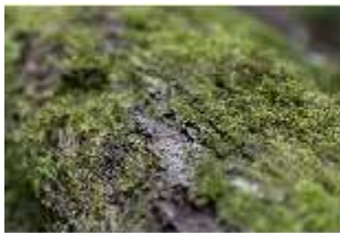
Lin.V, Wald, bemooster Baumstamm, DI016794, BSV-