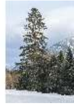
Lin.V, Schlosspark im Winter, DI025159, BSV-