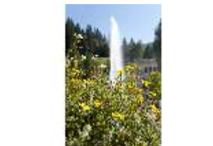
Lin.V, Wasserparterre, Fontäne, Blumen im Vordergrund, DI005924, BSV