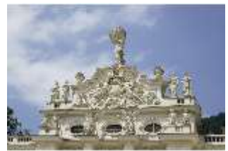
Lin.I, Giebel der Hauptfassade/Südfassade, DI023223, BSV