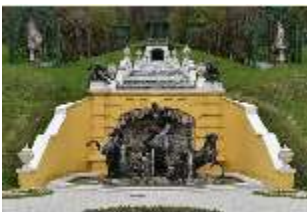
Lin.V, Neptun-Brunnen, restaurierte Kaskade (2023), Nordhang, DI028311, BSV-