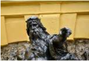
Lin.V, Neptun, Neptun- Brunnen, Nordhang, DI028301, BSV-