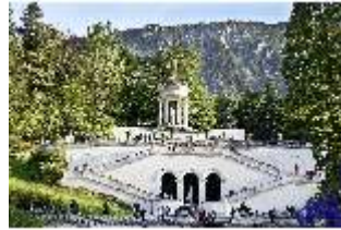
Lin.VI, Ludwignacht 2015, DI008620, BSV-