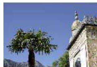
Lin.I, Maurischer Kiosk, Palmen, DI005516, BSV