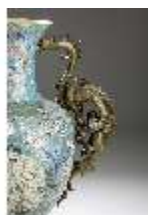
Lin.III,V, Cloisonné-Vase, DI019011, BSV-