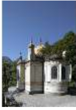
Lin.I, Maurischer Kiosk, DI000369, BSV