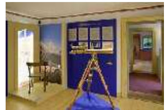
Lin.VII, Ausstellung im Königshäuschen, DI021106, BSV-