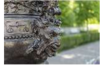
Lin.V, Wasserparterre, Zinkgussvase (Detail), DI016715, BSV-