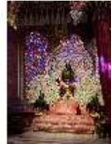
Lin.II, Maurischer Kiosk, Pfauenthron, DI005596, BSV-