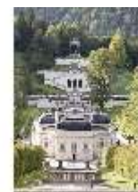
Lin.I, Nordfassade, Kaskade d. Nordhanges bis Terrassengärten, DI005873, BSV