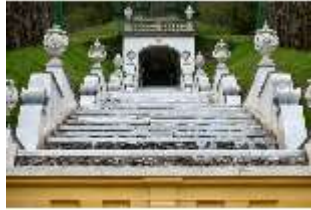
Lin.V, Marmortreppen, restaurierte Kaskade (2023), Nordhang, DI028307, BSV-