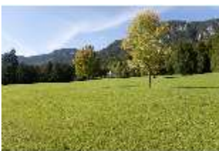
Lin.V, Landschaftlicher Garten mit Blick auf den Maurischen Kiosk, DI005933, BSV