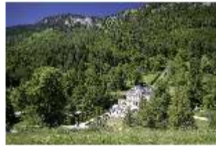
Lin.I, Blick auf das Schloss, DI005562, BSV