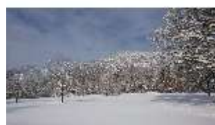
Lin.V, Garten mit Schnee im Winter, DI013273, BSV-