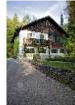
Lin. I, Königshäuschen, DI009127, BSV