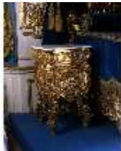
Lin.III, M, Nachtschränkchen, R.7, M 11, DE003412, BSV-