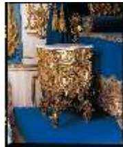
Lin.III, M, Nachtschränkchen, R.7, M 11, DE003398, BSV-