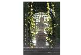
Lin.V, Östliches Parterre, Ludwig XVI., DI016709, BSV-