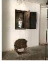
Lin.II,Technik, Heizung, DI015993, BSV-