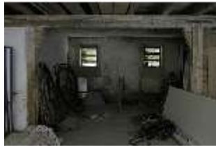
Lin.II, Tenne, DI021087, BSV-