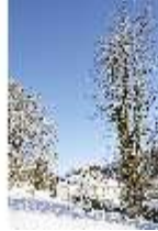
Lin.V, Laubengang und Hauptschloss verschneit, DI007357, BSV-