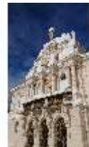
Lin.I, Fassade mit Schnee im Winter, DI013266, BSV-