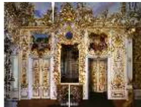
Lin.II, Schlafzimmer, R.7, DI014637, BSV-