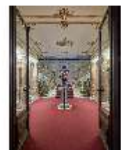
Lin.II, Vorraum zum Treppenhaus, DI013231, BSV-