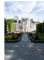
Lin.I, Westfassade, Parterre, mit Brunnenfigur "Fama", DI005889, BSV