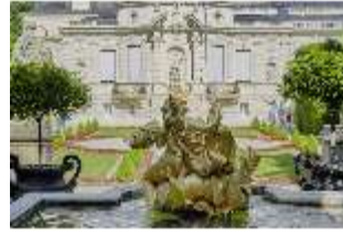
Lin.V, Brunnenfigur "Amor mit zwei Delfinen", westl. Parterre, DI023245, BSV