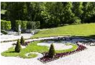
Lin.V, Schlosspark, Parterre vor den Terrassengärten, DI016732, BSV-