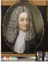
Lin.III,G, Porträt (Pastellgemälde), Germain Louis Chauvelin, DI012087, BSV