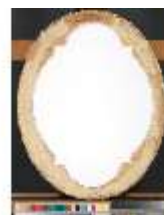
Lin.III,G, Louis Charles Auguste Duc de Belle-Isle, DI014820, BSV