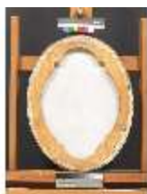
Lin.III,G, Porträt (Pastell), César Gabriel de Choiseul, DI009058, BSV