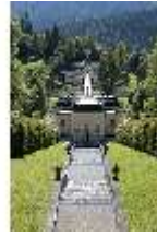
Lin.I,Nordfassade, Kaskade d.Nordhanges bis Terrassengärten, DI005872, RSV