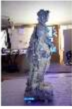
Lin.V,P, Frühling, im UV-Licht, Lin.Gf0022, DI019657, BSV