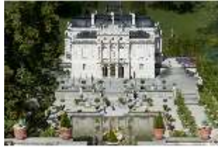
Lin.I, Hauptfassade von S, auf Höhe d. oberen Terrassengärten, DI005803, RSV