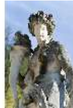
Lin.V, Wasserparterre, Steinskulptur "Allegorie der Nacht", DI005954, BSV