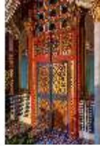
Lin.II, Marokkanisches Haus, Türe vom "Hof" zum Speisezimmer, DI008937, BSV-