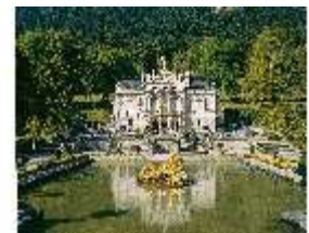
Lin.I, Südfassade und Parterre, DI008094, BSV-