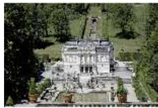
Lin.I, Blick auf das Schloss, DI005566, BSV