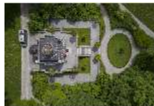
Lin.I, Maurischer Kiosk, DI016664, BSV-