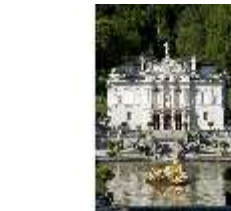
Lin.I, Hauptfassade von S, Wasserparterre mit großem Bassin, DI005767, BSV