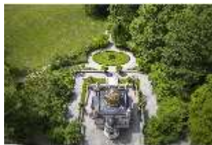
Lin.I, Maurischer Kiosk, DI016663, BSV-