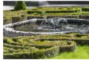
Lin.V, Terrassengärten, Teppichparterre (Detail), DI016767, BSV-