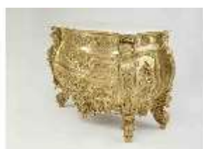
Lin.III,M, Kommode, Pössenbacher, DI015637, BSV-