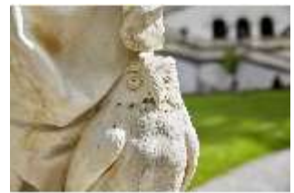
Lin.V,P, Gartenfigur: Vier Tagzeiten-Nacht-Proserpina, DI023216, BSV