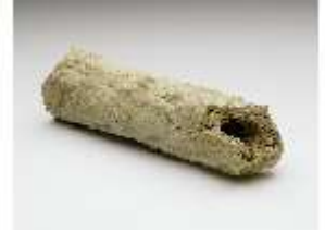
Lin.III,V, Stück e. Stalaktite, Relikt a.d. Grotte i. Linderhof, DI027500, BSV-