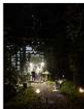
Lin.VI, Ludwignacht 2015, DI008648, BSV-