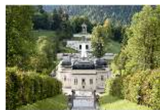
Lin.I,Nordfassade, Kaskade d.Nordhanges bis Terrassengärten, DI005884, RSV