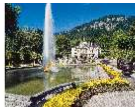
Lin.I, Südfassade und Parterre, DI008093, BSV-