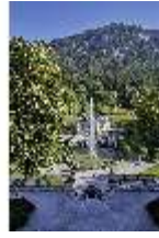
Lin.V, Hauptfassade u. Wasserparterre v. d. Terrassengärten aus, DI027049 BSV.