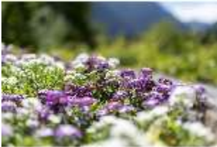
Lin.V, Maurischer Kiosk, Bepflanzung, DI016785, BSV-