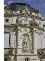
Lin.I, Westfassade des Schlosses, DI023237, BSV