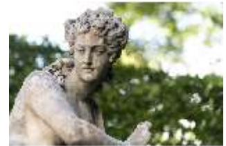
Lin.V, Östliches Parterre, Allegorie des Feuers, DI016705, BSV-