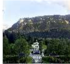
Lin.VI, Ludwignacht 2015, DI008613, BSV-