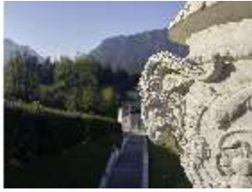
Lin.V, Obere Kaskade, Kalksteinvase (Detail) v. Philipp Perron, DI027026, RSV.