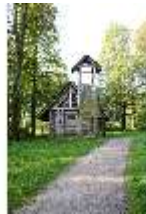
Lin.I, Einsiedelei des Gurnemannz, DI009115, BSV-