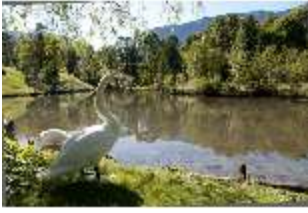
Lin.V, Schwanenweiher, DI005745, BSV