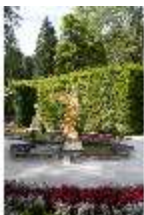
Lin.V, Westliches Parterre, Brunnenfigur der "Fama", DI006048, BSV