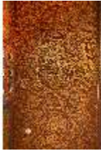
Lin.II, Marokkanisches Haus, Speisezimmer, Decke mit Ornamenten, DI008941, BSV-