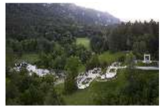
Lin.V, Gesamtanlage, Vogelperspektive, DI016649, BSV-