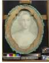
Lin.III,G, Porträt (Pastell), Pauline Félicité de Mailly-Nesle, DI009831, BSV