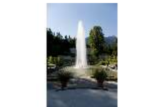
Lin.V, Wasserparterre, Fontäne, 300-jähriger Linde, DI005905, BSV