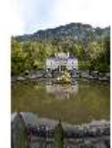
Lin.I, Hauptfassade, großes Bassin, DI005781, BSV