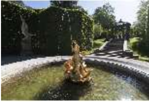
Lin.V, Östliches Parterre, DI016692, BSV-