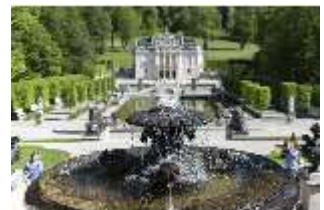
Lin.V, Schalenbrunnen mit Blick auf das Schloss, DI016738, BSV-