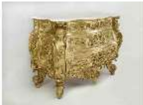
Lin.III,M, Kommode, Pössenbacher, Lin.M0188.01, DI015630, BSV-