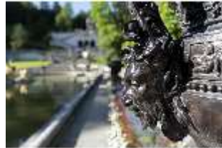
Lin.V, Wasserparterre, Zinkgussvase (Detail), DI016685, BSV-