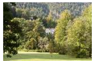
Lin.V, Landschaftsgarten, Hintergrund Terrassengärten, DI005968, BSV