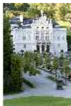
Lin.I, Hauptfassade, von S-W aus mit Wasserparterre, DI005776, BSV