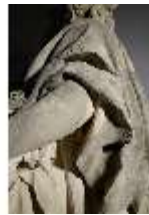
Lin.V,P, Frühling, Lin.Gf0022, DI017612, BSV