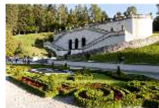
Lin.V, Terrassengärten, von Süd-Westen, Teppichparterre, DI005959, BSV