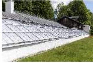
Lin.V, Gärtnerei, DI016813, BSV-