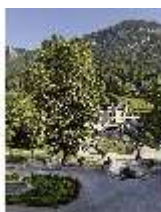
Lin.V, Hauptfassade mit Wasserparterre und sog. Königslinde, DI027045, BSV-