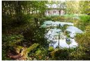
Lin.V, See vor der Hundinghütte, DI009119, BSV-