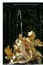
Lin.V, Westl. Parterre, Springbrunnengruppe "Amor mit Delphinen", DI005675, BSV