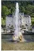
Lin.V, Flora-Brunnen mit Fontäne vor Hauptfassade, DI023210, BSV