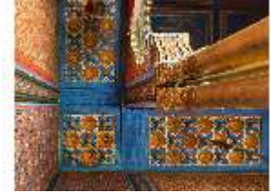
Lin.II, Maurischer Kiosk, Blick in die Decke des Arkadengangs, DI008908, BSV-