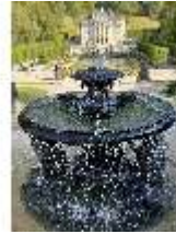
Lin.V, Najadenbrunnen (Schalenbrunnen, dreiteilig), DI027066, BSV-