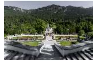
Lin.I, Hauptfassade, obere Terrassengärten, DI021053, BSV