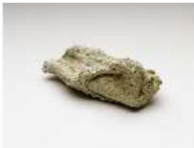
Lin.III,V, Stück e. Kalkvorhangs, Relikt a.d. Grotte i. Linderhof, DI027497, BSV-