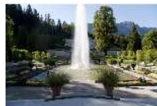
Lin.V, Wasserparterre, großes Bassin/Springbrunnengruppe, DI005703, BSV