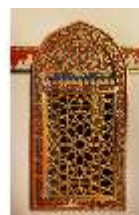
Lin.II, Marokkanisches Haus, Salon, Blendarkade, DI008933, BSV-