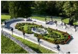
Lin.V, Terrassengärten, 1. Terrasse, DI005668, BSV