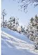
Lin.V, Blick auf den Venustempel verschneit im Winter, DI007345, BSV-