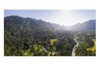
Lin.V, Vogelperspektive, DI016674, BSV-