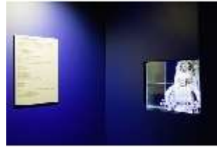
Lin.VII, Ausstellung im Königshäuschen, DI021109, BSV-