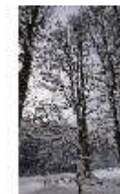
Lin.V, Garten mit Schnee im Winter, DI013284, BSV-