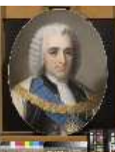
Lin.III,G, Porträt (Pastell), Franç.Arm.de Vignerot du Plessis, DI012085