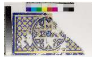
Lin.II, Maurischer Kiosk, Thronnische (Detail), DI021393, BSV-