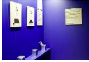
Lin.VII, Ausstellung im Königshäuschen, DI021124, BSV-