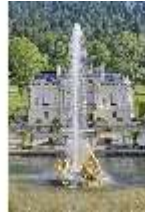
Lin.V, Flora-Brunnen mit Fontäne vor Hauptfassade, DI023212, BSV