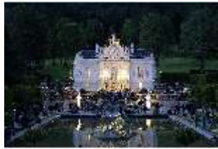
Lin.VI, Ludwignacht 2015, DI008640, BSV-