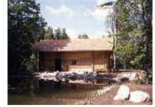
Lin. I, Hundinghütte, DE002079, BSV