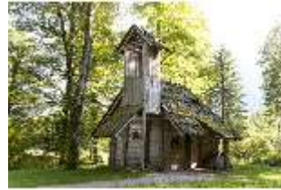
Lin.V, Einsiedelei des Gurnemanz, DI005713, BSV