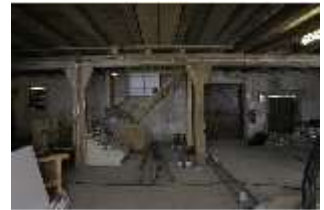
Lin.II, Tenne, DI021089, BSV-