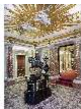
Lin.II, Vestibül, R. 1, DI013019, BSV-