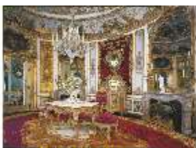
Lin.II, Speisezimmer, R.9, DE002319, BSV-