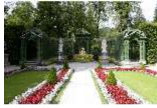
Lin.V, Westl. Parterre, Treillage-Architektur, DI005974, BSV