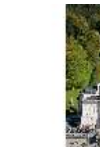
Lin.V, Blick Richtung Schloss und Musikpavillon, DI009140, BSV-