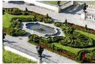
Lin.V, Terrassengärten, 1. Terrasse, DI005669, BSV