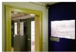
Lin.VII, Ausstellung im Königshäuschen, DI021116, BSV-