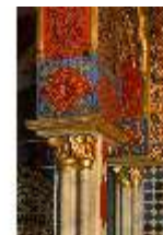
Lin.II, Marokkanisches Haus, Richtung Rauchzimmer, DI008949, BSV-