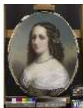
Lin.III,G, Porträt (Pastell), Louise Julie de Mailly-Nesle, DI009827, BSV