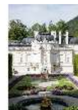
Lin.I, Ostfassade und östliches Parterre, DI005860, BSV