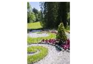
Lin.V, Parterre vor den Terrassengärten, DI016733, BSV-