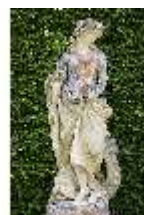
Lin.V, Gartenfigur Vier Elemente - Wasser, Lin.Gf0005, DI023274, BSV-