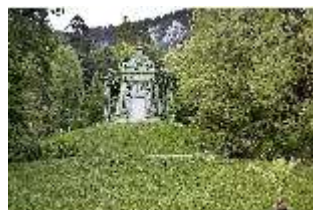
Lin.VI, Ludwignacht 2015, DI008632, BSV-