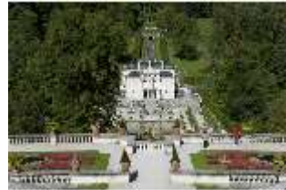
Lin.I, Hauptfassade, von S, auf Höhe d. oberen Terrassengärten, DI005800, RSV