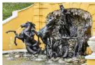
Lin.V, Neptun-Brunnen, restaurierte Kaskade (2023), Nordhang, DI028285, BSV-