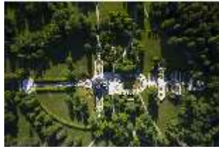
Lin.I, Vogelperspektive, DI016657, BSV-