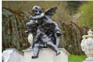
Lin.V, Putti am Neptun-Brunnen, Nordhang, DI028287, BSV-