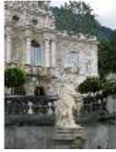
Lin.V, Wasserparterre, Steinskulptur der "Diana", DI006123, BSV