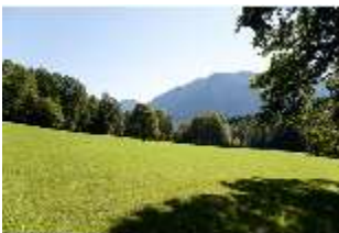
Lin.V, Landschaftlicher Garten, DI005641, BSV