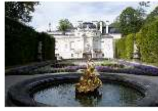
Lin.I, Ostfassade und östliches Parterre, DI005863, BSV