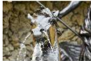
Lin.V, Pferdekopf, Neptun-Brunnen, Nordhang, DI028294, BSV-