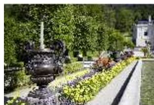
Lin.V, Zinkgußvase mit Bepflanzung, Balustrade am Wasserparterre, DI027069, BSV-