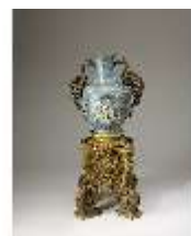
Lin.III,V, Cloisonné-Vase, DI019014, BSV-