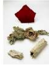
Lin.III,V, Relikte aus der Grotte in Linderhof, DI027496, BSV-