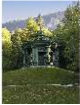
Lin.V, Musikpavillon, DI027019, BSV-