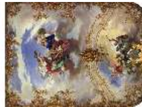
Lin.II, Deckengemälde, Schlafzimmer (R. 7), DI014116, BSV