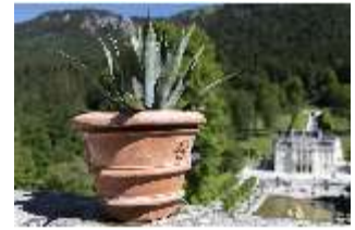
Lin.V, Terrassengärten, Terrakottatopf mit Aloe Vera, DI016754, BSV-