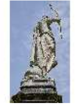
Lin.V, Gartenfigur Vier Erdteile - Afrika, Lin.Gf0008, DI023296, BSV-