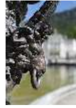
Lin.V, Wasserparterre, Zinkgussvase (Detail), DI016720, BSV-