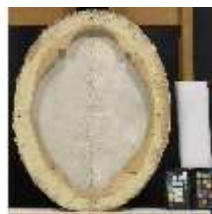
Lin.III,G, Louis Charles Auguste Duc de Belle-Isle, Lin.G0028, DI013878, BSV