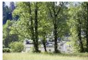
Lin.V, Blick durch Bäume von oben auf das Hauptschloss, DI023225, BSV