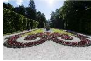
Lin.V, Östliches Parterre, DI016687, BSV-