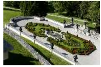
Lin.V, Terrassengärten, 1. Terrasse, DI005662, BSV