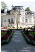
Lin.I, Westfassade, Parterre, mit Brunnenfigur "Fama", DI005890, BSV