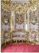
Lin.II, Lila Kabinett, R. 6, DI013235, BSV-