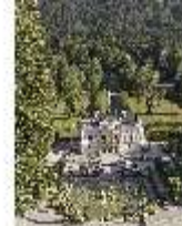
Lin.V, Hauptfassade mit Wasserparterre und Flora-Brunnen, DI027043, BSV-