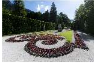
Lin.V, Östliches Parterre, DI016686, BSV-