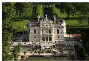
Lin.I, Hauptfassade, DI011888, BSV-