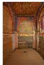
Lin.II, Marokkanisches Haus, Raum im Rohzustand, DI008950, BSV-