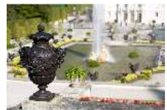
Lin.V, Vase aus Zinkguss des Terrassengartens, DI009145, BSV-