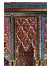
Lin.II, Maurischer Kiosk, Seitennische (Detail), DI008915, BSV-