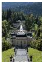
Lin.I, Nordfassade, Kaskade d. Nordhanges bis Terrassengärten, DI005871, BSV