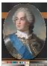
Lin.III,G, Herzog Moritz von Sachsen, Inv.-Nr. Lin.G0026, DI014817