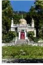
Lin.I, Maurischer Kiosk, Ansicht der Hauptfassade, DI005841, BSV