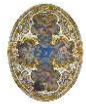
Lin.II, Deckengemälde, Speisezimmer (R. 9), DI010017, BSV-