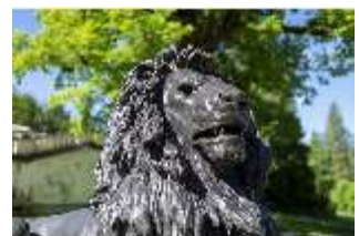
Lin.V, Terrassengärten, Löwe, DI016729, BSV-