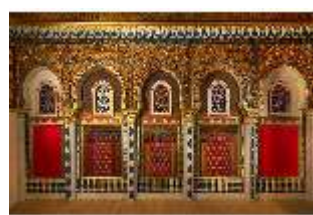
Lin.II, Marokkanisches Haus, Salon, Blendarkade, DI008930, BSV-