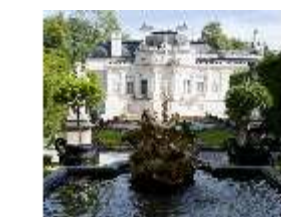
Lin.I,Westfassade, Parterre, Brunnenfigur "Amor mit Delphinen", DI005895, BSV