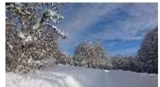
Lin.V, Garten mit Schnee im Winter, DI013270, BSV-