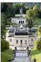
Lin.I, Nordfassade, Kaskade d. Nordhanges bis Terrassengärten, DI005879, BSV