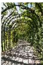
Lin.V, Nordhang mit Kaskade, Laubengang, DI005649, BSV