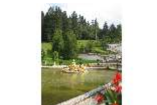
Lin.V, Wasserparterre, großes Bassin, Springbrunnengruppe, DI006117, BSV