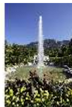
Lin.V, Hauptfassade mit Wasserparterre und Flora-Brunnen, DI027037, BSV-