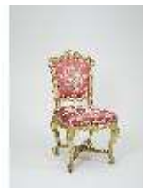
Lin.III,M, Stuhl, Lin.M0056, DI024876, BSV-