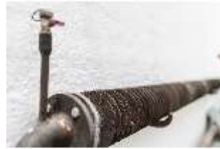
Lin.V, Gärtnerei, Bewässerung, DI016805, BSV-