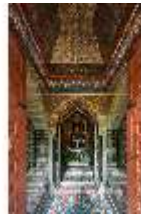
Lin.II, Marokkanisches Haus, Blick in den "Lichthof", DI008926, BSV-