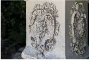
Lin.V, Terrassengärten, Marie Antoinette, Sockel, DI016742, BSV-