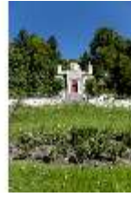
Lin.I, Maurischer Kiosk, Ansicht der Hauptfassade, DI005842, BSV