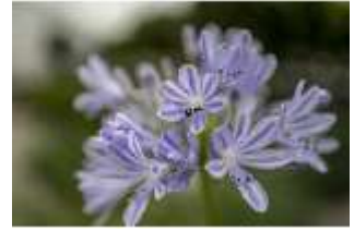
Lin.V, Gärtnerei, Agapanthus praecox, DI016799, BSV-