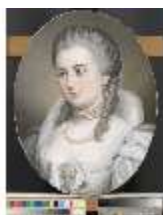
Lin.III,G, Herzogin von Egmont-Pignatelli, Ret., Lin.G0025, DI015487, BSV