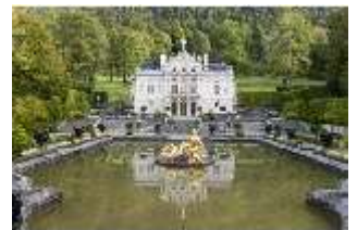
Lin.I, Hauptfassade, großes Bassin, DI005785, BSV