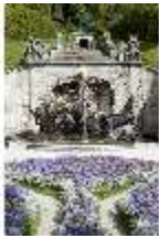
Lin.V, Nordhang mit Kaskade, Neptunbrunnen, DI005732, BSV