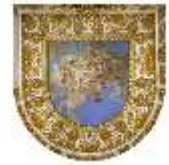
Lin.II, Deckengemälde mit Amoretten, Blaues Kabinett, DI014118, BSV