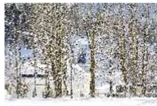
Lin.V, Blick durch Bäume auf das Hauptschloss verschneit im Winter, DI007354, BSV-