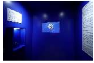
Lin.VII, Dauerausstellung im Königshäuschen, DI027016, BSV-