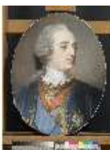
Lin.III,G, König Ludwig XV., DI020770, BSV-