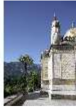
Lin.I, Maurischer Kiosk, DI005503, BSV