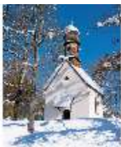
Lin.V, St.-Anna-Kapelle im Winter, DE002925, BSV-