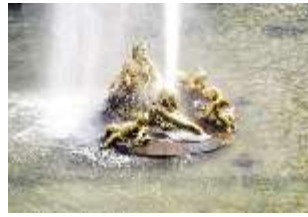
Lin.V, Wasserparterre, Springbrunnengruppe "Flora und Putten", DI006090, BSV