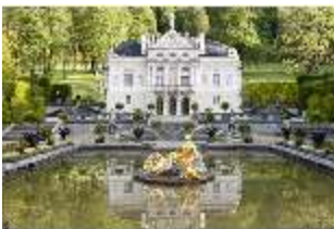
Lin.I, Hauptfassade, großes Bassin, DI005786, BSV