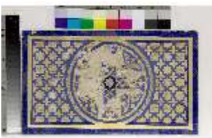
Lin.II, Maurischer Kiosk, Thronnische (Detail), DI021390, BSV-