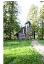
Lin.I, Einsiedelei des Gurnemannz, DI009116, BSV-