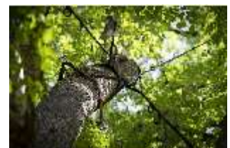
Lin.V, Königslinde, Blick in den Baum, DI016771, BSV-