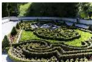
Lin.V, Terrassengärten, Teppichparterre, DI016739, BSV-