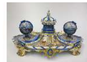
Lin.III,K, Schreibzeug, Porzellan, R. 12, Inv. Nr. Lin.K0119, DI029660, BSV