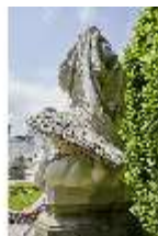
Lin.V, Gartenfigur Vier Elemente - Luft, Lin.Gf0004, DI023269, BSV-