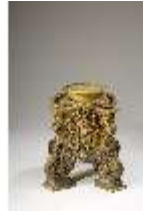
Lin.III,V, Cloisonné-Vase, Sockel, DI019008, BSV-