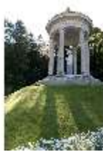
Lin.V, Terrassengärten, Venustempel, DI005686, BSV