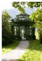
Lin.V, Musikpavillon, DI005717, BSV