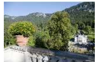
Lin.I, Hauptfassade, von Süden oberhalb der Terrassengärten, DI005758, RSV