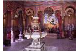
Lin.II, Maurischer Kiosk, DI000371, BSV