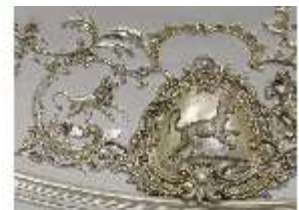
Lin.II, versilberter Deckenstück, Detail (R. 4), DI002007, BSV