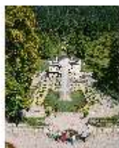
Lin.I, Südfassade und Parterre, DI008096, BSV-