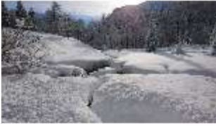
Lin.V, Garten mit Schnee im Winter, DI013257, BSV-