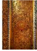
Lin.II, Marokkanisches Haus, Salon, Decke mit Ornamenten, DI008935, BSV-