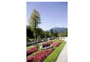
Lin.V, Terrassenanlagen, 2. Terrasse, DI006078, BSV