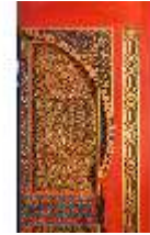
Lin.II, Marokkanisches Haus, Türe vom "Hof" zum Speisezimmer, DI008938, BSV-