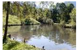
Lin.V, Schwanenweiher, DI005736, BSV