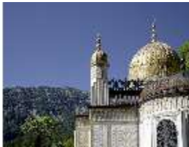
Lin.I, Maurischer Kiosk, DI005509, BSV