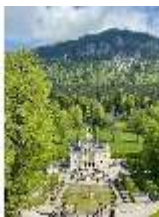
Lin.V, Nordhang, restaurierte Kaskade (2023), DI026553, BSV