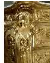
Lin.III,M, Kommode, Pössenbacher, DI015635, BSV-