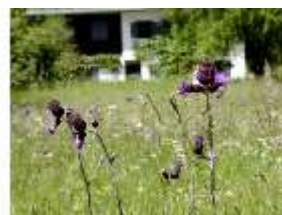
Lin.V, Blumendetail vor Königshäuschen, DI005574, BSV