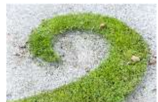
Lin.V, Wasserparterre, Rasenteppich (Detail), DI005957, BSV