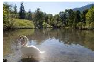
Lin.V, Schwanenweiher, DI005740, BSV