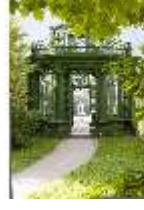
Lin.V, Musikpavillon, DI005722, BSV