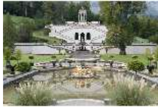
Lin.V, Wasserparterre, Terrassengärten mit Venustempel, DI005962, BSV