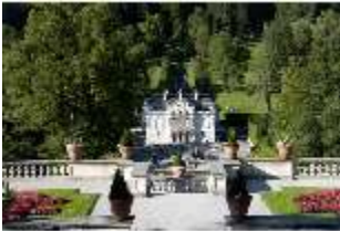
Lin.I, Hauptfassade, von S auf Höhe d. oberen Terrassengärten, DI005770, RSV