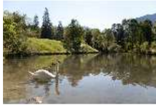
Lin.V, Schwanenweiher, DI005746, BSV