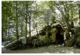
Lin.V, Grotte, DI005556, BSV