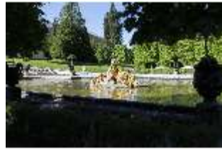
Lin.V, Wasserparterre, "Flora und Putten", DI016718, BSV-