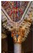
Lin.II, Marokkanisches Haus, marmorierte Säule im "Hof" (Detail), DI008944, BSV-