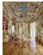
Lin.II, Speisezimmer, R. 9, "Tischlein-deck-dich", DI015939, BSV