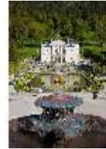
Lin.V, Blick v. Najadenbrunnen (Terrassengarten) z. Schloss, DI009142, BSV-