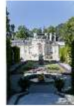
Lin.I, Ostfassade und östliches Parterre, DI005853, BSV