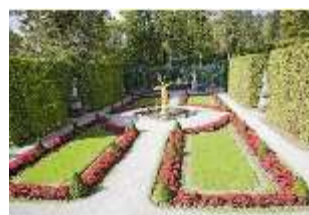
Lin.V, Westl. Parterre, Brunnenfigur der "Fama", DI006115, BSV