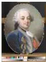
Lin.III,G, Étienne-François Duc de Choiseul-Stainville, DI019926, BSV