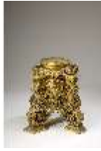
Lin.III,V, Cloisonné-Vase, Sockel, DI019016, BSV-