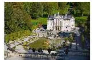
Lin.V, Schloss mit Wasserparterre, DI009138, BSV-