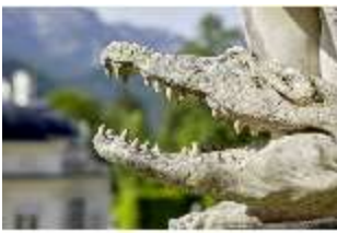
Lin.V,P, Gartenfigur: Vier Erdteile - Amerika (Detail: Krokodil), DI023213, BSV