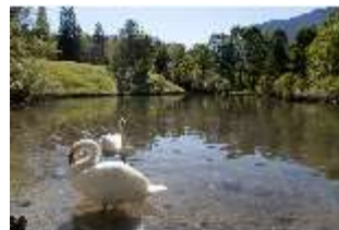
Lin.V, Schwanenweiher, DI005739, BSV