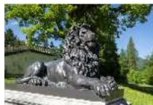
Lin.V, Terrassengärten, Löwe, DI016728, BSV-