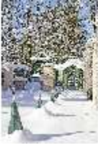
Lin.V, Westliches Gartenparterre verschneit im Winter, DI007324, BSV-