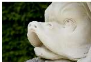
Lin.V,P, Gartenfigur: Vier Elemente - Wasser (Detail: Delfin), DI023232, BSV