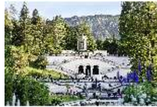
Lin.VI, Ludwignacht 2015, DI008617, BSV-