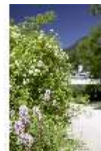
Lin.V, Blumendetail, DI005548, BSV