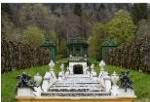
Lin.V, Restaurierte Kaskade (2023), Nordhang, DI028282, BSV-