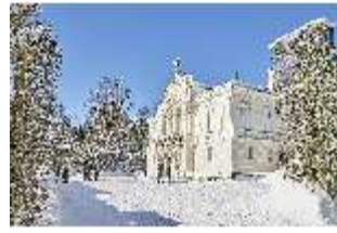
Lin.I, Hauptfassade verschneit im Winter, DI007342, BSV-