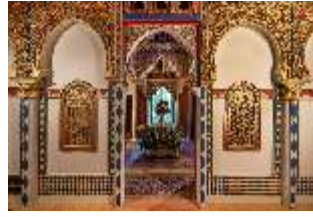
Lin.II, Marokkanisches Haus, Salon, Blick zum Hof, DI008934, BSV-