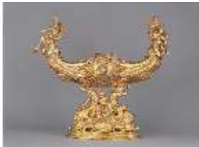
Lin.III,P, Besteckbehälter (Nef), R. 9, DE001279, BSV-