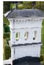
Lin.I, Schornstein mit Fliegenplage, DI009114, BSV-