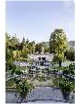
Lin.VI, Ludwignacht 2015, DI008614, BSV-