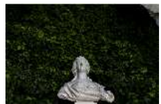
Lin.V, Terrassengärten, Marie Antoinette, DI016741, BSV-