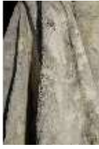
Lin.V,P, Frühling, Lin.Gf0022, DI017618, BSV