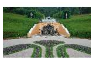
Lin.V, Neptun-Brunnen, restaurierte Kaskade (2023), Nordhang, DI028280, BSV-