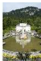
Lin.I, Hauptfassade, großes Bassin, DI005792, BSV