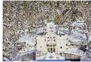
Lin.V, Blick auf die Hauptfassade verschneit im Winter, DI007338, BSV-