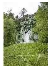
Lin.VI, Ludwignacht 2015, DI008630, BSV-