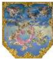
Lin.II, Deckengemälde: "Geburt der Venus", Spiegelsaal, DI014120, BSV