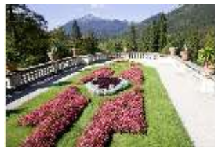
Lin.V, Terrassenanlagen, 2. Terrasse, DI006077, BSV