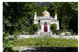
Lin.I, Maurischer Kiosk, Ansicht der Hauptfassade, DI005839, BSV