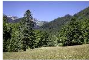
Lin.V, Wiese, DI005532, BSV