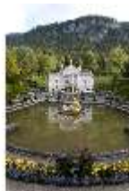
Lin.I, Hauptfassade, großes Bassin, DI005783, BSV