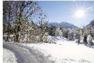
Lin.V, Schlosspark verschneit im Winter, DI007318, BSV-