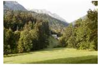
Lin.V, Landschaftlicher Garten, DI005966, BSV