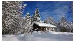
Lin.V, Königshäuschen mit Schnee im Winter, DI013259, BSV-