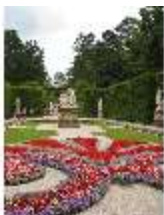
Lin.V, Östl. Parterre, Teppichparterre, DI006130, BSV