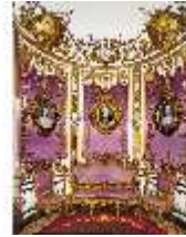
Lin.II, Lila Kabinett, R. 6, DE001264, BSV-