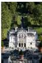
Lin.I, Hauptfassade, von Süden von d. oberen Terrassengärten, DI005757, RSV