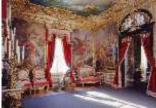
Lin.II, Östliches Gobelinzimmer, R. 11, DE003327, BSV-