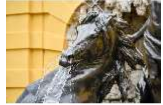
Lin.V, Pferd, Neptun-Brunnen, Nordhang, DI028302, BSV-