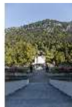
Lin.I, Hauptfassade, von Süden, von den Terrassengärten, DI005756, RSV