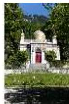
Lin.I, Maurischer Kiosk, Ansicht der Hauptfassade, DI005837, BSV