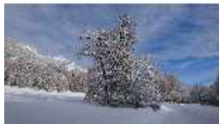
Lin.V, Garten mit Schnee im Winter, DI013268, BSV-