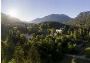
Lin.I, Vogelperspektive, DI016667, BSV-