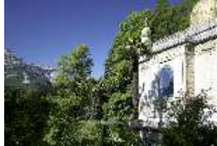
Lin.I, Maurischer Kiosk, Berge, DI005525, BSV