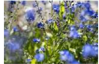
Lin.V, Wasserparterre, Blumenrabatten (Detail), DI016724, BSV-