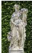
Lin.V, Gartenfigur Vier Elemente - Erde, Lin.Gf0006, DI023280, BSV-