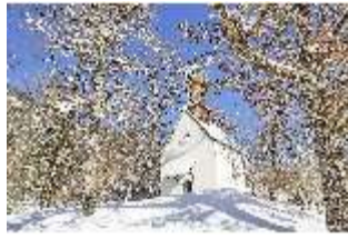
Lin.I, Barocke St.-Anna Kapelle verschneit im Winter, DI007343, BSV-