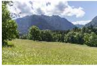
Lin.V, Landschaftlicher Garten, DI016781, BSV-