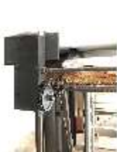
Lin.II, Technik, Tischlein deck dich, DI015998, BSV-