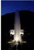
Lin.VI, Ludwignacht 2015, DI008639, BSV-