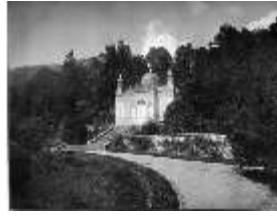
Lin.I, Maurischer Kiosk, DE001190, BSV-