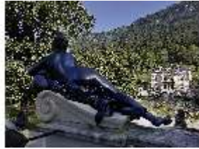
Lin.V, Najadenbrunnen - östliche Nympe (Zinkguß), DI027065, BSV-