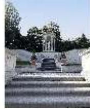
Lin.V, Terrassengärten, Venustempel, DI027070, BSV-