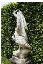
Lin.V, Gartenfigur Vier Elemente - Luft, Lin.Gf0004, DI023268, BSV-