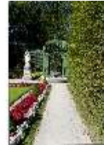
Lin.V, Westl. Parterre, Treillage-Architektur, DI005912, BSV