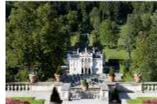
Lin.I, Hauptfassade, von S, von den oberen Terrassengärten, DI005768, RSV