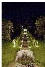
Lin.VI, Ludwignacht 2015, DI008652, BSV-