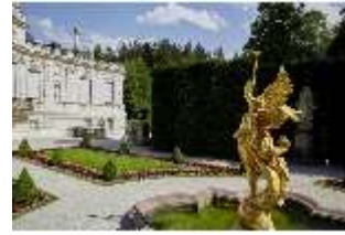
Lin.V, westliches Gartenparterre, Brunnenfigur "Fama", DI023239, BSV