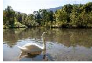
Lin.V, Schwanenweiher, DI005747, BSV