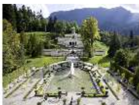
Lin.V, Parterre, Fontäne, Terrassengärten und Venustempel, DI006087, BSV