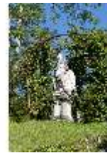
Lin.V, Nordhang, allegor. Steinfigur eines Kontinentes, DI005911, BSV