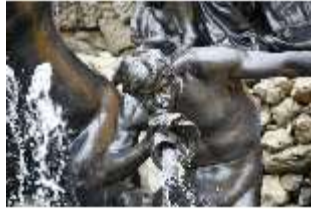
Lin.V, Fischschwänziger Tritone, Neptun-Brunnen, Nordhang, DI028303, BSV-