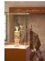
Lin.VII, Ausstellung im Königshäuschen, DI021098, BSV-