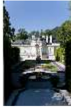
Lin.I, Ostfassade und östliches Parterre, DI005855, BSV