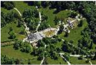
Lin. I, Luftaufnahme Schloss u. Schlosspark v. NW, DI024447, BSV