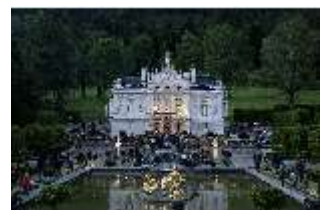
Lin.VI, Ludwignacht 2015, DI008634, BSV-