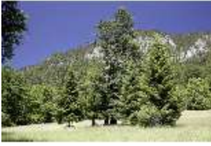
Lin.V, Bäume und Berge, DI005554, BSV