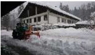
Lin.V, Königshäuschen mit Schnee im Winter, DI013287, BSV-