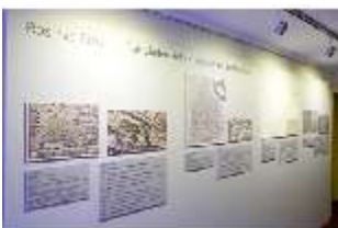
Lin.VII, Ausstellung im Königshäuschen, DI021095, BSV-