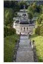
Lin.I,Nordfassade, Kaskade d.Nordhanges bis Terrassengärten, DI005877, RSV