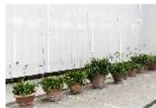
Lin.V, Gärtnerei, DI016803, BSV-