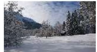
Lin.V, Königshäuschen mit Schnee im Winter, DI013285, BSV-