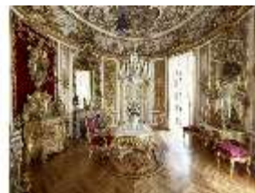
Lin.II, Speisezimmer, R. 9, "Tischlein-deck-dich", DI015941