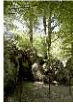
Lin.V, Grotte, DI005557, BSV