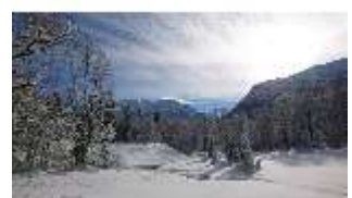
Lin.V, Garten mit Schnee im Winter, DI013256, BSV-