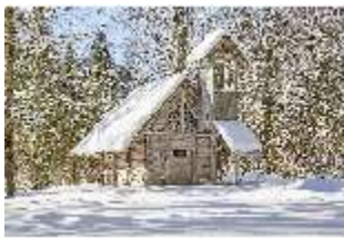
Lin.I, Einsiedelei des Gurnemannz verschneit im Winter, DI007335, BSV-