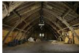
Lin.II, Tenne, DI021093, BSV-