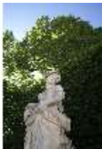
Lin.V, Östliches Parterre, Allegorie des Wassers, DI016694, BSV-