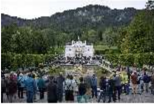
Lin.VI, Ludwignacht 2015, DI008635, BSV-