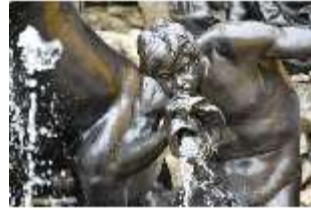
Lin.V, Fischschwänziger Tritone, Neptun-Brunnen, Nordhang, DI028304, BSV-