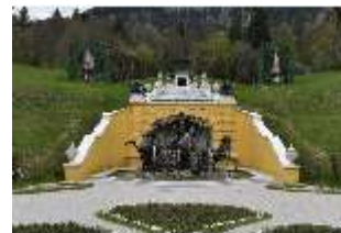
Lin.V, Neptun-Brunnen, restaurierte Kaskade (2023), Nordhang, DI028313, BSV-