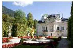
Lin.I, Westfassade, DI009147, BSV-