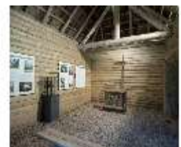
Lin.II, Einsiedlerhütte des Gurnemannz, DI000372, BSV