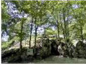
Lin.V, Grotte, DI005568, BSV