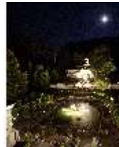
Lin.VI, Ludwignacht 2015, DI008645, BSV-