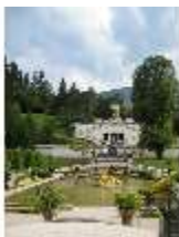
Lin.V, Wasserparterre, Terrassengärten mit Venustempel, DI006126, BSV