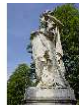
Lin.V, Gartenfigur Vier Erdteile - Asia, Lin.Gf0011, DI023309, BSV-