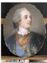
Lin.III,G, Pastell, König Ludwig XV., Lin.G0030, DI019924, BSV