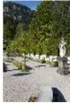
Lin.V, Wasserparterre, von Bäumen eingegrenzter Weg, DI005936, BSV