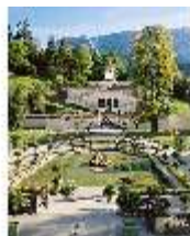
Lin.I, Südfassade und Parterre, DI008092, BSV-