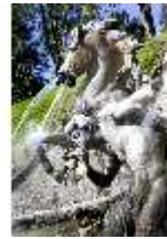
Lin.V, Nordhang mit Kaskade, Neptunbrunnen (Detail), DI006096, BSV