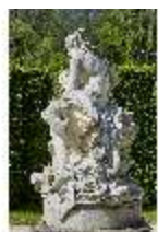
Lin.V, Figurengruppe Venus und Adonis, Lin.Gf0007, DI023286, BSV-