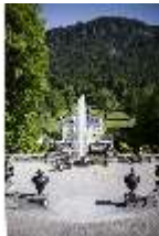
Lin.V, Blick von den Terrassengärten, DI016743, BSV-