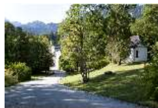
Lin.V, St.-Anna-Kapelle, DI005931, BSV