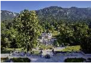
Lin.V, Hauptfassade u. Wasserparterre v. d. Terrassengärten aus, DI027055 BSV.