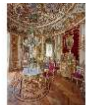
Lin.II, Speisezimmer, R. 9, "Tischlein-deck-dich", DI015942, BSV