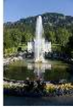
Lin. I, Hauptfassadegroßes Bassin, DI005808, BSV