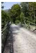
Lin.V, Historische Brücke, DI000378, BSV