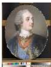
Lin.III,G, Pastell, König Ludwig XV., Lin.G0030, DI019923, BSV