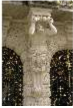
Lin.I, Balkontragende Herme an der Hauptfassade, DI011887, BSV-