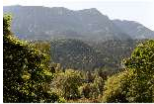
Lin.V, Landschaftlicher Garten, DI005923, BSV