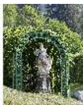
Lin.V, Gartenfigur Vier Erdteile - Europa, Lin.Gf0010, DI023303, BSV-