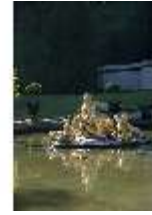
Lin.V, Wasserparterre, Blick auf die Springbrunnengruppe "Flora und Putten", DI005900, BSV