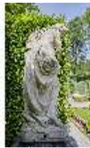
Lin.V, Gartenfigur Vier Jahreszeiten - Winter, Lin.Gf0019, DI023317, BSV-