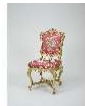
Lin.III,M, Stuhl, Lin.M0057, DI024877, BSV-