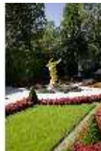
Lin.V, Westliches Parterre, Brunnenfigur der "Fama", DI006110, BSV