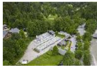
Lin.V, Gärtnerei, Vogelperspektive, DI016647, BSV-