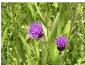
Lin.V, Blumendetail, DI005575, BSV