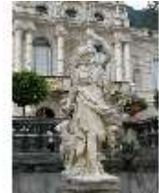
Lin.V, Wasserparterre, Steinskulptur der "Diana", DI006124, BSV