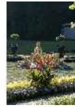
Lin.V, Wasserparterre, Springbrunnengruppe "Flora/Putten", DI005907, BSV