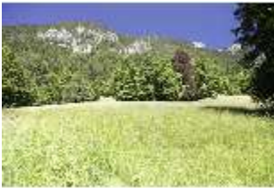
Lin.V, Wiese, DI005540, BSV