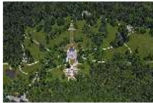
Lin. I, Luftaufnahme Schloss u. Schlosspark v. S, DI024445, BSV