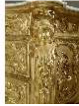
Lin.III,M,Kommode, Pössenbacher, DI015642, BSV-