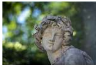
Lin.V, Östliches Parterre, Allegorie des Wassers, DI016700, BSV-