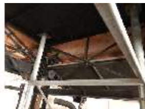
Lin.II, Technik, Tischlein deck dich, DI016000, BSV-