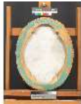
Lin.III,G, Porträt (Pastellgemälde), Jeanne Bécu, DI009056, BSV