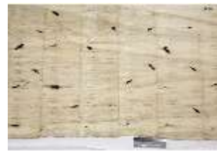
Lin.III,T, Hermelinbehang, DI018764, BSV