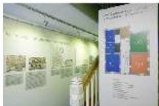
Lin.VII, Ausstellung im Königshäuschen, DI021096, BSV-