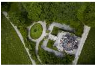
Lin.I, Maurischer Kiosk, DI016666, BSV-