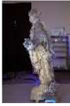
Lin.V,P, Frühling, im UV-Licht, Lin.Gf0022, DI019658, BSV