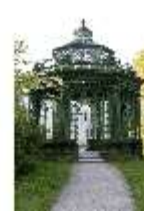
Lin.V, Musikpavillon, DI006102, BSV