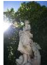
Lin.V, Östliches Parterre, Allegorie des Wassers, DI016693, BSV-