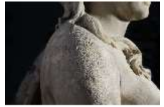
Lin.V,P, Frühling, Lin.Gf0022, DI017600, BSV