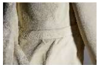
Lin.V,P, Frühling, Lin.Gf0022, DI017616, BSV