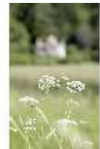
Lin.V, Blumendetail, DI005544, BSV