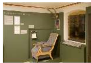
Lin.VII, Ausstellung im Königshäuschen, DI021117, BSV-