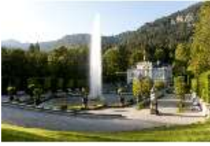
Lin.I, Hauptfassade von S-O, großes Bassin, Fontäne, DI005827, BSV