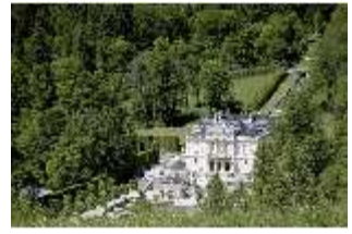
Lin.I, Blick auf das Schloss, DI005563, BSV