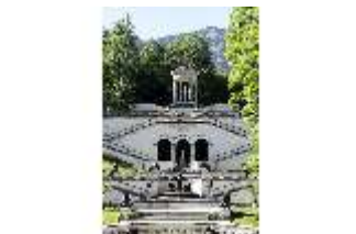
Lin.V, Terrassengärten mit Rundtempel, DI016710, BSV-