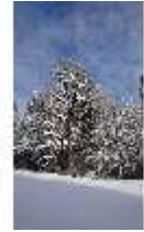
Lin.V, Garten mit Schnee im Winter, DI013275, BSV-