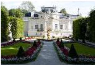
Lin.I, Westfassade, Parterre mit Brunnenfigur "Fama", DI005887, BSV