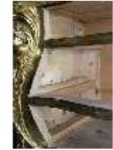
Lin.III,M,Kommode, Pössenbacher, DI015646, BSV-