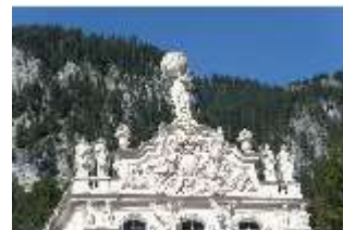
Lin.I, Hauptfassade, von Süden aus, Giebel mit Atlas-Figur, DI005926, BSV