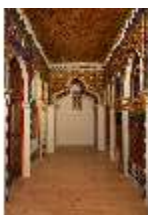
Lin.II, Marokkanisches Haus, Salon, DI008929, BSV-