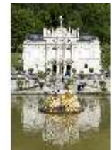
Lin.I, Hauptfassade, großes Bassin, DI005789, BSV