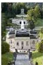
Lin.I,Nordfassade, Kaskade d.Nordhanges bis Terrassengärten, DI005882, RSV