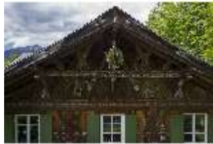
Lin.V, Gärtnerei, Detail Dachgiebel, DI016643, BSV-