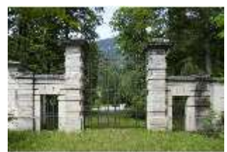
Lin.V, Historisches Tor, DI000376, BSV