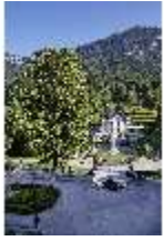
Lin.V, Hauptfassade u. Wasserparterre v. d. Terrassengärten aus, DI027051 BSV.