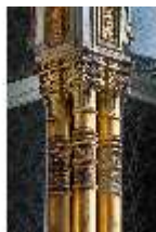
Lin.I, Maurischer Kiosk, S-W Fassade, Schmuckpfeiler, DI008888, BSV