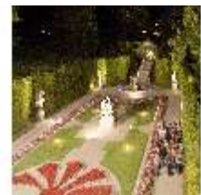
Lin.VI, Ludwignacht 2015, DI008654, BSV-