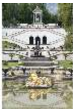
Lin.V, Springbrunnengruppe "Flora/Putten", Terrassengärten, DI003545, BSV