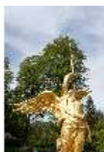
Lin.V, Westl. Parterre, Brunnenfigur der "Fama", DI005973, BSV