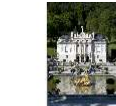
Lin.I, Hauptfassade von S, Wasserparterre mit großem Bassin, DI005766, BSV