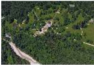
Lin. I, Luftaufnahme Schloss u. Schlosspark v. SO, DI024444, BSV