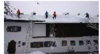
Lin.V, Königshäuschen mit Schnee im Winter, DI013286, BSV-