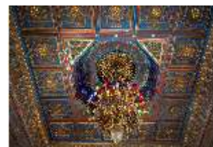
Lin.II, Maurischer Kiosk, Kassettendecke mit Glaslüster, DI008906, BSV-