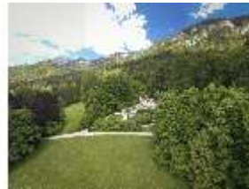
Lin.I, Maurischer Kiosk, DI016660, BSV-