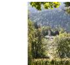
Lin.V, Landschaftlicher Garten, Blick auf den Venustempel, DI005925, BSV