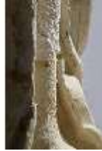
Lin.V,P, Frühling, Lin.Gf0022, DI017603, BSV