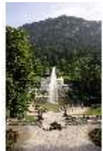
Lin.I, Blick über das Hauptparterre zur Hauptfassade, DI011892, BSV-