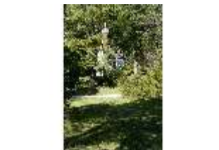
Lin.V, St.-Anna-Kapelle, DI005929, BSV