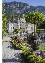
Lin.V, Hauptfassade mit Wasserparterre und Flora-Brunnen, DI027041, BSV-