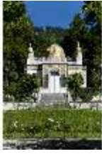
Lin.I, Maurischer Kiosk, Ansicht der Hauptfassade, DI005840, BSV