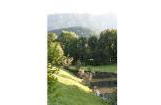
Lin.V, Schwanenweiher, DI005752, BSV