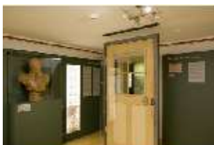
Lin.VII, Ausstellung im Königshäuschen, DI021119, BSV-