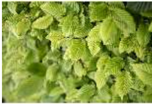
Lin.V, Hainbuchenhecke (Detail), DI016691, BSV-