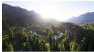
Lin.I, Vogelperspektive, DI016668, BSV-