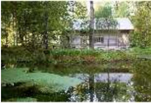
Lin.V, See vor der Hundinghütte, DI009118, BSV-