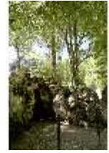
Lin.V, Grotte, DI005558, BSV