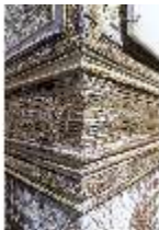
Lin.V, Maurischer Kiosk, Fassade (Detail), DI016784, BSV-