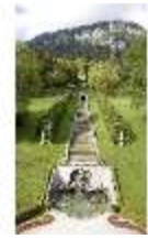
Lin.V, Nordhang mit Kaskade, Neptunbrunnen, DI006089, BSV