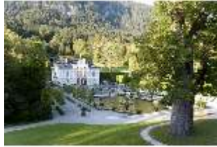
Lin.I, Hauptfassade von S-W, von der unteren Terrasse, Linde, DI005773, BSV