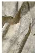
Lin.V,P, Frühling, Lin.Gf0022, DI017615, BSV