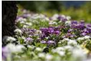
Lin.V, Maurischer Kiosk, Bepflanzung, DI016786, BSV-