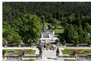
Lin.V, Terrassengärten, Blick auf das Schloss, DI016757, BSV-