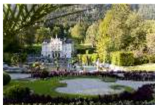
Lin.I, Hauptfassade von S, Wasserparterre, Blumenrabatte, DI005831, RSV