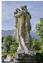
Lin.V, Gartenfigur Vier Erdteile - Afrika, Lin.Gf0008, DI023298, BSV-