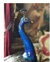
Lin.II, Blaues Kabinett, Pfau, Detail, DI015994, BSV-