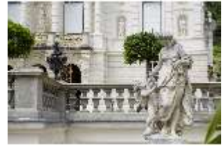
Lin.V,P, Gartenfigur: Die vier Tagzeiten - Mittag - Venus, DI023222, BSV