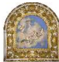
Lin.II, Deckengemälde: "Spielende Amoretten", Rosa Kabinett (R. 8), DI014117, BSV