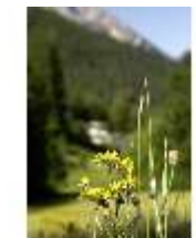
Lin.V, Blumendetail, DI005527, BSV