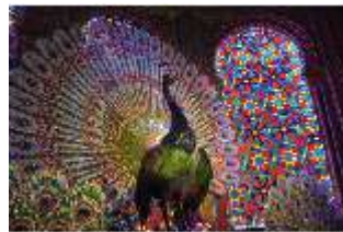
Lin.II, Maurischer Kiosk, Pfauenthron (Detail), DI004559, BSV-