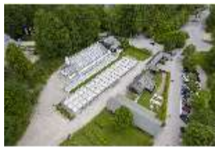
Lin.V, Gärtnerei, Vogelperspektive, DI016646, BSV-