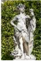
Lin.V, Westl. Parterre, Steinskulptur "Allegorie des Herbstes", DI005972, BSV