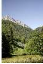
Lin.V, Berge, DI005528, BSV