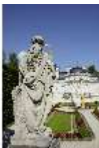
Lin.V,P, Vier Jahreszeiten - Sommer, Westparterre, DI023246, BSV