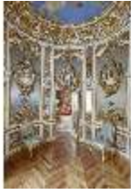
Lin.II, Blaues Kabinett, R. 10, DI015943, BSV