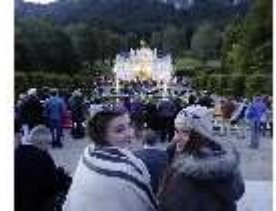
Lin.VI, Ludwignacht 2015, DI008622, BSV-