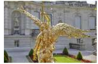
Lin.V, Brunnenfigur "Fama", westl. Gartenparterre, DI023244, BSV