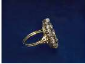
Lin.III,V, Ring, Inv.-Nr.: Lin.V0038, DI025124, BSV