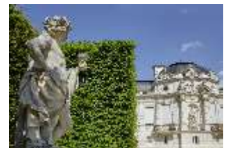
Lin.V, Westfassade und Kalksteinfigur: Vier Jahreszeiten - Herbst, DI023235, BSV