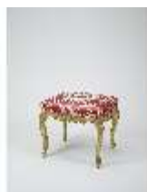
Lin.III,M, Tabouret, Lin.M0082, DI024879, BSV-