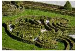
Lin.V, Terrassengärten, Teppichparterre (Detail), DI016766, BSV-