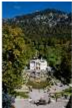
Lin.V, Blick vom Terrassengarten Richtung Schloss, DI009144, BSV-