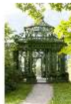
Lin.V, Musikpavillon, DI005718, BSV