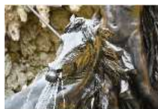
Lin.V, Pferd, Neptun-Brunnen, Nordhang, DI028305, BSV-