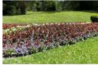
Lin.V, Blumenrabatten, DI016819, BSV-