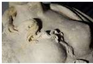
Lin.V,P, Frühling, Lin.Gf0022, DI017610, BSV