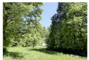
Lin.V, Schlosspark, DI005577, BSV