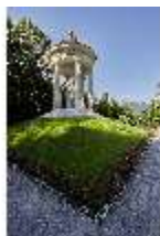
Lin.V, Terrassengärten, Venustempel/Rundtempel, DI027072, BSV-