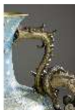
Lin.III,V, Cloisonné-Vase, DI019012, BSV-