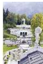
Lin.V, Terrassengärten, Venustempel, Atlas-Figur, DI006084, BSV