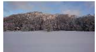
Lin.V, Garten mit Schnee im Winter, DI013254, BSV-