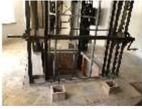
Lin.II, Technik, Tischlein deck dich, DI016002, BSV-