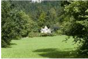
Lin.I, Maurischer Kiosk, Schrägansicht der Hauptfassade, DI005847, BSV