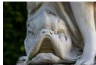
Lin.V, Östliches Parterre, Allegorie des Wassers, DI016701, BSV-