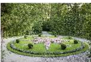
Lin.VI, Ludwignacht 2015, DI008631, BSV-