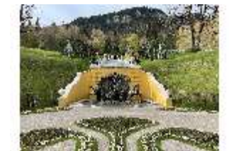
Lin.V, Neptun-Brunnen, restaurierte Kaskade (2023), Nordhang, DI028281, BSV-