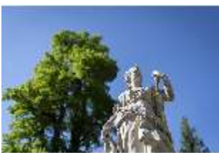
Lin.V, Allegorie der Winter, DI016726, BSV-