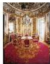
Lin.II, Speisezimmer, R.9 (Hochformat), DE001355, BSV-