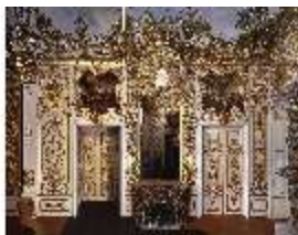
Lin.II, Schlafzimmer, R.7, Wandabwicklung, DI014638, BSV-