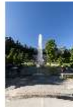
Lin.V, Wasserparterre, DI016678, BSV-