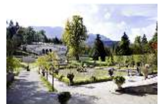
Lin.V, Wasserparterre, großes Bassin, 300-jährigen Linde, DI006105, BSV