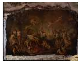
Lin.II, Venusgrotte, Gemälde v. A.Heckel, LinGr.G0001, DE003641, BSV-