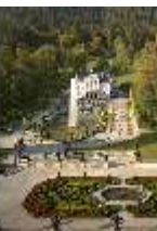
Lin.V, Blick Richtung Schloss mit Wasserparterre, DI009136, BSV-