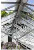
Lin.V, Gärtnerei, DI016812, BSV-