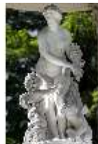
Lin.V, Rundtempel, Venus-Statue, DI016761, BSV-