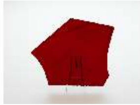
Lin.III,V, Glasscheibe, Relikt aus der Grotte in Linderhof, DI027498, BSV-