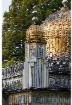
Lin.I, Maurischer Kiosk, Ecktürmchen, DI008892, BSV-