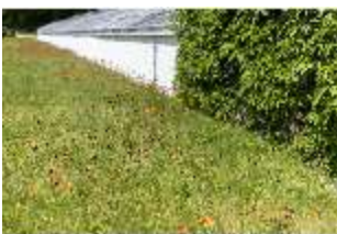
Lin.V, Wiese hinter der Gärtnerei, DI016814, BSV-