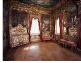
Lin.II, Westl. Gobelinzimmer, R.3 (Querformat), DE003328, BSV-