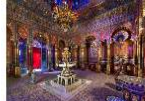
Lin.II, Maurischer Kiosk, Hauptraum, DI008904, BSV-