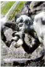
Lin.V, Nordhang mit Kaskade, Neptunbrunnen (Detail), DI006097, BSV