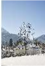
Lin.V, Blick über das Schloss auf die Berge verschneit im Winter, DI007350, BSV-