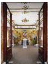
Lin.II, Treppenhaus, R.2, Vorraum, DE001267, BSV-