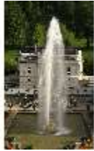
Lin.V, Flora-Brunnen mit Fontäne, DI011893, BSV-