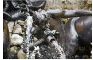
Lin.V, Fischschwänziger Tritone, Neptun-Brunnen, Nordhang, DI028300, BSV-