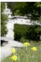
Lin.V, Blumendetail, DI005546, BSV