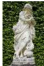
Lin.V, Gartenfigur Vier Jahreszeiten - Winter, Lin.Gf0019, DI023314, BSV-