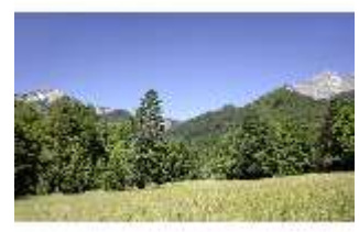
Lin.V, Wiese, DI005533, BSV