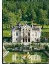
Lin.I, Südseite m. Wasserparterre, DE000833, BSV-