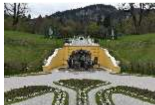
Lin.V, Neptun-Brunnen, restaurierte Kaskade (2023), Nordhang, DI028312, BSV-