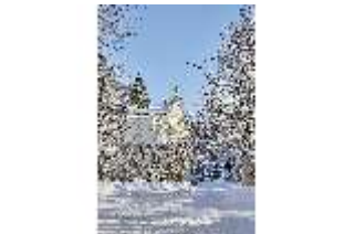
Lin.V, Seitenblick auf das Schloss, verschneiter Park, DI007321, BSV-