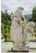
Lin.V,P, Gartenfigur: Die vier Tagzeiten - Mittag - Venus, DI023220, BSV