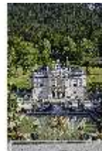
Lin.V, Hauptfassade und Wasserparterre mit Flora-Brunnen, DI027061, BSV-