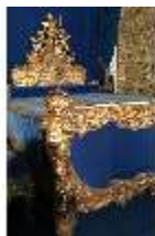
Lin.III, Prunkbett, R. 7, Lin.M0093, DI019607, BSV