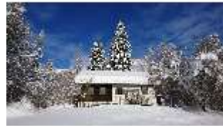
Lin.V, Königshäuschen mit Schnee im Winter, DI013261, BSV-