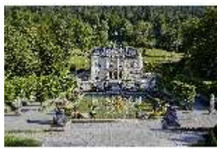
Lin.V, Hauptfassade und Wasserparterre mit Flora-Brunnen, DI027060, BSV-