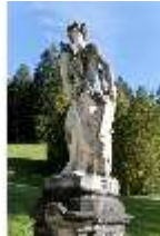
Lin.V, Wasserparterre, Steinskulptur "Allegorie der Nacht", DI005953, BSV