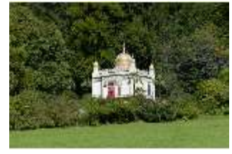
Lin.I, Maurischer Kiosk, Schrägansicht der Hauptfassade, DI005846, BSV