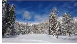
Lin.V, Garten mit Schnee im Winter, DI013262, BSV-