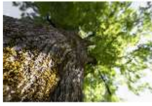
Lin.V, Königslinde, Blick in den Baum, DI016773, BSV-