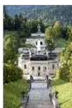
Lin.I,Nordfassade, Kaskade des Nordhanges bis Terrassengärten, DI005881, RSV