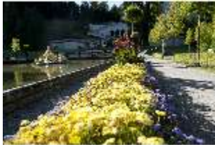
Lin.V, Wasserparterre, Blumenrabatte am großen Bassin, DI005898, BSV