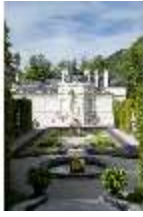
Lin.I, Ostfassade und östliches Parterre, DI005861, BSV