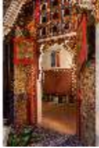
Lin.II, Marokkanisches Haus, Türe vom "Hof" zum Speisezimmer, DI008936, BSV-