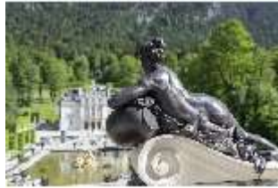
Lin.V, Terrassengärten, Nympe auf der Balstrade, DI016737, BSV-