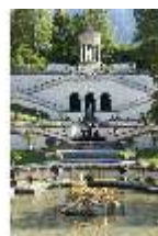
Lin.V, Wasserparterre, Terrassengärten und Venustempel, DI005955, BSV