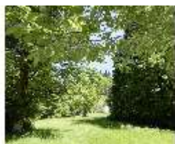
Lin.V, Schlosspark, DI005578, BSV