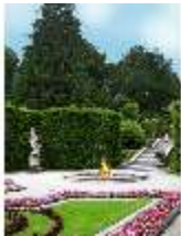
Lin.V, Östl. Parterre, Springbrunnengruppe "Amor mit Putten", DI006134, BSV