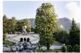
Lin.VI, Ludwignacht 2015, DI008618, BSV-