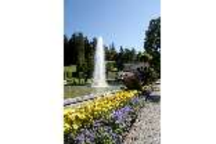
Lin.V, Wasserparterre, Blumenrabatte am großen Bassin, DI005651, BSV