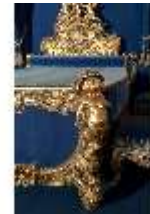
Lin.III, Prunkbett, R. 7, Lin.M0093, DI019606, BSV