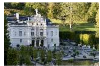
Lin.I, Hauptfassade, von Süd-Westen aus, DI005777, BSV