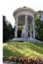
Lin.V, Terrassengärten, Venustempel, DI005904, BSV