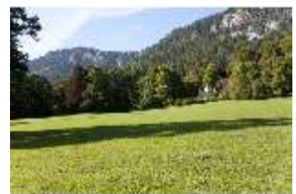
Lin.V, Landschaftlicher Garten mit Blick auf den Maurischen Kiosk, DI005932, BSV