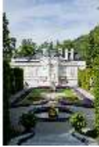
Lin.I, Ostfassade und östliches Parterre, DI005858, BSV