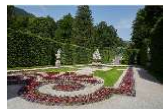
Lin.V, Östliches Parterre, DI023228, BSV