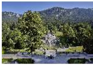
Lin.V, Hauptfassade u. Wasserparterre v. d. Terrassengärten aus, DI027056 BSV.