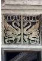
Lin. I, Hundinghütte, Fenster, DI000374, BSV