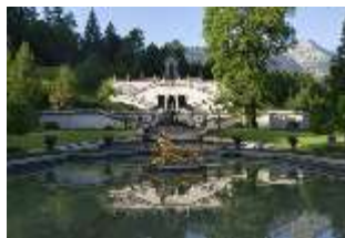
Lin.V, Wasserparterre, Terrassengärten mit Venustempel, DI014811, BSV