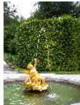
Lin.V, Östl. Parterre, Springbrunnengruppe "Amor mit Putten", DI006135, BSV