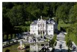
Lin.I, Hauptfassade von S-O, Bassin/Springbrunnengruppe, DI005760, BSV