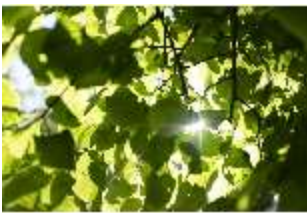
Lin.V, Blick in die Königslinde, DI016716, BSV-