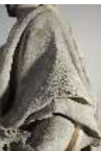
Lin.V,P, Frühling, Lin.Gf0022, DI017613, BSV