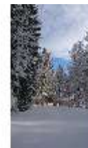
Lin.V, Verbotenes Tor mit Schnee im Winter, DI013277, BSV-