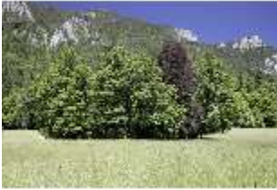
Lin.V, Blick auf Berge, DI005551, BSV