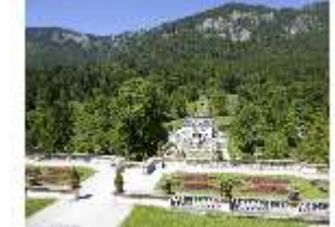
Lin.V, Blick auf das Schloss, DI005569, BSV