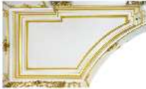
Lin.II, Decke, DI014111, BSV