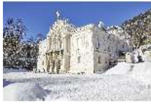
Lin.I, Hauptfassade verschneit im Winter, DI007348, BSV-