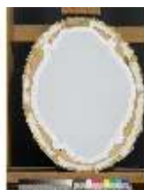
Lin.III,G, König Ludwig XV. (Rückseite), DI020769, BSV-