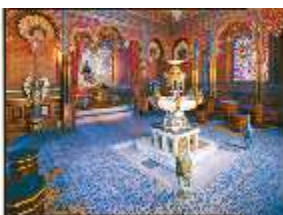
Lin.II, Maurischer Kiosk, Hauptraum, DE004153, BSV