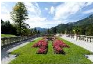
Lin.V, Terrassengärten, 2. Terrasse, DI005667, BSV