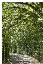
Lin.V, Nordhang mit Kaskade, Laubengang, DI005650, BSV