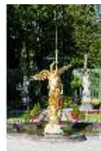
Lin.V, Westliches Parterre, Brunnenfigur der "Fama", DI005910, BSV