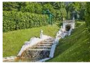
Lin.V, Nordhang mit Wasserkaskade u. Musikpavillon, DI023224, BSV