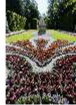
Lin.V, Östliches Parterre, DI016688, BSV-