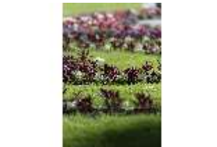
Lin.V, Östliches Parterre, Blumenrabatten, DI016703, BSV-