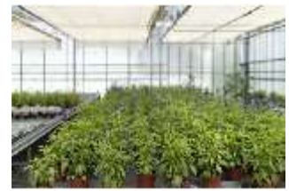
Lin.V, Gärtnerei, DI016796, BSV-