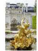
Lin.V, Östl. Parterre, Brunnenfigur "Amor mit Tauben", DI023230, BSV