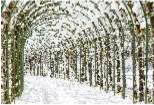
Lin.V, Laubengang verschneit im Winter, DI007353, BSV-