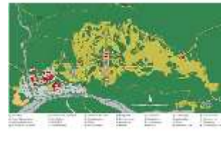
Lin.IV, Park, Gartenplan, DI014153, BSV