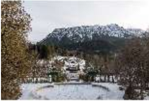
Lin.V, Schlosspark mit Schloss im Winter, DI025160, BSV-