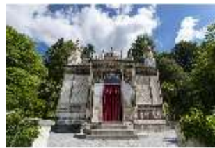
Lin.I, Maurischer Kiosk, DI016778, BSV-