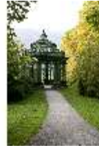
Lin.V, Musikpavillon, DI006101, BSV