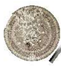
Lin.III,M, Muscheltischplatte, Inv.-Nr. LinGr.M0003, DI014822, BSV-