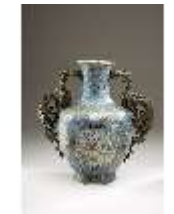
Lin.III,V, Cloisonné-Vase, DI019017, BSV-