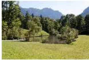
Lin.V, Schwanenweiher, DI005750, BSV