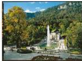
Lin.I, Schlossanlage, DE001349, BSV-