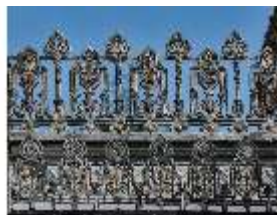
Lin.I, Maurischer Kiosk, Zinnenkränze um die Tambourkuppel, DI008893, BSV