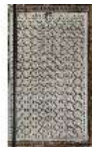
Lin.I, Maurischer Kiosk, Wandfeld mit orient. Ornamenten, DI008896, BSV