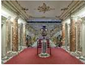
Lin.II, Vorraum zum Treppenhaus, DI013232, BSV-