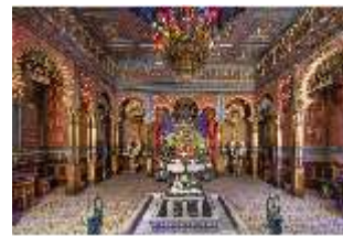
Lin.II, Maurischer Kiosk, Hauptraum, DI008900, BSV-