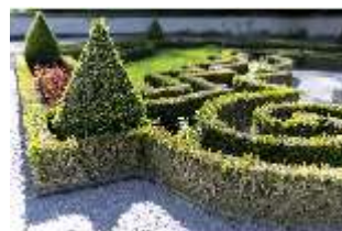
Lin.V, Terrassengärten, Teppichparterre (Detail), DI016734, BSV-