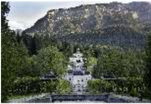
Lin.VI, Ludwignacht 2015, DI008615, BSV-