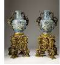
Lin.III,V, Cloisonné-Vasen, Sockel, DI019006, BSV-