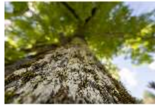
Lin.V, Königslinde, Blick in den Baum, DI016774, BSV-