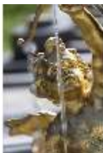
Lin.V, "Pfeilschießender Amor mit Tauben", DI016707, BSV-