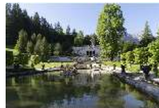
Lin.V, Wasserparterre mit Springbrunnengruppe und Terrassengärten, DI016680, RSV-