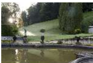
Lin.V, Wasserparterre, großes Bassin, landschaftlicher Garten, DI005964, BSV