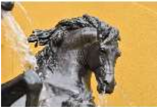
Lin.V, Pferdekopf, Neptun-Brunnen, Nordhang, DI028292, BSV-