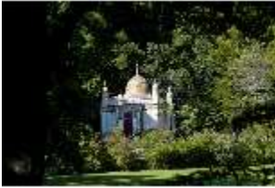
Lin.I, Maurischer Kiosk, Ansicht der Hauptfassade, DI005844, BSV