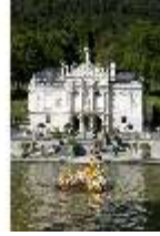
Lin.I, Hauptfassade von Süden, Bassin/Springbrunnengruppe, DI005759, BSV