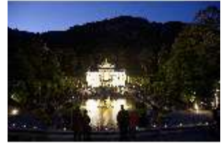
Lin.VI, Ludwignacht 2015, DI008638, BSV-