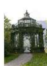
Lin.V, Musikpavillon, DI005719, BSV