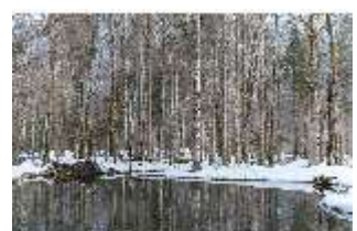
Lin.V, Schlosspark im Winter, DI025162, BSV-