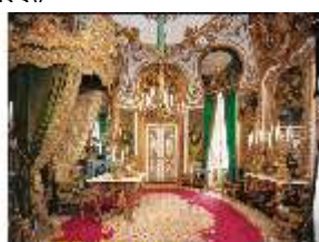
Lin.II, Audienzzimmer, R.5 (Querformat), DE001353, BSV-