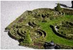
Lin.V, Terrassengärten, Teppichparterre (Detail), DI016765, BSV-