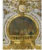
Lin.II, Spiegelsaal, R.12, Ruhebett und Kamine, DI014635, BSV-