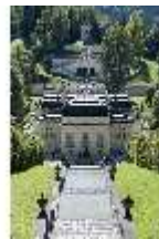
Lin.I,Nordfassade, Kaskade d.Nordhanges bis Terrassengärten, DI005868, RSV