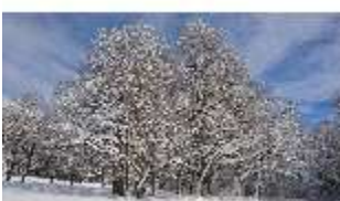
Lin.V, Garten mit Schnee im Winter, DI013271, BSV-