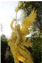
Lin.V, Westliches Parterre, Brunnenfigur der "Fama", DI006108, BSV