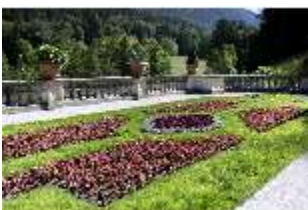
Lin.V, Terrassengärten, Teppichparterre, DI016753, BSV-