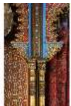
Lin.II, Maurischer Kiosk, Säulenbündel (Detail), DI008917, BSV-