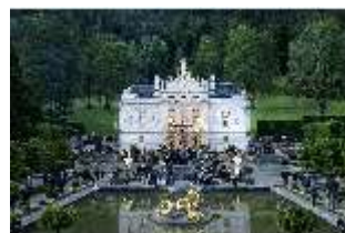
Lin.VI, Ludwignacht 2015, DI008633, BSV-