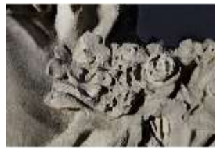
Lin.V,P, Frühling, Lin.Gf0022, DI017611, BSV