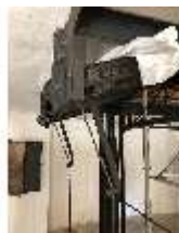
Lin.II, Technik, Tischlein deck dich, DI015999, BSV-