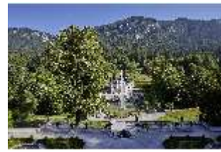
Lin.V, Hauptfassade u. Wasserparterre v. d. Terrassengärten aus, DI027057 BSV.