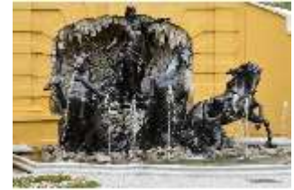
Lin.V, Neptun-Brunnen, restaurierte Kaskade (2023), Nordhang, DI028310, BSV-