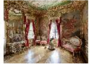
Lin.II, Östliches Gobelinzimmer, R. 11., DI015946, BSV