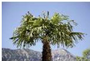
Lin.I, Maurischer Kiosk, Palme, DI005523, BSV