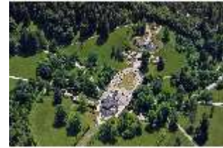
Lin. I, Luftaufnahme Schloss u. Schlosspark v. N, DI024448, BSV