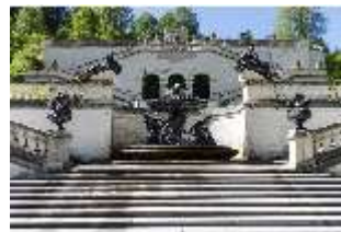
Lin.V, Terrassengärten, Schalenbrunnen mit Najaden, DI016730, BSV-