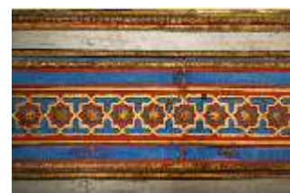
Lin.II, Maurischer Kiosk, orientalisierende Ornamente (Detail), DI008919, BSV-