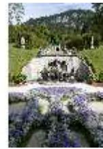
Lin.V, Nordhang mit Kaskade, Neptunbrunnen, DI005731, BSV