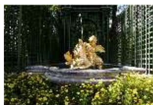
Lin.V, Westl. Parterre, Springbrunnengruppe "Amor mit Delphinen", DI006045, BSV