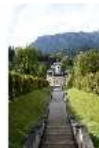
Lin.I,Nordfassade, Kaskade d.Nordhanges bis Terrassengärten, DI005880, RSV