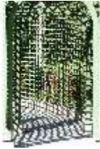
Lin.V, Westliches Parterre, Treillage-Architektur, DI005913, BSV