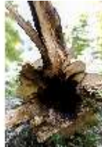
Lin.V, Wald, Baumarbeiten, DI016791, BSV-