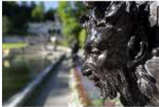
Lin.V, Wasserparterre, Zinkgussvase (Detail), DI016684, BSV-