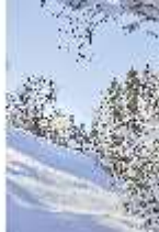
Lin.V, Blick auf den Venustempel verschneit im Winter, DI007346, BSV-