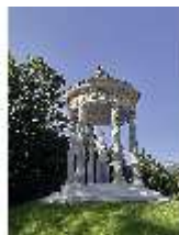
Lin.V, Terrassengärten, Venustempel/Rundtempel, DI027073, BSV-