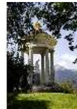
Lin.V, Terrassengärten, Venustempel, DI006107, BSV