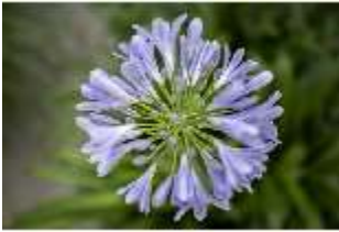
Lin.V, Gärtnerei, Agapanthus praecox, DI016800, BSV-