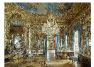
Lin.II, Spiegelsaal, R. 12, DI015948, BSV