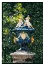
Lin.V, Vase im westlichen Parterre, DE002404, BSV-