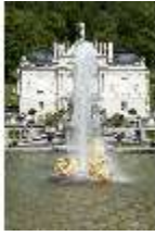
Lin.I, Hauptfassade, großes Bassin, DI005798, BSV