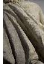
Lin.V,P, Frühling, Lin.Gf0022, DI017620, BSV