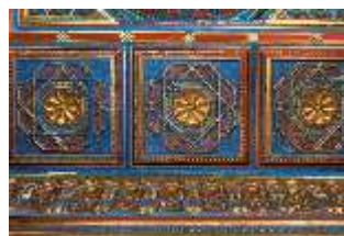
Lin.II, Maurischer Kiosk, Kassettendecke, DI008907, BSV-