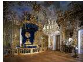
Lin.II, Schlafzimmer, R.7 mit Bettalkoven, DE002488, BSV-