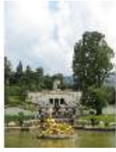
Lin.V, Wasserparterre, Terrassengärten, 300-jährige Linde, DI006119, BSV