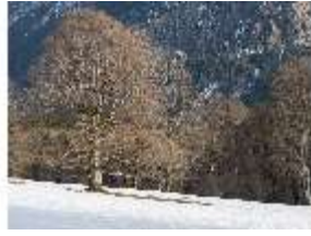
Lin.V, Schlosspark im Winter, DI025157, BSV-