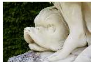
Lin.V,P, Gartenfigur: Vier Elemente - Wasser (Detail: Delfin), DI023233, BSV