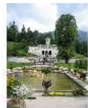
Lin.V, Wasserparterre, Terrassengärten mit Venustempel, DI006129, BSV