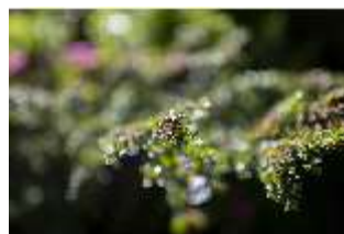
Lin.V, Terrassengärten, Detail Bepflanzung, DI016751, BSV-