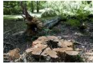
Lin.V, Wald, Baumarbeiten, DI016792, BSV-