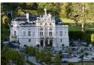
Lin.I, Hauptfassade, von Süd-Westen aus, DI005775, BSV