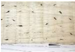
Lin.III,T, Hermelinbehang, DI018762, BSV