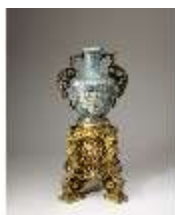
Lin.III,V, Cloisonné-Vase, DI019018, BSV-