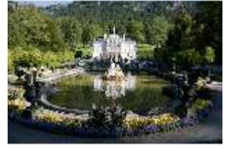
Lin.I, Hauptfassade von Süden, Wasserparterre mit Bassin, DI005753, BSV