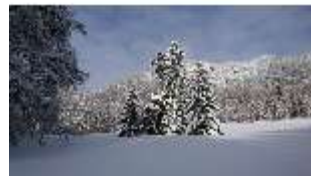
Lin.V, Garten mit Schnee im Winter, DI013269, BSV-