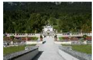
Lin.I, Hauptfassade von S, von Terrassengärten auf Nordhang, DI005806, BSV