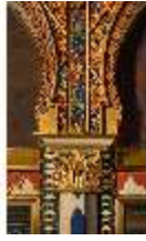
Lin.II, Marokkanisches Haus, Salon, Blendarkade Pfeiler, DI008932, BSV-