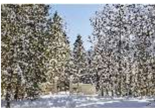
Lin.V, Verbotenes Tor verschneit im Winter, DI007331, BSV-