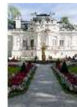
Lin.I, Westfassade, Parterre, mit Brunnenfigur "Fama", DI005893