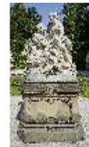
Lin.V, Figurengruppe Venus und Adonis, Lin.Gf0007, DI023285, BSV-