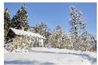
Lin.V, Königshäuschen verschneit im Winter, DI007320, BSV-