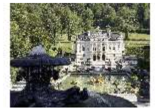
Lin.V, Hauptfassade und Wasserparterre mit Flora-Brunnen, DI027064, BSV-