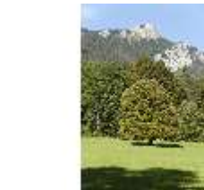
Lin.V, Landschaftlicher Garten, DI005666, BSV