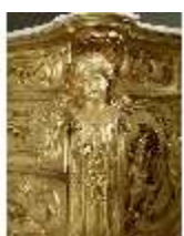
Lin.III,M, Kommode, Pössenbacher, DI015636, BSV-