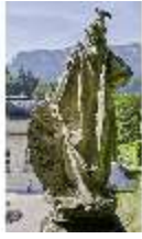
Lin.V, Gartenfigur Vier Erdteile - Europa, Lin.Gf0010, DI023306, BSV-