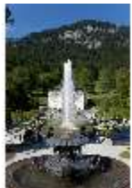
Lin.I, Hauptfassade von S, Terrassengärten, Najadenbrunnen, DI005762, RSV