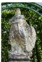
Lin.V, Gartenfigur Vier Erdteile - Europa, Lin.Gf0010, DI023302, BSV-