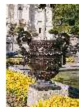
Lin.I, Südfassade und Parterre, DI008098, BSV-