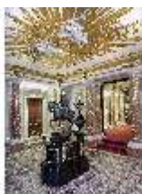
Lin.II, Vestibül mit Reiterstandbild Ludwigs XIV., R. 1, DI013230, BSV-