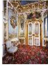
Lin.II, Blaues Kabinett, R.10, DE002054, BSV-