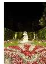
Lin.VI, Ludwignacht 2015, DI008650, BSV-