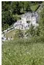
Lin.I, Blick auf das Schloss, DI005565, BSV