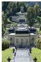
Lin.I,Nordfassade, Kaskade d.Nordhanges bis Terrassengärten, DI005867, RSV