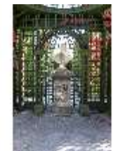
Lin.V, östl. Parterre, Treillage-Architektur, Büste König Ludwig XVI., DI005917, BSV