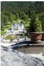
Lin.V, Blick von den Terrassengärten auf das Schloss, DI016752, BSV-