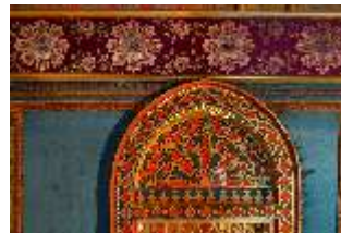
Lin.II, Marokkanisches Haus, Mosaik Spitzbogenöffnung, DI008945, BSV-