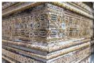
Lin.V, Maurischer Kiosk, Fassade (Detail), DI016783, BSV-