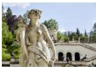
Lin.V,P, Gartenfigur: Vier Tagzeiten-Nacht-Proserpina, DI023218, BSV