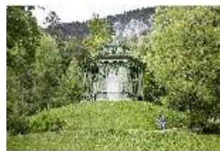
Lin.VI, Ludwignacht 2015, DI008629, BSV-