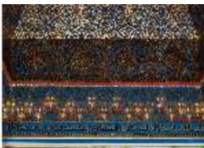
Lin.II, Marokkanisches Haus, pyramidenförmiges Oberlicht (Detail), DI008928, BSV-