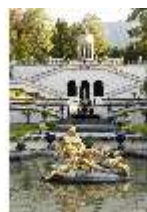
Lin.V, Wasserparterre und Terrassengärten, DI005711, BSV