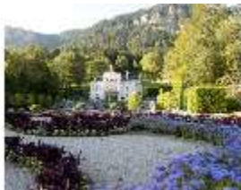
Lin.I, Hauptfassade, von Süden aus, Blumenrabatte, DI005829, BSV