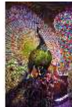
Lin.II, Maurischer Kiosk, Pfauenthron (Detail), DI004560, BSV-