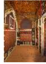
Lin.II, Marokkanisches Haus, Speisezimmer, DI008939, BSV-