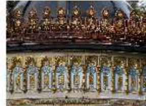
Lin.I, Maurischer Kiosk, Kuppel der Apsis (Detail), DI008894, BSV-