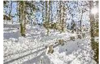
Lin.V, Schlosspark verschneit im Winter, DI007319, BSV-