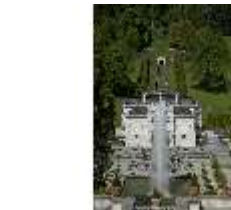
Lin.I, Hauptfassade von S, von Terrassengärten auf Nordhang, DI005805, BSV