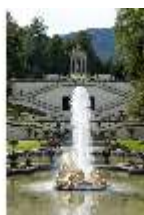
Lin.V, Wasserparterre, Terrassengärten und Venustempel, DI006042, BSV