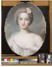
Lin.III,G, Porträt (Pastell), Pauline Félicité de Mailly-Nesle, DI012086, BSV