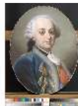
Lin.III,G, Étienne-François Duc de Choiseul-Stainville, DI019927, BSV