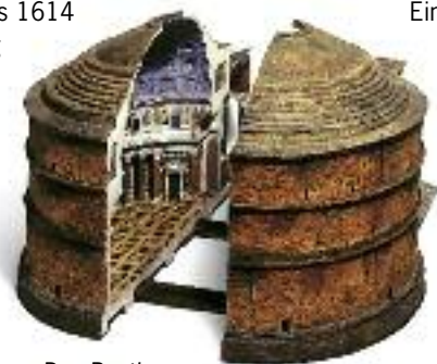
Das Pantheon aus der Korkmodellsammlung

Nach den schweren Zerstörungen im Zweiten Weltkrieg wurde zunächst das Äußere des Schlosses wiederhergestellt. 1964 konnte die Bayerische Schlösserverwaltung dann ihre Schauräume und Sammlungen wieder-