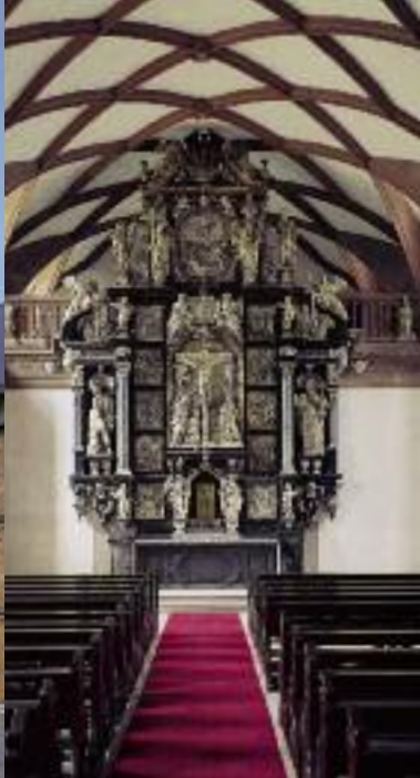
Links: Altar der Schlosskirche. Rechts: Schlafzimmer und Gesellschaftszimmer in den fürstlichen Wohnräumen