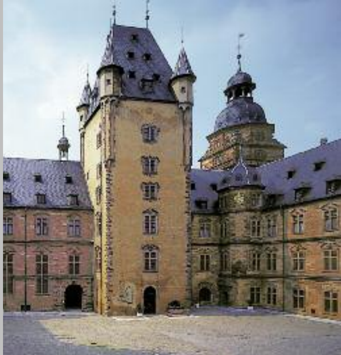
Der mittelalterliche Bergfried wurde in den Neubau von Schloss Johannisburg integriert.