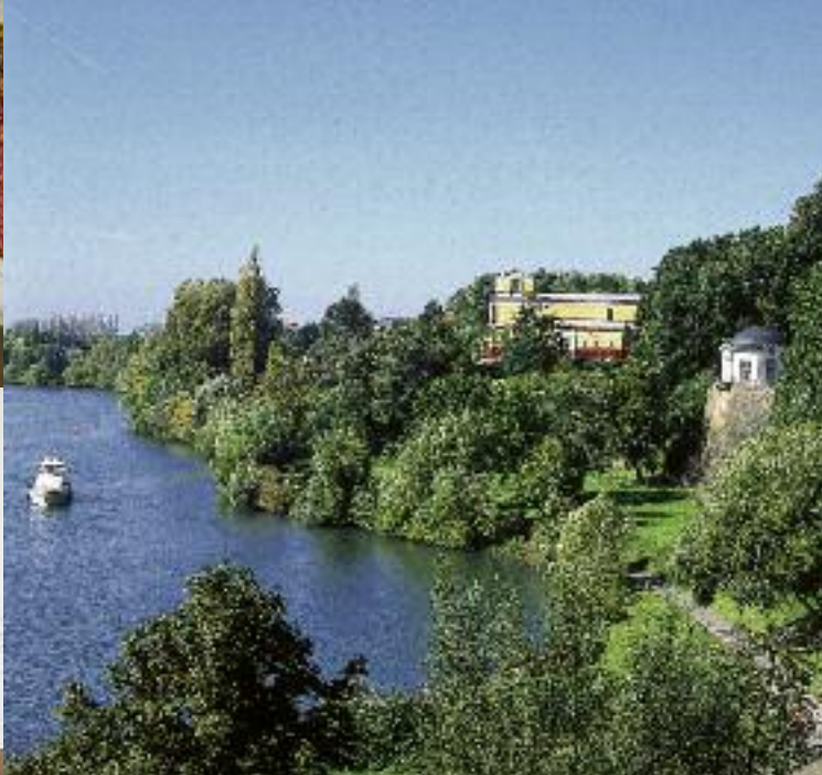
Blick von Schloss Johannisburg auf die Parkanlage am Mainufer mit Frühstückspavillon und Pompejanum