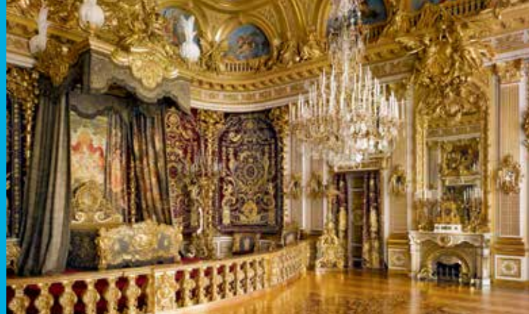
Paradeschlafzimmer im Großen Appartement, im Stil Ludwigs XIV. von Frankreich. Der teuerste Raum des 19. Jahrhunderts wurde 1879–1881 geschaffen

Bayerischer Staatsminister der Finanzen, für Landesentwicklung und Heimat