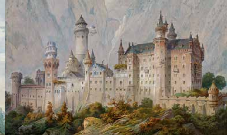
Nicht ausgeführter Idealentwurf für Schloss Neuschwanstein, 1869 von dem Theatermaler Christian Jank geschaffen (WAF), Ludwig II.-Museum

Modell für ein Richard-Wagner-Festspieltheater auf dem Isarhochufer in München, geplant 1864–1866, Ludwig II.-Museum