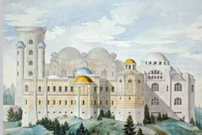
Entwurf eines byzantinischen Palastes, Aquarell von Julius Hofmann, 1885; Tagebuch König Ludwigs II. mit Grialstempel (Mitte), beide Ludwig II.-Museum