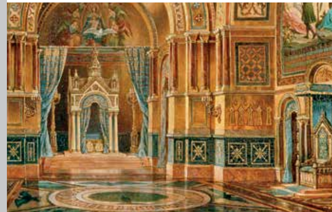
Tableau de la chambre à coucher du projet du château fort de Falkenstein, Max Schultze, 1885; Musée du roi Louis II

Le musée installé dans douze salles à l'agencement moderne, situées au rez-de-chaussée de l'aile sud, a été ouvert au public en 1987. Il est consacré aux différentes phases de la vie de Louis II, depuis sa naissance jusqu'à sa tragique mort prématurée. Il montre des portraits peints, des bustes, des photographies historiques et des habits d'apparat d'origine. En tant que mécène du compositeur Richard Wagner, le roi est entré