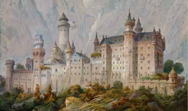
Boceto ideal no ejecutado del Castillo Neuschwanstein, realizado por el pintor de Teatros Christian Jank en 1869; Museo del Rey Luis II (WAF München)