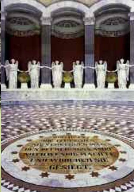
Blick in die Kuppel mit Glaslaterne (li. oben); Kalksteinfigur »Rheinländer« (li. unten); Blick in die Halle mit Bodenmosaik (re.)