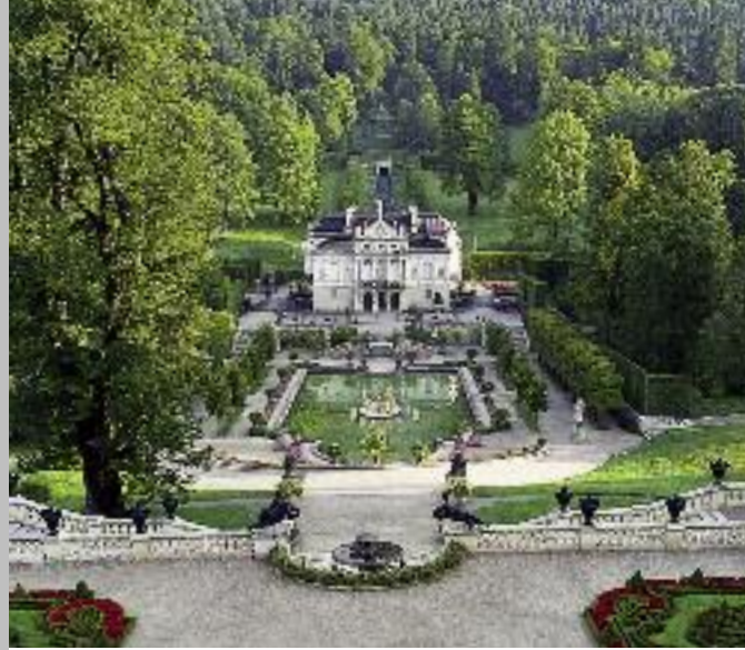
Blick von den Terrassengärten auf Schloss und Kaskade mit Pavillon (o.); Gartenvase von J. Loebnitz, Paris um 1876 (u.)