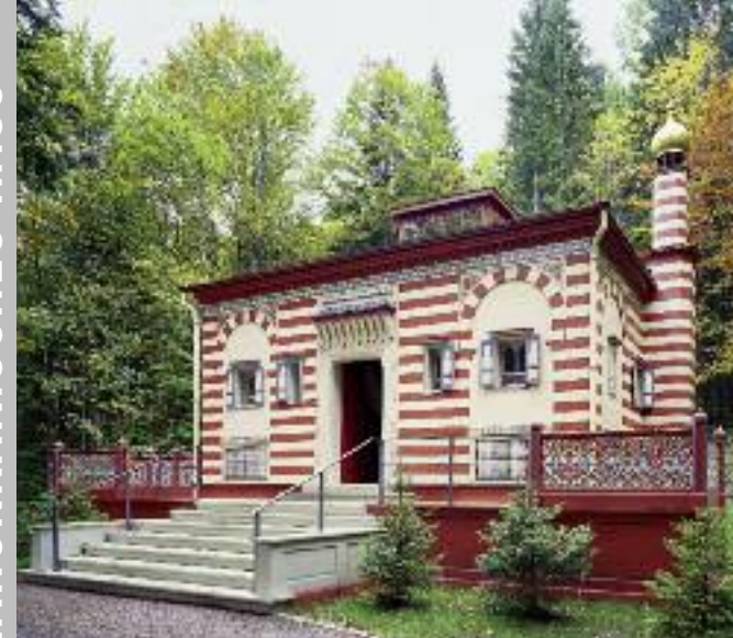
Außenansicht (oben) und Mittelraum (unten) des Marokkanischen Hauses