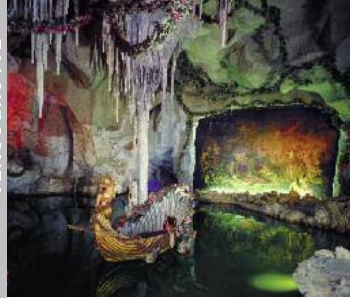
Die künstliche Venusgrotte im Park ist seit 1881 elektrisch beleuchtet.