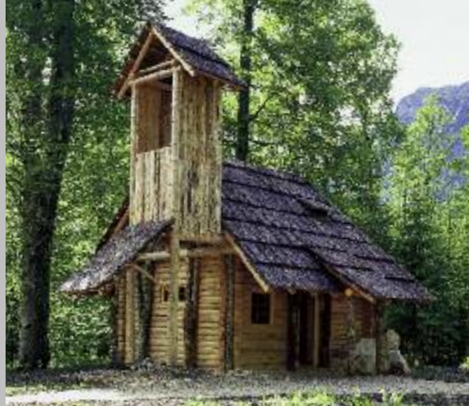
Die Einsiedelei des Gurnemanz im Park (oben); Hundinghütte mit Bärenfellen, Trinkhörnern und Geweihleuchtern (unten)