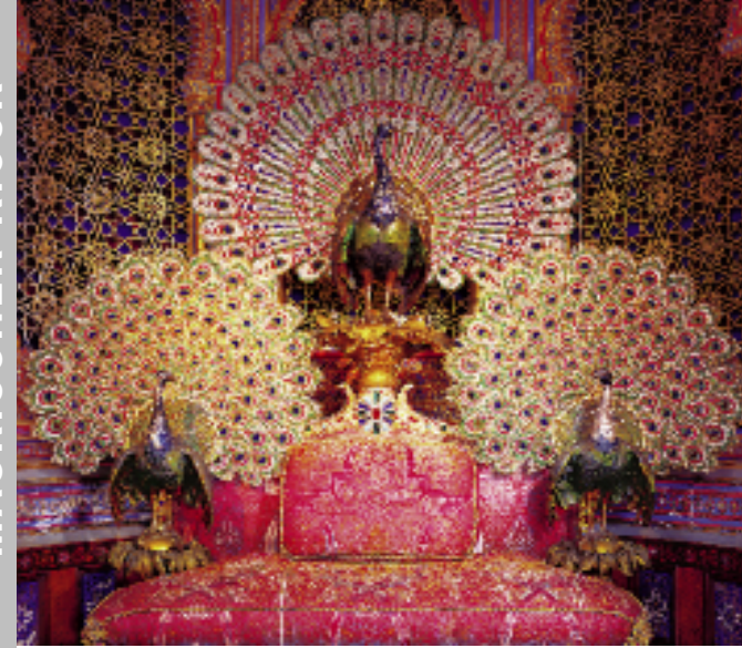
Ludwigs phantastischer Pfauenthrone im Maurischen Kiosk (oben); Maurischer Kiosk im Park (unten)