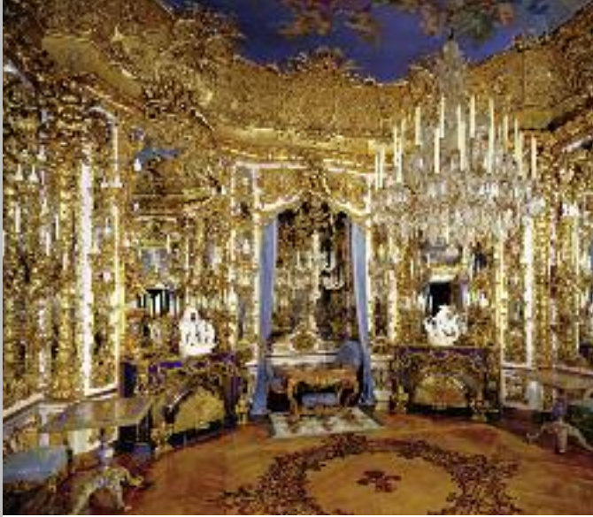
Spiegelsaal nach Vorbild in der Residenz München (oben); geschnitzte Türfüllung mit Doppel-»L« für Ludwig (unten)