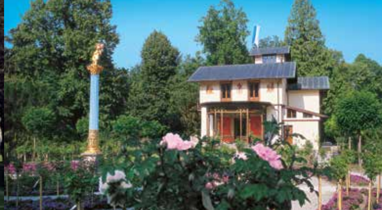
La roseraie devant l'aile est du casino