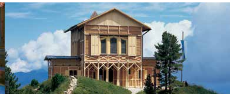
La maison royale du Schachen

C'est dans un site grandiose devant le massif alpin du Wetterstein que le roi Louis II fit construire à 1800 m d'altitude un petit château. L'aspect extérieur et l'intérieur du rez-de-chaussée sont simples alors que l'étage supérieur abrite un faste oriental. Dans cette salle turque, somptueusement décorée, aménagée de divans et d'une fontaine, le roi aimait à fêter son anniversaire et sa fête, dans la solitude des montagnes. On ne peut accéder à la maison royale qu'à pied en partant d'Elmau ou de Garmisch-Partenkirchen.