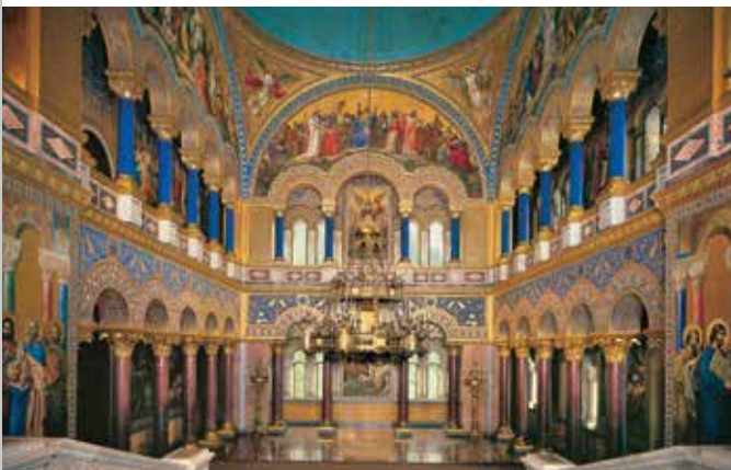
La salle du trône dans le château de Neuschwanstein

Le château fut construit par Louis II en 1868 dans un lieu qui lui était familier puisqu'il surplombe le château de son père Hohenschwangau mais ne fut jamais terminé. Neuschwanstein était pour lui un monument érigé à la culture et à la royauté du temps du Moyen-Âge qu'il admirait et voulait faire revivre. Le château construit et aménagé dans le style moyenâgeux mais avec tous les raffinements techniques les plus modernes de l'époque est un des édifices les plus connus du monde entier et le symbole de l'idéalisme allemand. Des cycles de tapisseries faisant trait aux anciennes légendes nordiques et chevaleresques décorent les pièces intérieures. La salle des chanteurs rappelle deux salons de la Wartburg; La salle du trône, salon culte de la royauté rappelle les églises byzantines et celles du début de l'ère chrétienne.