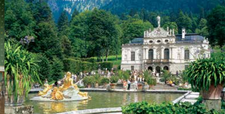
La façade principale du château de Linderhof