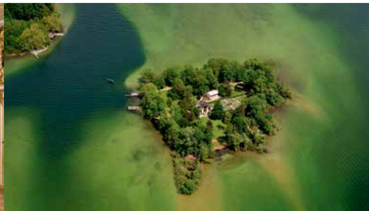
L'île des roses et les zones riveraines de bas-fond

Louis II aimait cette petite île où se trouvait le Casino de son père de style pompéien. Dans sa jeunesse il y reçut des invités de marque comme par exemple la tsarine Maria Alexandrowna. Parfois, il y rencontra l'impératrice Elisabeth d'Autriche avec qui il était en grande affinité. On y replanta de nombreuses sortes de roses historiques qui embaument. On peut visiter le casino restauré avec beaucoup de finesse de façon remarquable. Une petite exposition dans la «maison du jardinier» nous informe sur l'histoire étonnamment longue de l'île. Les restes de villages de palafittes préhistoriques au fond du lac de Starnberg près de l'île aux Roses font partie du patrimoine culturel mondial de l'UNESCO. Pas loin de là, sur la rive est du lac se trouve la Chapelle votive. Elle fut construite dans les hauteurs au-dessus de l'endroit où Louis II trouva la mort le 13 juin 1886 non loin de son château de Berg.