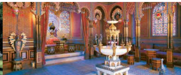
Le kiosque mauresque de Linderhof

derhof des salons somptueux d'une grande richesse. Le parc, un des plus beaux du 19ème siècle regroupe des éléments du jardin baroque avec ses plans d'eau magnifiques et ceux du style naturaliste des jardins à l'anglaise. Il abrite des bâtiments fascinants comme la maison marocaine, le kiosque mauresque et la grotte de Venus. Celle-ci est une immense grotte artificielle aménagée d'après les indications scéniques de Richard Wagner pour le 1er acte de son opéra Tannhäuser. On y trouve aussi deux décors érigés pour les drames musicaux de Wagner comme la chaumière de Hunding (1er acte des Walkyries) et l'ermitage de Gurnemanz (IIIème acte de Parsifal). Linderhof était le lieu préféré de Louis II.