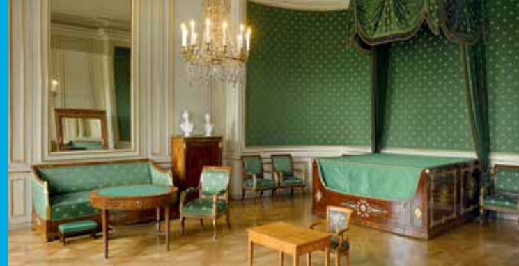
La chambre à coucher où naquit le roi Louis II

Bayerischer Staatsminister der Finanzen, für Landesentwicklung und Heimat