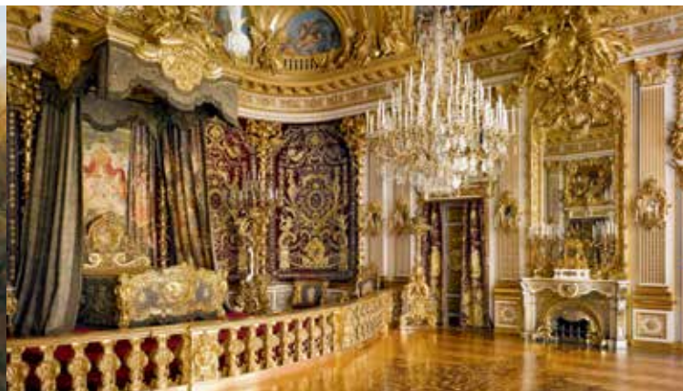
La chambre d'apparat dans le château de Herrenchiemsee

C'est en 1878 que fut construit ce monument de l'absolutisme à l'exemple du château de Versailles mais qui surpasse en somptuosité de beaucoup l'original. La chambre d'apparat dans le Grand Appartement est la pièce dont l'aménagement fut le plus coûteux au 19ème siècle. La décoration en porcelaine du Petit Appartement est la plus importante commande faite par une seule personne qu'eût jamais reçu la manufacture de Porcelaine de Meissen. Les broderies textiles sont en nombre et en qualité sans pareil. Louis II a soutenu dans ce château la royauté de façon conséquente et avec tous les moyens dont il disposait. Le château ne fut pas terminé ainsi que le parc qui l'entoure. Il devait s'y trouver suivant l'exemple de Versailles des parterres d'eau magnifiques qui devaient recouvrir presque toute l'île. Aujourd'hui, il est entouré d'un parc naturel et de biotopes importants. Le grand musée Louis II présente dans le château la vie et les entreprises de cet «unique roi du 19ème siècle» comme Paul Verlaine le nomma en 1886.