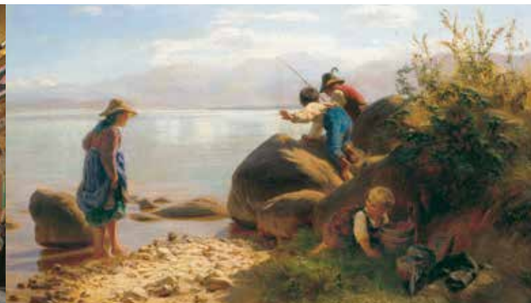
'Enfants pêchant au bord du Lac de Chiemsee', F. W. Pfeiffer

Ce couvent fondé en 640 est le plus ancien de Bavière. C'est aussi un évêché doté d'une cathédrale (1215–1808). Lorsque Louis II acheta l'île de Herrenchiemsee en 1873, il y fait aménager des pièces d'habitation dans les bâtiments du cloître. C'est ici aussi que se réunit en 1948 l'assemblée constitutionnelle pour préparer la constitution. Une documentation de cet important chapitre de l'histoire de l'Allemagne se trouve au musée. D'autres pièces illustrent la longue et riche histoire du couvent. Les tableaux de Peintres du Chiemsee sont exposés dans deux galeries. Une partie des appartements royaux a été aménagée avec beaucoup d'authenticité. Les deux salles de style haut baroque entièrement conservées et décorées de peintures en trompe-l'œil ainsi que la bibliothèque de style baroque tardif de Johann Baptist Zimmermann valent à elle seules la peine de visiter ce lieu important pour l'histoire de la Bavière.