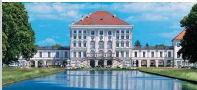
Le château de Nymphenburg

du roi Louis II qui surpassent en tous points par leur somptuosité les exemples de carrosses baroques que l'on connaissait jusque là. Le roi les utilisait surtout pour ses sorties nocturnes dans la montagne ce qui bien sûr suscitait l'admiration des rares personnes qu'il rencontrait. Une ampoule électrique éclairait déjà la couronne royale du traîneau aux petits amours et les carrosses avaient déjà des ressorts à lames semblables à ceux employés sur les automobiles quelques années plus tard. La combinaison de formes historiques liées à la technique moderne est typique pour l'époque. Si l'on veut vraiment comprendre le roi Louis II, il faut avoir vu ses carrosses et ses traîneaux comme les harnais magnifiques qui paraient les chevaux. Des portraits des chevaux préférés du roi complètent l'exposition.