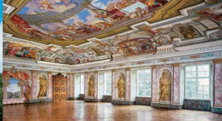
Salle impériale baroque dans le couvent des chanoines augustins