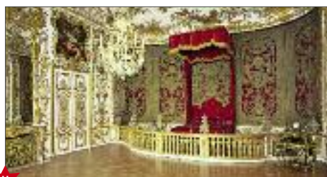
★ Reiche Zimmer