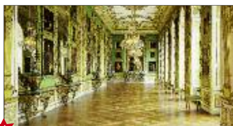
★ Grüne Galerie