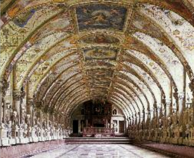
Nell'Antiquarium si trovano ancora oggi circa 300 busti della collezione del duca Alberto V