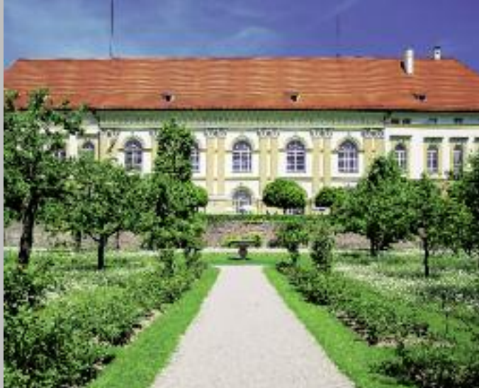
Il Castello di Dachau con parterre visto dal lato del giardino di corte

Riprod. in copertina: Re Ludovico I avvolto nel manto regale dell'incoronazione, Joseph Stieler, 1826 circa