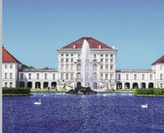
Dalla facciata del parco è riconoscibile la suddivisione interna. Al centro, dietro ai grandi finestroni, si trova il salone delle feste, mentre gli appartamenti residenziali si trovano sui lati.