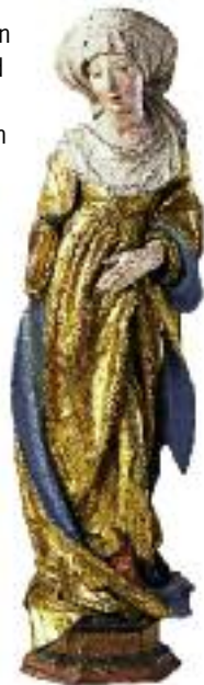
Kaiserin Kunigunde, Schnitzfigur aus dem Altar Kaiser Friedrichs III., 1487, Oberkapelle

Ebenfalls mit einer Führung besichtigt werden können der Tiefe Brunnen und der Sinwellturm. Das Brunnenhaus mit dem Tiefen Brunnen befindet sich in der Mitte des Vorhofs. Der Brunnenschacht reicht 47 Meter tief in den Burgfelsen hinein. Er stammt wahrscheinlich aus der ersten Entstehungszeit der Kaiserburg und ist seit dem 14. Jahrhundert urkundlich erwähnt. Der runde Sinwellturm (»sinwell« mittelhochdt. = rund) wurde in der 2. Hälfte des 13. Jahrhunderts als Bergfried der Kaiserburg erbaut. Von der Aussichtsplattform in 385 Meter Höhe hat der Besucher einen weiten Blick über die gesamte Stadt Nürnberg. Die berühmte mehrhundertjährige »Kunigundenlinde«