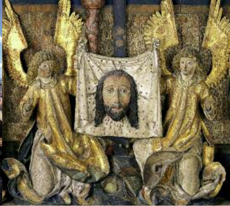
Altarschrein mit Darstellung des »Schweißbuchs der hl. Veronika«, das von zwei Engeln gehalten wird, Nürnberg, Anfang 16. Jh.

des 15. Jahrhunderts entstand. In der Zeit der Burgenromantik des 19. Jahrhunderts wurde die Kaiserburg »wiederentdeckt« und neu eingerichtet. Diese Ausstattung wurde in den 1930er-Jahren entfernt. Nach dem Wiederaufbau der im Zweiten Weltkrieg stark zerstörten Kaiserburg wurde der Palas mit Gemälden, Möbeln und Tapiserien aus dem 16. und 17. Jahrhundert ausgestattet, um einen Eindruck vom Aussehen der Räume in der Renaissancezeit zu vermitteln.