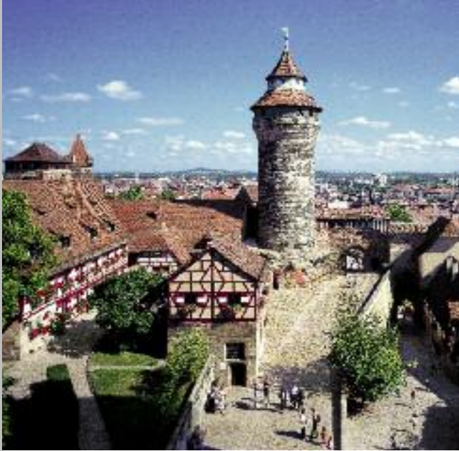
Blick in die Vorburg mit Sekretariatsgebäude (links), Brunnenhaus (Mitte) und Sinwellturm