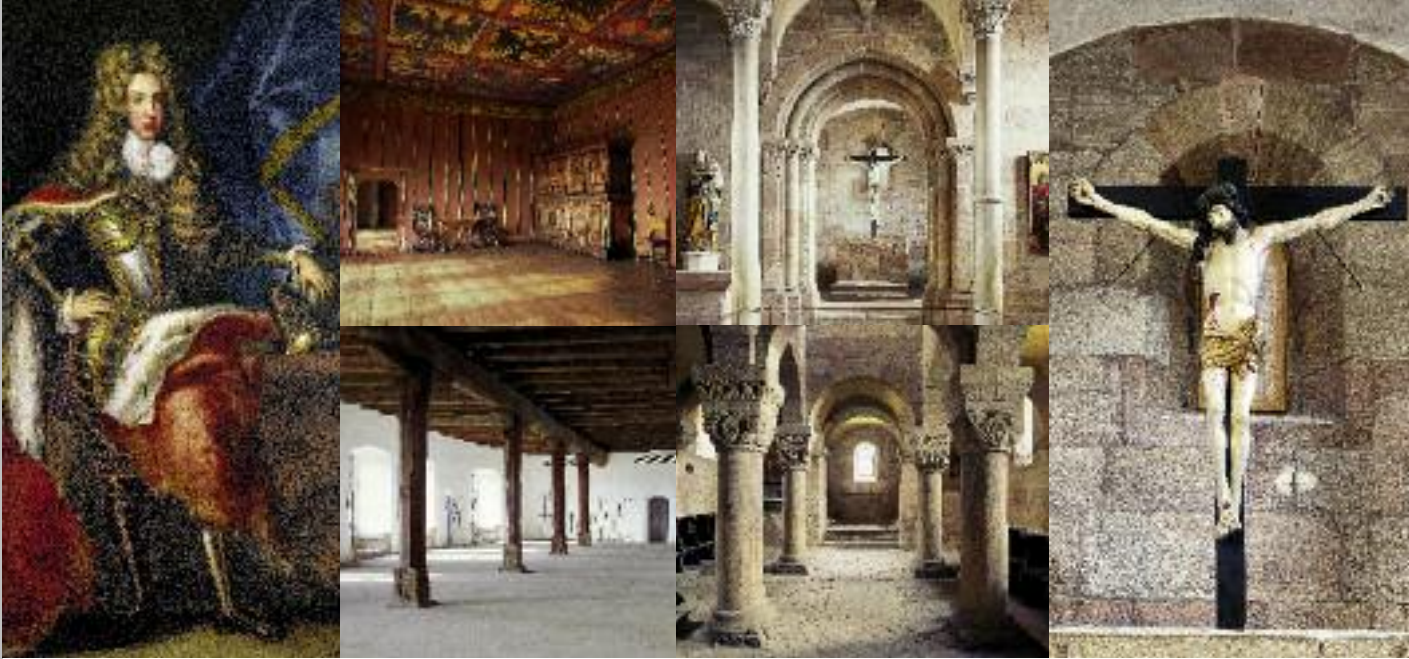
Bildnis Kaiser Karls VI. (links); Empfangszimmer des Kaisers (rechts oben); Rittersaal (rechts unten)