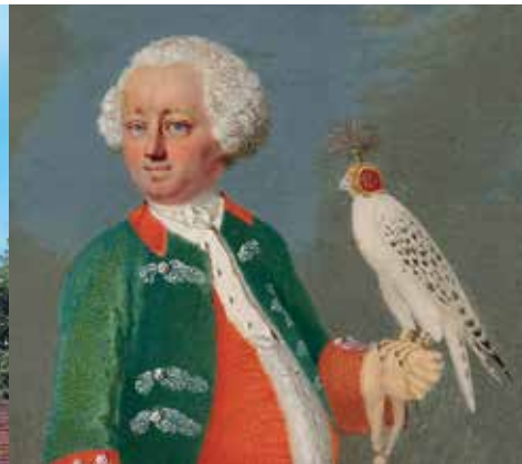
Der »Wilde Markgraf« als Falkner (li.); Jagdl. Glaskelch (re.)

Die 2011 in der Burg Zwernitz eröffnete Ausstellung stellt das höfische Jagdwesen in den beiden Markgrafentümern Ansbach und Bayreuth auf seinem Höhepunkt im 18. Jahrhundert vor. Als zentrales Ereignis höfischer Repräsentation nahm die Jagd auch hier – wie an allen Höfen des Barockzeitalters – eine herausragende Stellung ein. Fast alle Markgrafen aus dem Haus Hohenzollern waren passionierte Jäger. Nicht selten verschlangen die Kosten für die Jagd einen bedeutenden Anteil des Staatshaushalts. Da im Heiligen Römischen Reich Deutscher Nation das kaiserliche Recht (Regal) der Hohen Jagd auf Hirsche, Bären oder Wildschweine den Landesherren verliehen wurde, nutzten diese praktisch ihr gesamtes Territorium als fürstliches Jagdgebiet. Daher mussten im ganzen Land Jagdunterkünfte – mitunter sogar eigene Schlösser – unterhalten werden. Zahlreich war das Jagdpersonal, überall hielt man umfangreiches Jagdzeug vorrätig. Jagdaufenthalte dienten außerdem auch der Visite der verschiedenen Landesteile. Beeindruckende Ausstellungsstücke und aufschlussreiche Informationen ermöglichen einen spannenden Einblick in diese längst vergangene Welt der höfischen Jagd.