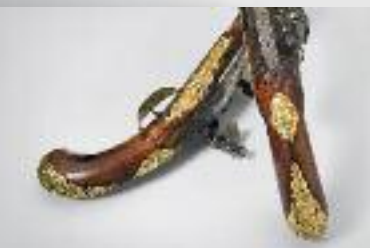
Prunkwaffen und kostbare Jagdaccessoires