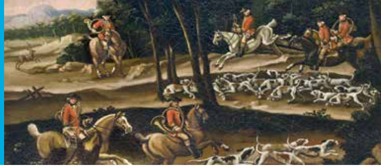
Die höfische Parforcejagd, Gemälde der Brüder Kleemann

Bayerischer Staatsminister der Finanzen, für Landesentwicklung und Heimat