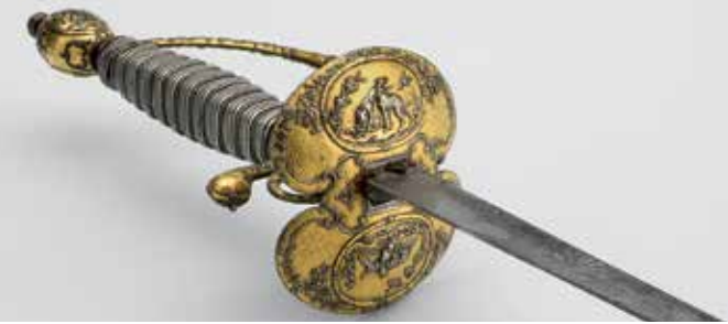
Jagdlicher Luxus-Galanteriedegen, Frankreich, um 1770