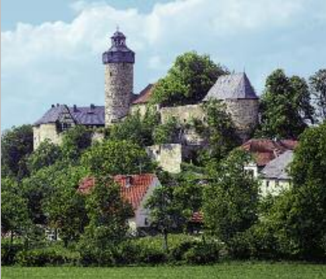
Ansicht der Burg Zwernitz von Südosten