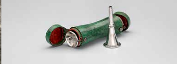
Steinschlossbüchse des Markgrafen Friedrich, 1729 u. 1738 (o.); Silberne Jagdhornmundstücke mit Etui, um 1780 (u.)