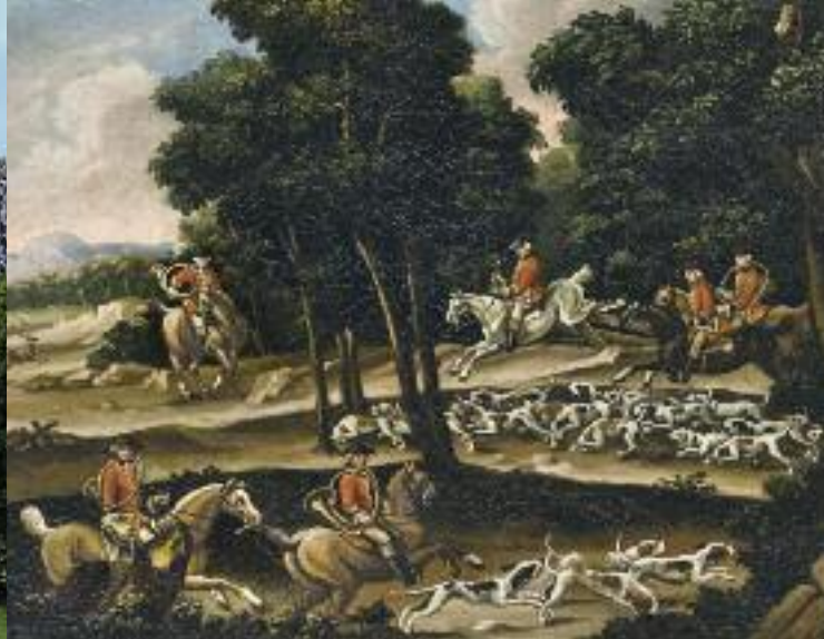
Oben: Die höfische Parforcejagd, Gemälde der Brüder Kleemann; unten: Ansbacher Jagdtaler