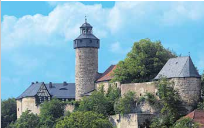
Ansicht der Burg Zwernitz von Südosten

Die auf einem schmalen Dolomittfelsen thronende Burg Zwernitz wurde im Jahr 1156 als Stammsitz der Walpoten erstmals urkundlich erwähnt. Um 1300 wurde sie Amtssitz der Burggrafen von Nürnberg und später der Kulmbacher bzw. Bayreuther Markgrafen. Vom Bergfried, von dem sich ein weiter Blick über den Naturpark Fränkische Schweiz bietet, konnten Rauchsignale über ein System von Beobachtungstürmen (Warten) bis zur Plassenburg in Kulmbach weitergeleitet werden. Von der spätromanischen Burg haben sich größere Teile erhalten, die man an den typischen Buckelquadern erkennt. In den 1740er Jahren ließ Markgraf Friedrich im Zuge der Anlage des Felsengartens Sanspareil auch die Burg wieder instand setzen. Wenn sich die höfische Jagdgesellschaft in der nahen Schlossanlage um den Morgenländischen Bau aufhielt, sollte die Burg als geschichtsträchtiger »Point de Vue« an die ritterliche Vergangenheit der Hohenzollern erinnern. Ein eigener Raum widmet sich der Dokumentation dieser Geschichte der Burg.