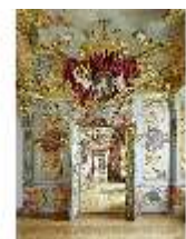
KemRes.II, Enflade, DI011348, BSV-