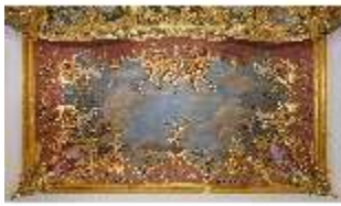
KemRes.II, Schlafzimmer, Deckenfresko, DI015546, BSV-