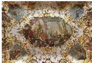
KemRes.II, Audienzzimmer, Deckengemälde, DI015578, BSV-