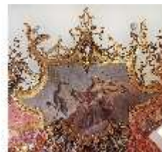
KemRes.II, Tagzimmer, Eckkartusche, DI015569, BSV-