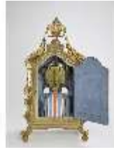
KemRes.III,U, Prunkuhr mit Schaukelpendel, KemRes.U0002, DI011723, RSV