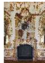
KemRes.II, Audienzzimmer, Kamin, DI015577, BSV-