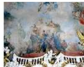
KemRes.II, Thronsaal, Deckengemälde, ü. Nordwand, östl., DE002316