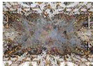
KemRes.II, Thronsaal, Deckengemälde, DI015591, BSV-