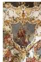
KemRes.II, Audienzzimmer, Eckkartusche, DI015583, BSV-