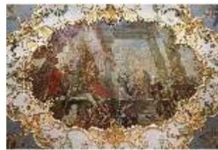
KemRes.II, Audienzzimmer, Deckengemälde, DI015579, BSV-