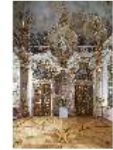
KemRes.II, Thronsaal, DI015592, BSV-