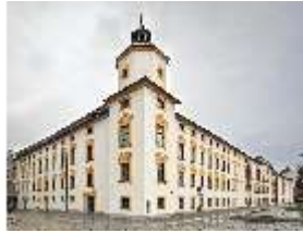
KemRes.I, Südwestlicher Eckturm, DI015611, BSV-