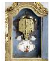
KemRes.III,U, Prunkuhr mit Schaukelpendel, KemRes.U0002, DI011720, RSV