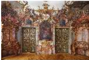
KemRes.II, Tagzimmer, DI015554, BSV-