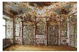
KemRes.II, Audienzzimmer, DI015575, BSV-