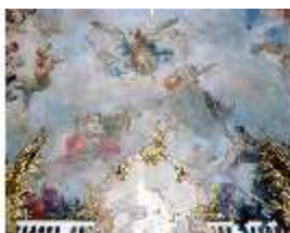
KemRes.II, Thronsaal, Deckengemälde, ü. Ostwand, DE002747, BSV-