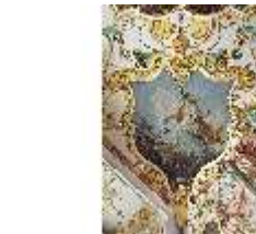
KemRes.II, Audienzzimmer, Eckkartusche, DI015580, BSV-