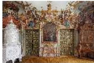
KemRes.II, Tagzimmer, DI015555, BSV-