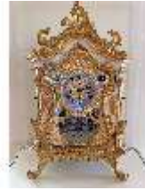
KemRes.III,U, Prunkuhr, Pendule, KemRes.L-U0001, DI023758, BSV