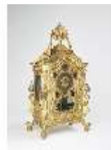
KemRes.III,U, Prunkuhr mit Schaukelpendel, KemRes.U0002, DI011715, RSV