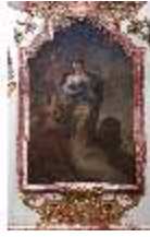
KemRes.II, Tagzimmer, Ölgemälde Kardinaltugend, DI015560, BSV-