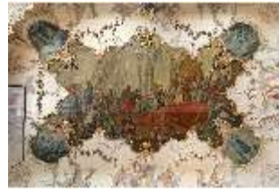
KemRes.II, Kanzlei, Deckenfresko, DI015544, BSV-