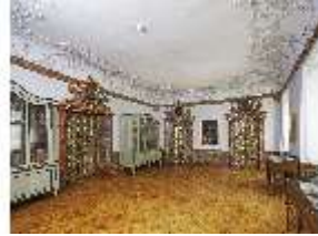
KemRes.II, Vorsaal, DI015584, BSV-