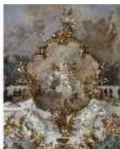
KemRes.II, Thronsaal, Allegorie der Wissenschaft, DI015598, BSV-