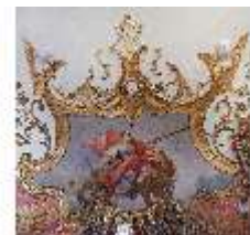
KemRes.II, Tagzimmer, Eckkartusche, DI015570, BSV-