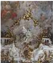
KemRes.II, Thronsaal, Allegorie der Geometrie, DI015599, BSV-