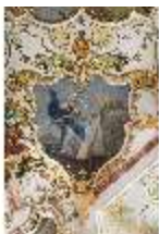
KemRes.II, Audienzzimmer, Eckkartusche, DI015581, BSV-