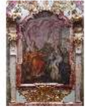
KemRes.II, Tagzimmer, Ölgemälde Kardinaltugend, DI015563, BSV-