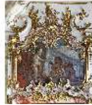
KemRes.II, Thronsaal, Supraporte, DI015606, BSV-