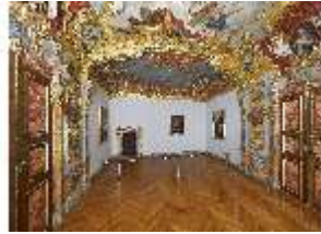
KemRes.II, Schlafzimmer, DI015551, BSV-