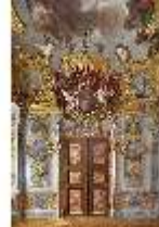
KemRes.II, Schlafzimmer, Supaporte, DI015549, BSV-