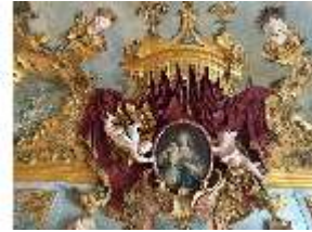
KemRes.II, "Schmerzensmutter", Supraporte, DI019595, BSV