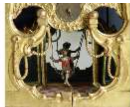
KemRes.III,U, Prunkuhr mit Schaukelpendel, KemRes.U0002, DI011713, RSV