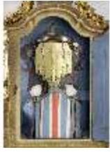
KemRes.III,U, Prunkuhr mit Schaukelpendel, KemRes.U0002, DI011721, RSV

Beschreibung Kempten Stadtresidenz, Stand: Januar 2024