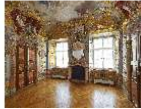
KemRes.II, Schlafzimmer, DI015552, BSV-