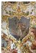
KemRes.II, Audienzzimmer, Eckkartusche, DI015582, BSV-