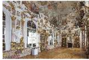
KemRes.II, Thronsaal, DI015589, BSV-