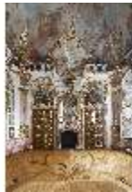
KemRes.II, Thronsaal, DI015593, BSV-