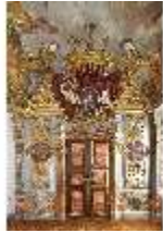
KemRes.II, Schlafzimmer, DI015550, BSV-