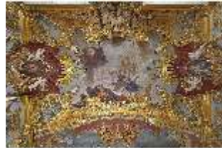
KemRes.II, Schlafzimmer, Deckenfresko, DI015547, BSV-