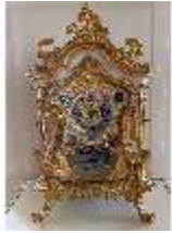
KemRes.III,U, Prunkuhr, Pendule, KemRes.L-U0001, DI023756, BSV