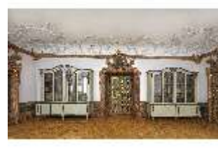
KemRes.II, Vorsaal, DI015585, BSV-