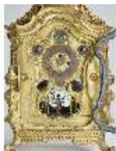
KemRes.III,U, Prunkuhr mit Schaukelpendel, KemRes.U0002, DI011712, RSV