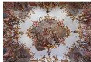
KemRes.II, Tagzimmer, Deckengemälde, DI015565, BSV-