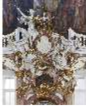
KemRes.II, Thronsaal, Thronnische, Wappen, DI015596, BSV-