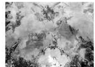
KemRes.II, Thronsaal, Deckengemälde, ü. Ostwand, DE002746, BSV-