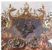
KemRes.II, Tagzimmer, Eckkartusche, DI015567, BSV-