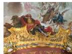
KemRes.II, Deckenbild (Det.), Schlafzimmer, DI019598, BSV