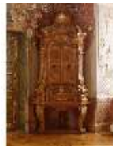
KemRes.III,M, Kabinettschrank, DE000457, BSV-