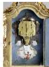
KemRes.III,U, Prunkuhr mit Schaukelpendel, KemRes.U0002, DI011719, RSV