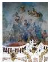
KemRes.II, Thronsaal, Ausschnitt Decke, DE002317, BSV-