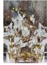
KemRes.II, Thronsaal, nördliches Portal, DI015597, BSV-