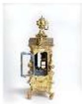
KemRes.III,U, Prunkuhr mit Schaukelpendel, KemRes.U0002, DI011717, RSV