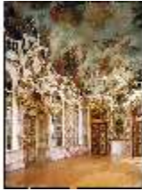
KemRes.II, Thronsaal, DE001278, BSV-