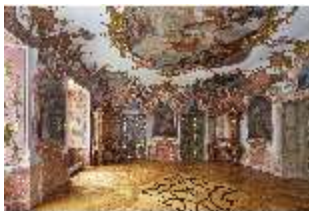
KemRes.II, Tagzimmer, DI015558, BSV-