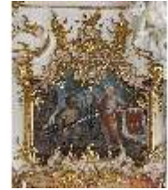
KemRes.II, Thronsaal, Supraporte, DI015607, BSV-