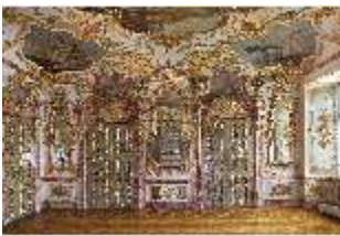
KemRes.II, Audienzzimmer, DI015576, BSV-