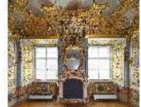
KemRes.II, Schlafzimmer, Wappen, DI015548, BSV-