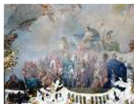
KemRes.II, Thronsaal, Deckengemälde, ü. Südwand, östl., DE002315, BSV-