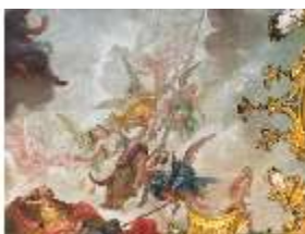
KemRes.II, Deckenbild (Det.), Schlafzimmer, DI019596, BSV