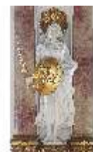
KemRes.II, Thronsaal, Längsseite, Allegorie, DI015600, BSV-