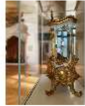
KemRes.III,U, Prunkuhr, Pendule, KemRes.L-U0001, DI023759, BSV