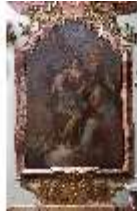
KemRes.II, Tagzimmer, Ölgemälde Kardinaltugend, DI015561, BSV-