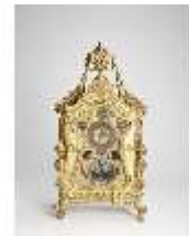
KemRes.III,U, Prunkuhr mit Schaukelpendel, KemRes.U0002, DI011711, RSV