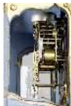
KemRes.III,U, Prunkuhr mit Schaukelpendel, KemRes.U0002, DI011718, RSV