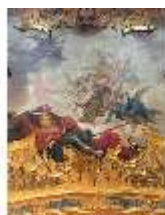
KemRes.II, Deckenbild (Det.), Schlafzimmer, DI019597, BSV