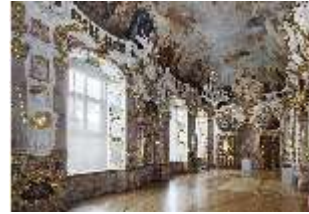
KemRes.II, Thronsaal, DI015590, BSV-