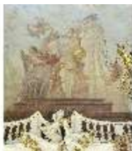
KemRes.II, Thronsaal, Deckengemälde, DI011347, BSV-