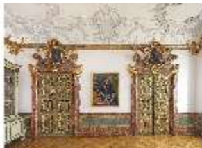
KemRes.II, Vorsaal, DI015587, BSV-