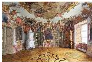
KemRes.II, Tagzimmer, DI015559, BSV-