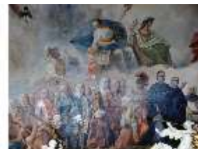
KemRes.II, Thronsaal, Ausschnitt Decke, DE002318, BSV-