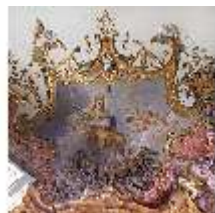
KemRes.II, Tagzimmer, Eckkartusche, DI015568, BSV-