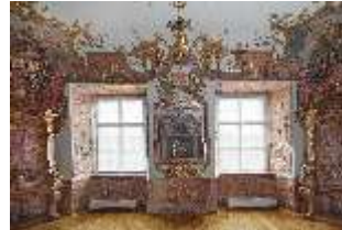
KemRes.II, Tagzimmer, DI015556, BSV-