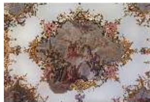
KemRes.II, Tagzimmer, Deckengemälde, DI015566, BSV-