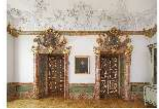
KemRes.II, Vorsaal, DI015586, BSV-