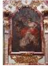
KemRes.II, Tagzimmer, Ölgemälde Kardinaltugend, DI015562, BSV-