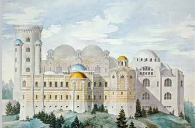
Entwurf eines byzantinischen Palastes, Aquarell von Julius Hofmann, 1885; Tagebuch König Ludwigs II. mit Grialstempel (Mitte), beide Ludwig II.-Museum