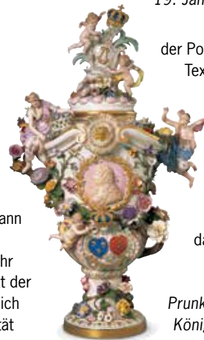
Prunkvase mit Reliefbüste König Ludwigs XIV. von Frankreich

Seit 1878 ließ Ludwig II. auf der Herreninsel ein Abbild des Schlosses Versailles als »Tempel des Ruhmes« für den »Sonnenkönig« Ludwig XIV. von Frankreich errichten, also ein Denkmal des absolutistischen Königtums ohne praktische Funktion. Der Architekt Georg Dollmann musste das Vorbild studieren und auch Räume rekonstruieren, die in Versailles längst nicht mehr bestanden. Die Haupträume sind der Höhepunkt der Ausstattungskunst des 19. Jahrhunderts, ungleich prunkvoller als in Versailles. Die Fülle und Qualität