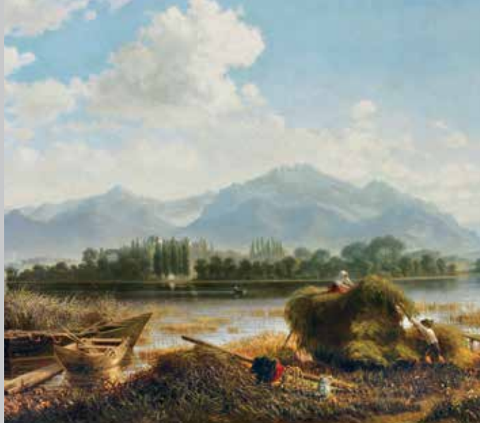
Blick auf Herrenchiemsee von der alten Überfahrtstelle Urfahrn aus, die auch Ludwig II. benützte. Gemälde des »Chiemseemalers« Albin Mattenheimer, 1874