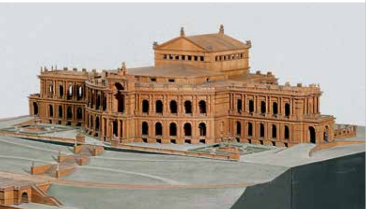
Modell für ein Richard-Wagner-Festspieltheater auf dem Isarhochufer in München, geplant 1864–1866, Ludwig II.-Museum

sind Porträts, schriftliche Dokumente sowie Theater- und Bühnenbildmodelle ausgestellt. Die »Königsschlösser« Neuschwanstein, Linderhof und Herrenchiemsee sind ebenso dokumentiert wie die anderen Bauprojekte Ludwigs II. Originale Prunkmöbel aus dem zerstörten königlichen Appartement der Münchener Residenz oder aus dem ersten Schlafzimmer von Schloss Linderhof sind Höhepunkte des Museums. Schau- und Prunkstücke des Kunsthandwerks, vom König in Auftrag gegeben, dokumentieren den europäischen Rang der Münchener Kunst in der zweiten Hälfte des 19. Jahrhunderts.