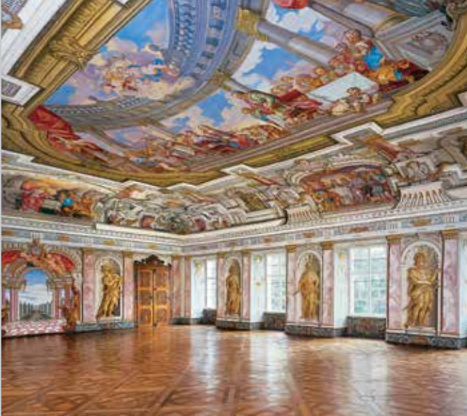
Barocker Kaisersaal mit illusionistischen Wand- und Deckenmalereien von Benedikt Albrecht (oben); Detail eines Türlügels im Kaisersaal (unten)