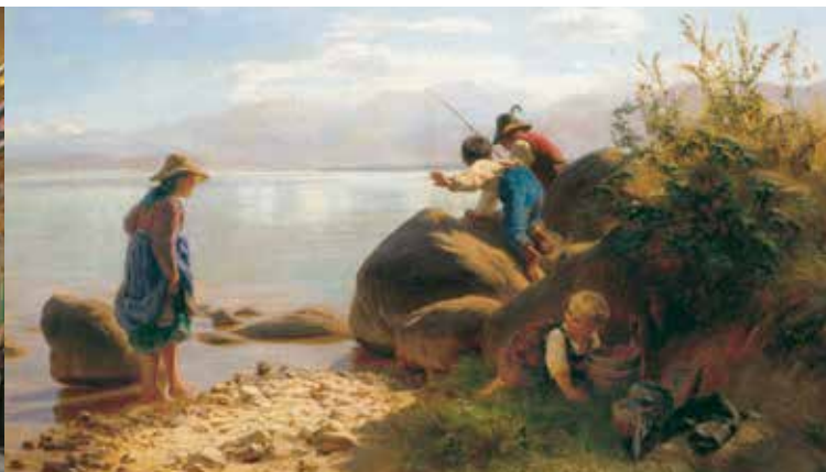
'Bambini che pescano sul lago Chiemsee', F. W. Pfeiffer

Si tratta del più antico convento bavarese (fondato intorno al 640); sede vescovile con Duomo (1215–1808). Allorché Ludovico II, nel 1873, comprò la Herreninsel (Isola dei Signori), fece sistemare delle stanze residenziali all'interno del complesso conventuale barocco. Nel 1948 vi si riunì l'Assemblea Costituente che gettò le basi della Costituzione della Repubblica Federale. Nel museo è documentato questo importante capitolo della storia tedesca. Altre stanze illustrano la lunga e ricca storia del convento. Due gallerie presentano quadri dei cosiddetti Pittori del Chiemsee. Una parte degli appartamenti reali conserva ancora gli arredi autentici. Due sale dell'alto barocco con pitture illusionistiche perfettamente conservate e la sala tardobarocca della Biblioteca di Johann Baptist Zimmermann valgono già da sole la visita di questo importante luogo della storia bavarese.