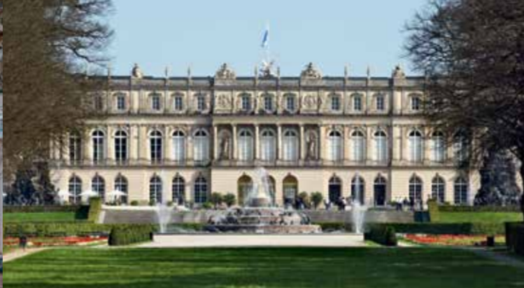
Il Castello di Herrenchiemsee (Castello Nuovo)