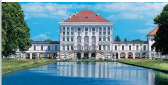
Il Castello di Nymphenburg