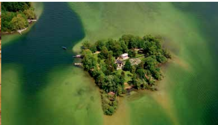
L'Isola delle rose e le circostanti zone di acqua bassa

Ludovico II amava questa isoletta dove si trovava il Casino di suo padre, arredato in stile pompeiano. Negli anni giovanili vi invitò ospiti particolari, ad esempio la zarina russa Maria Alexandrovna. Di tanto in tanto vi si incontrava con l'imperatrice Elisabetta d'Austria, a lui spiritualmente affine. Il giardino delle rose venne ricostruito piantandovi molte specie storiche profumate. Il Casino può essere visitato insieme al suo raffinato arredo, restaurato in modo impeccabile. Nella Casa del giardiniere una piccola mostra informa sulla sorprendente lunga storia dell'isola. I resti di palafitte preistoriche sul fondale del lago di Starnberg intorno all'Isola delle rose sono stati dichiarati Patrimonio mondiale dell'umanità da parte dell'UNESCO. Sulla sponda orientale del lago, prospiciente l'Isola delle rose, si trova la Cappella Votiva. Venne costruita proprio al di sopra del punto in cui Ludovico II trovò la morte, il 13 giugno 1886, nelle vicinanze del suo castello di Berg.