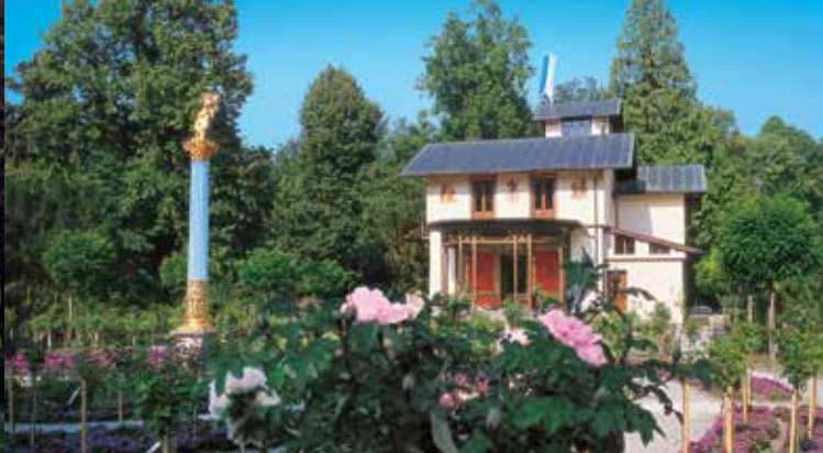
Il giardino delle rose visto dal lato est del villino