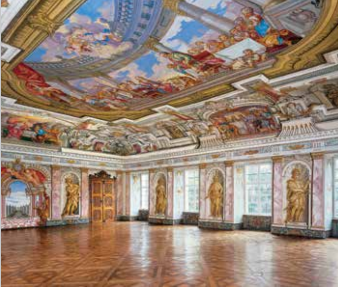
Sala Imperial en estilo barroco con pinturas ilusionistas en las paredes y en el techo (arriba); detalle de un batiente de puerta en la Sala Imperial (abajo)