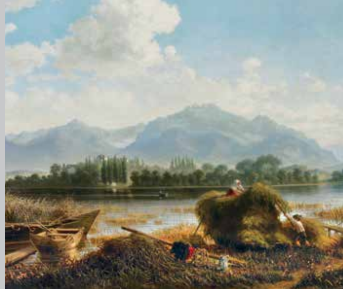
Vista de la isla Herreninsel desde el antiguo embarcadero en Urfahrn. Pintura de Albin Mattenheimer de la Pinacoteca de Pintores del Chiemsee, 1874