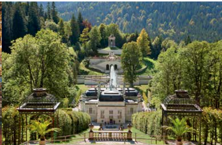
Vista dalla cascata sul Castello e sui giardini terrazzati

Il parco del castello di Linderhof è uno dei più pregevoli della sua epoca. Esso combina elementi del giardino barocco francese con quelli del giardino paesaggistico inglese. Barocche sono le terrazze con vasche d'acqua disposte sugli assi mediani e trasversali del castello, così come le aiuole geometriche, la lunga cascata e la fontana con figure. Di chiara ispirazione barocca sono anche i due punti prospettici del Padiglione e del Tempio di Venere. A modelli inglesi si ispira invece la disposizione irregolare e naturale del