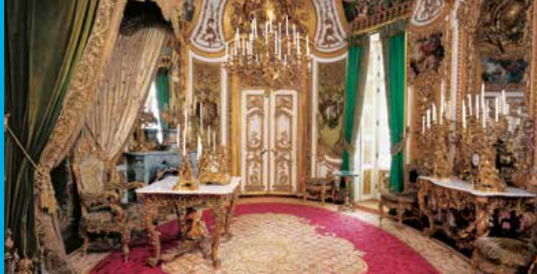
Gruppo di statue della Fontana di Flora davanti al Castello reale

Camere Opulente della Residenza di Monaco di Baviera. La ricchezza e la densità degli ornamenti con molti elementi di grande plasticità non sono pura e semplice imitazione. Nel Castello di Linderhof Ludovico II creò stanze di una sfarzosità fantasmagorica che vanno ben oltre ogni modello di riferimento. Anche la qualità di esecuzione artigianale non teme alcun confronto.