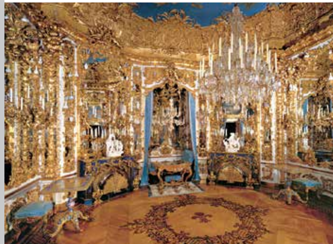
La Sala degli Specchi

Il castello e il parco di Linderhof rappresentano uno dei complessi artistici più variegati del XIX secolo. La 'Villa Reale' è l'unico castello che il re Ludovico II di Baviera (1845–1886) sia riuscito a portare a compimento (1878). Essa rivela un carattere francese il cui modello è il 'Castelletto delle delizie', edificio disposto perlopiù in un parco, così come era stato concepito nella Francia del XVIII secolo. Dietro la facciata barocca gli interni sono in stile rococò e si ispirano a motivi dell'epoca di Luigi XV di Francia. Si tratta tuttavia del secondo rococò o neorococò, sviluppatosi durante il regno di Ludovico II, che nella parte ornamentale è fortemente segnato da modelli della Germania meridionale. Ludovico II si ispirò al rococò dei suoi antenati, conosciuto già nell'infanzia nell'Amalienburg del Castello di Nymphenburg e nelle