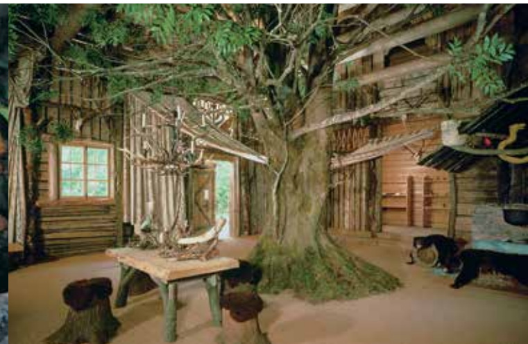
Interno della Capanna di Hunding con il tronco di frassino

La Capanna di Hunding rappresenta una casa germanica. Questa scenografia per il primo atto del dramma musicale 'La Valchiria' di Richard Wagner venne costruita esattamente in base alle sue indicazioni di regia. Qui Ludovico II leggeva saghe germaniche e nordiche, mentre sullo sfondo dei servitori in abbigliamento germanico formavano uno sfondo vivente.