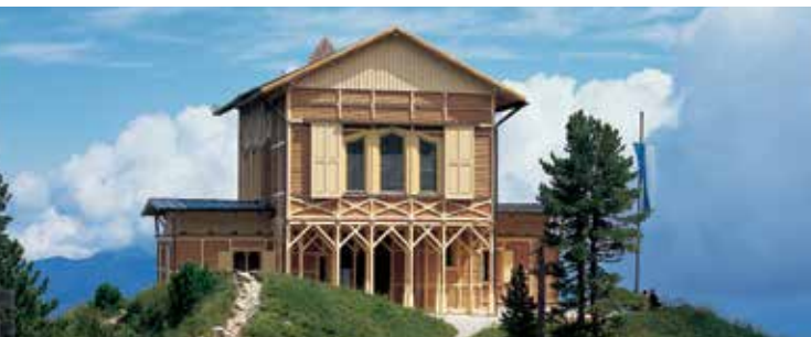
La maison royale du Schachen

C'est dans un site grandiose devant le massif alpin du Wetterstein que le roi Louis II fit construire à 1800 m d'altitude un petit château. L'aspect extérieur et l'intérieur du rez-de-chaussée sont simples alors que l'étage supérieur abrite un faste oriental. Dans cette salle turque, somptueusement décorée, aménagée de divans et d'une fontaine, le roi aimait à fêter son anniversaire et sa fête, dans la solitude des montagnes. On ne peut accéder à la maison royale qu'à pied en partant d'Elmau ou de Garmisch-Partenkirchen.