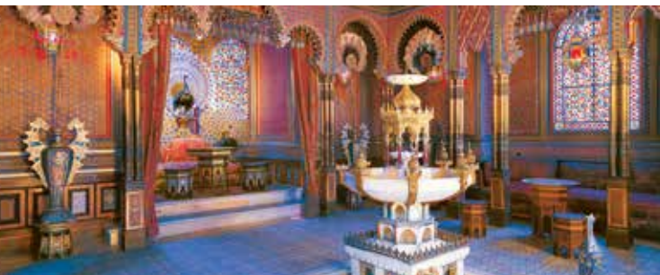
Le kiosque mauresque de Linderhof

derhof des salons somptueux d'une grande richesse. Le parc, un des plus beaux du 19ème siècle regroupe des éléments du jardin baroque avec ses plans d'eau magnifiques et ceux du style naturaliste des jardins à l'anglaise. Il abrite des bâtiments fascinants comme la maison marocaine, le kiosque mauresque et la grotte de Venus. Celle-ci est une immense grotte artificielle aménagée d'après les indications scéniques de Richard Wagner pour le 1er acte de son opéra Tannhäuser. On y trouve aussi deux décors érigés pour les drames musicaux de Wagner comme la chaumière de Hunding (1er acte des Walkyries) et l'ermitage de Gurnemanz (IIIème acte de Parsifal). Linderhof était le lieu préféré de Louis II.