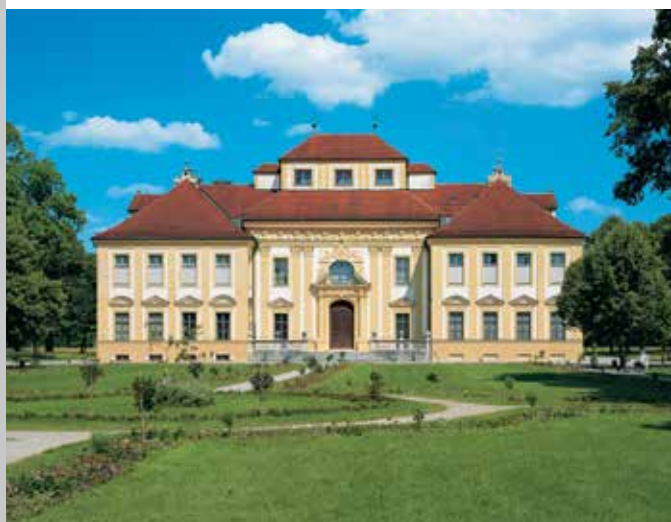
Castello di Lustheim

Le ambizioni politiche del principe elettore Massimiliano Emanuele di Baviera trovarono espressione nella costruzione del Castello Nuovo di Schleißheim. Originariamente progettato su più ali, il suo corpo principale – corrispondente all'attuale castello – venne costruito al grezzo su disegni di Enrico Zuccalli. L'esilio della durata di undici anni di Massimiliano Emanuele, in seguito alla sconfitta nella Guerra di successione spagnola, bloccò il progetto edilizio. Solo a