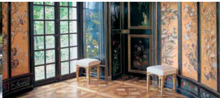
L'anticamera della Pagodenburg con le cineserie

Il parco del castello, esteso su circa 180 ha, era originariamente un giardino barocco, che all'inizio del XIX secolo venne trasformato da Friedrich Ludwig von Sckell in un giardino all'inglese. Nel parco si possono visitare i famosi castelletti: la Badenburg con la sua piscina coperta, l'orientaleggiante Pagodenburg, le finte rovine della Magdalenenklause e il gioiello rococò dell'Amalienburg.