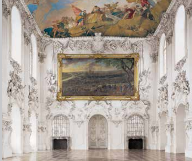
Il Salone nel Castello Nuovo

Le antiche mura del giardino, un viale di tigli di quasi 280 anni, un frutteto e un boschetto, a suo tempo provvisto di vari intrattenimenti, testimoniano delle diverse epoche dell'arte del giardinaggio. Particolare fascino offre il giardino grazie alla sua posizione su un piccolo rilievo al limite delle colline dell'era terziaria.