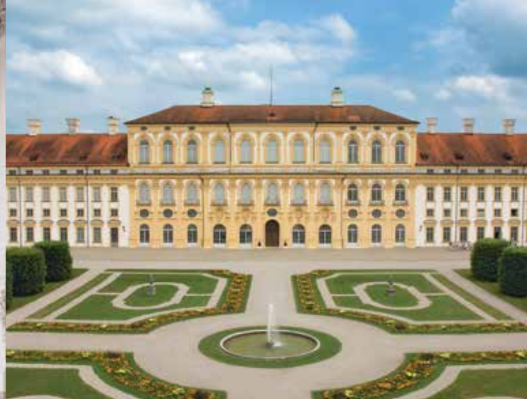
Facciata del Castello Nuovo

partire dal 1719 vennero portate a termine la struttura delle facciate e le decorazioni delle stanze su progetti di Joseph Effner. Il complesso monumentale racchiude un ampio scalone, fastosi saloni delle feste e quattro appartamenti di stato, alla cui decorazione hanno contribuito importanti artisti come Jacopo Amigoni, Cosmas Damian Asam e Johann Baptist Zimmermann. Negli spazi della Galleria le Collezioni di Stato Bavaresi presentano una spettacolare sintesi della pittura barocca europea. Il parco del castello è uno dei pochi giardini della fase barocca appena modificati. Già nel 1684 Enrico Zuccalli ne aveva fissata la struttura di base con i canali. Tenendo ben presente questa concezione di fondo Dominique Girard realizzò, fra il 1715 e il 1726, nello spazio antistante il Castello Nuovo uno sfarzoso parterre con aiuole decorative, sculture e diversi giochi d'acqua.