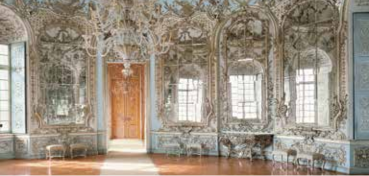
La Sala degli Specchi nell'Amalienburg