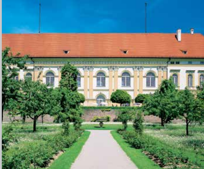
Il Castello di Dachau visto dal giardino con il parterre

Riprod. in copertina: Re Ludovico I avvolto nel manto regale dell'incoronazione , Joseph Stieler, 1826 circa