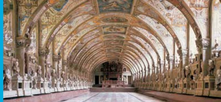
Antiquarium, Residenza di Monaco

Bayerischer Staatsminister der Finanzen und für Heimat