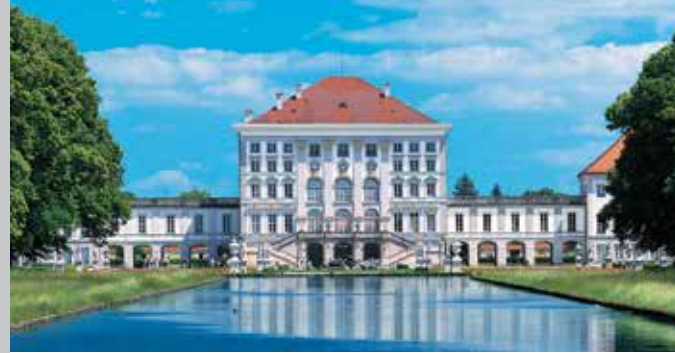
La facciata sul giardino del Castello di Nymphenburg

Il teatro che ha il nome dell'architetto François Cuvilliers il vecchio, fu costruito fra il 1751 e il 1755 su commissione del principe elettore Massimiliano III Giuseppe. Fu distrutto durante la seconda Guerra Mondiale. Gli ordini dei palchi, messi al sicuro e rimasti quindi intatti, furono reinstallati nella cosiddetta ala della farmacia (Apothekenstock). Il teatro è tornato così a incantare grazie alle stupende decorazioni nello stile rococò della Germania meridionale.