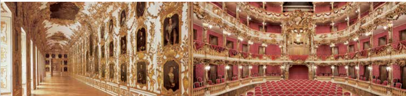
Le tribune del Teatro di Cuvilliers

saga nibelungica. Gli appartamenti del re Ludovico I e le Sale dei Nibelunghi sono temporaneamente chiuse a causa di lavori di restauro. Accanto al vasto e prezioso patrimonio di mobili, dipinti, sculture, bronzi, orologi e arazzi possono essere visitate nelle sale espositive anche numerose importanti collezioni particolari.