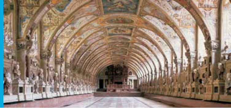
Antiquarium, Residenza di Monaco

Ministro bavarese delle Finanze, dello Sviluppo regionale e della Patria