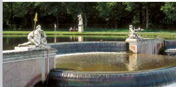
La Grande Cascata nel parco di Nymphenburg

Il castello e il parco nella loro combinazione di architettura e arte dei giardini rappresentano un'opera d'arte d'insieme di rango europeo. Nel 1664, in occasione della nascita dell'erede al trono Massimiliano Emanuele, il principe elettore Ferdinando Maria e la sua consorte Enrichetta Adelaide incaricarono l'architetto Agostino Barelli di costruire il castello di Nymphenburg. A partire dal 1701 Massimiliano Emanuele lo fece ampliare da Enrico Zuccalli con l'aggiunta delle gallerie laterali e dei padiglioni residenziali. Dal 1714 Joseph Effner progettò gli impianti a quattro ali degli edifici laterali che si connettevano lateralmente, modernizzando anche la facciata dell'edificio centrale su modello francese: un casino di caccia si era andato via via trasformando in un'ampia residenza estiva dell'assolutismo. Il principe elettore Carlo Alberto fece completare l'impianto in direzione della città con l'aggiunta della grande corte circolare. Le sale mostrano arredi e opere d'arte dal barocco fino al classicismo. Il percorso di visita conduce anche nella stanza natale di Re Ludovico II di Baviera. Un altro culmine della visita è la famosissima Galleria delle Belle di Re Ludovico I.