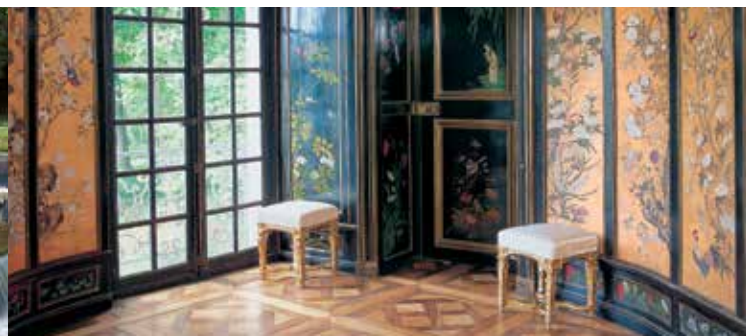
L'anticamera della Pagodenburg con le cineserie

Il parco del castello, esteso su circa 180 ha, era originariamente un giardino barocco, che all'inizio del XIX secolo venne trasformato da Friedrich Ludwig von Sckell in un giardino all'inglese. Nel parco si possono visitare i famosi castelletti: la Badenburg con la sua piscina coperta, l'orientaleggiante Pagodenburg, le finte rovine della Magdalenenklause e il gioiello rococò dell'Amalienburg.