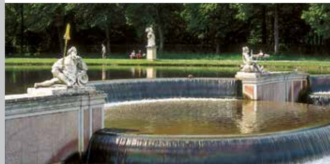
La Grande Cascata nel parco di Nymphenburg

Il castello e il parco nella loro combinazione di architettura e arte dei giardini rappresentano un'opera d'arte d'insieme di rango europeo. Nel 1664, in occasione della nascita dell'erede al trono Massimiliano Emanuele, il principe elettore Ferdinando Maria e la sua consorte Enrichetta Adelaide incaricarono l'architetto Agostino Barelli di costruire il castello di Nymphenburg. A partire dal 1701 Massimiliano Emanuele lo fece ampliare da Enrico Zuccalli con l'aggiunta delle gallerie laterali e dei padiglioni residenziali. Dal 1714 Joseph Effner progettò gli impianti a quattro ali degli edifici laterali che si connettevano lateralmente, modernizzando anche la facciata dell'edificio centrale su modello francese: un casino di caccia si era andato via via trasformando in un'ampia residenza estiva dell'assolutismo. Il principe elettore Carlo Alberto fece completare l'impianto in direzione della città con l'aggiunta della grande corte circolare. Le sale mostrano arredi e opere d'arte dal barocco fino al classicismo. Il percorso di visita conduce anche nella stanza natale di Re Ludovico II di Baviera. Un altro culmine della visita è la famosissima Galleria delle Belle di Re Ludovico I.