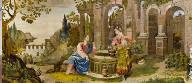
»Jesus und die Samariterin«, Altar-Antependium in Nadelmalerei