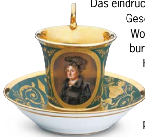
Porzellantasse mit Porträt der Herzogin Maria Amalia (o.); Rittersaal der Renaissance (li.); barocke Schlossgrotten (re.)

Geschichte entfaltet sich in den einstigen Wohn- und Staatsräumen der Pfalz-Neuburger Fürsten. Rund 550 Kunstwerke – Porträts und wertvolle Bildteppiche, Waffen, Möbel und kostbares Kunsthandwerk – veranschaulichen ein spannendes Kapitel pfalz-bayerischer Geschichte.