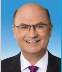
Albert Füracker, MdL Staatsminister

Wir wünschen Ihnen einen spannenden Besuch in Schloss Neuburg!