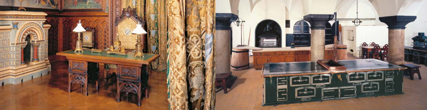
Arbeitszimmer mit Schreibtisch Ludwigs II.