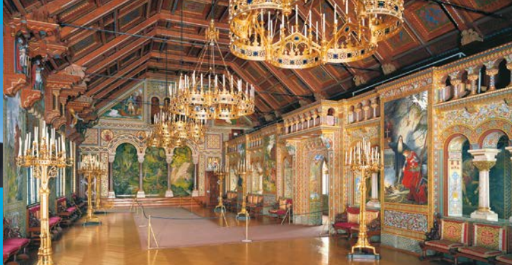
Der Sängersaal im vierten Geschoss des Palas