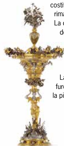
Sigillo della Bolla d'oro (replica), Monaco di Baviera, Bayerisches Hauptstaatsarchiv (in alto); Centrotavola Merkel, Museen der Stadt Nürnberg (al centro); Globo crucigero imperiale (replica), Norimberga, Altstadtfreunde e.V. (destra)