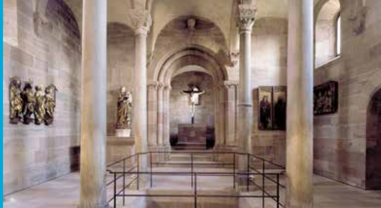
Cappella superiore, vista sul coro, 1200 circa

Ministro bavarese delle Finanze, dello Sviluppo regionale e della Patria