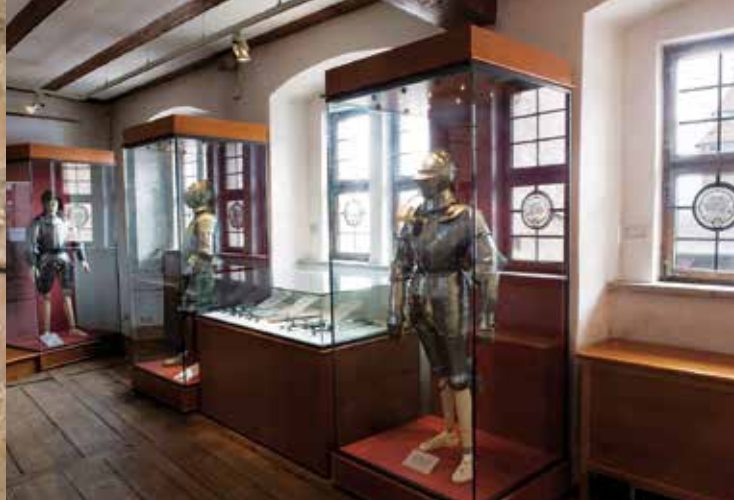
Vista nelle sale della mostra nelle 'Kemenate'