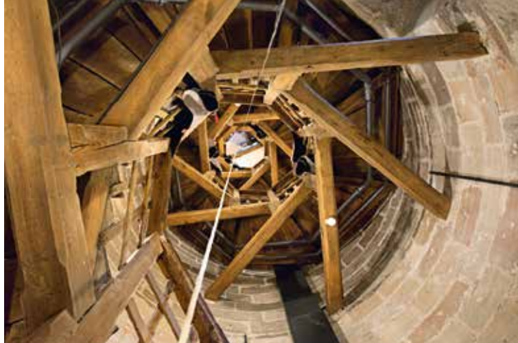
Vista sulla scala della Torre 'Sinwell'