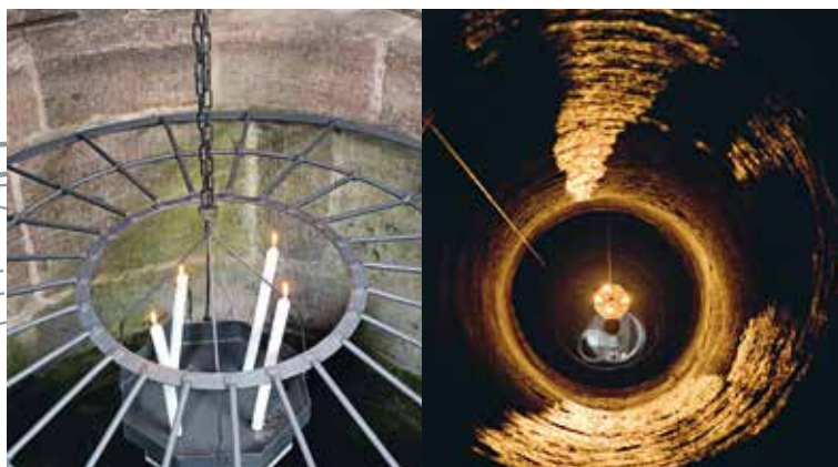
Vista nella cavità del Pozzo profondo

Il Pozzo profondo al centro della fortificazione esterna fu costruito, per l'approvvigionamento idrico autonomo, forse già nella prima fase di costruzione del castello. La sua cavità è scavata per circa 50 metri nella roccia. Una carrellata filmata e un'illustrativa visita guidata permettono ai visitatori di apprezzarne la profondità.