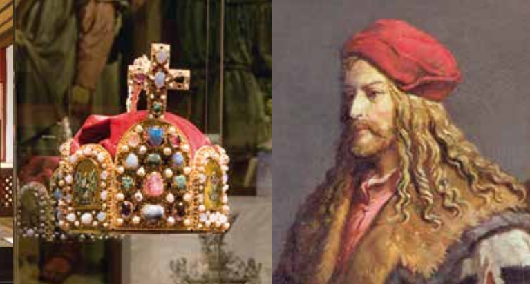
Corona imperiale (replica), Norimberga, Altstadtfreunde e.V.