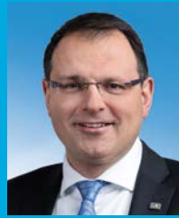
Martin Schöffel, MdL Staatssekretär

Wir wünschen Ihnen einen erholsamen Besuch im Schloss- park Nymphenburg!