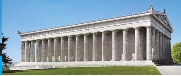
Die Walhalla von Osten