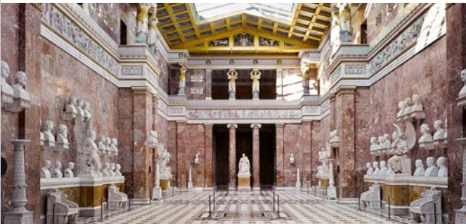
Marmorbüsten von J. W. von Goethe, Sophie Scholl und Max Planck