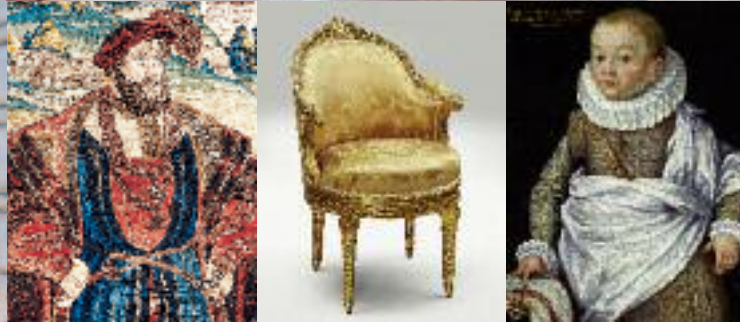
Rittersaal (o.); Pfalzgraf Ottheinrich (li. u.); Schreibsessel (Mi. u.); Philipp Wilhelm als Kind (re. u.); Tasse der Herzogin Maria Amalia (u.)