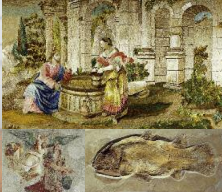
Altar-Antependium (o.); Prophet Habakuk aus der Schlosskapelle (li. u.); Quastenflosser (re. u.); Römische Silberfibel (ganz u.)

Die Zweiggalerie ist mit etwa 120 Gemälden ausschließlich der flämischen Barockmalerei gewidmet. Peter Paul Rubens hatte auf Bestellung von Wolfgang Wilhelm von Pfalz-Neuburg drei Altargemälde für die Hofkirche in Neuburg angefertigt. Die beiden Seitenaltäre mit der »Anbetung der Hirten« und der »Ausgießung des Hl. Geistes« sind heute im Großen Saal der Galerie zu sehen. Neben diesen Werken werden noch sechs weitere Gemälde von Rubens und seiner Werkstatt gezeigt. Anthonis van Dyck und Jacob Jordaens, die zwei neben Rubens herausragenden Antwerpener Maler, sind in repräsentativen Beispielen vertreten. In Antwerpen wurden im 17. Jh. sämtliche Gattungen der Malerei gepflegt: Historie, Porträt, Landschaft, Stillleben, Jagdstücke und Genre. Sie alle kommen in wichtigen Beispielen von den jeweils besten Vertretern ihres Faches wie Hendrik van Balen, Jan Brueghel d. Ä., Jan Cossiers, Frans Francken d. J., Frans Snyders, David Teniers, Paul de Vos oder Jan Wildens zur Geltung.