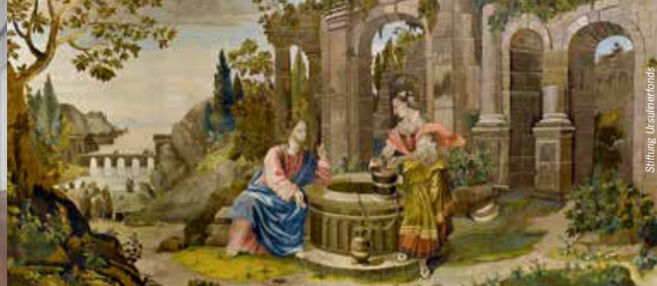
»Jesus und die Samariterin«, Altar-Antependium in Nadelmalerei