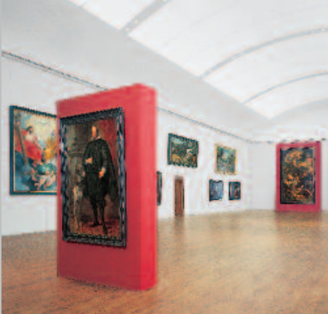
Großer Saal mit Porträt des Pfalzgrafen Wolfgang Wilhelm von Anthonis van Dyck im Vordergrund