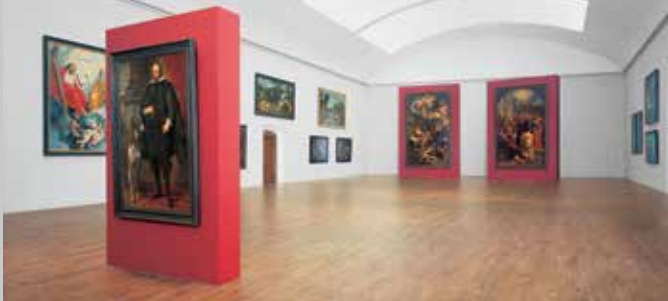
Großer Saal im Westflügel mit den Rubens-Altären