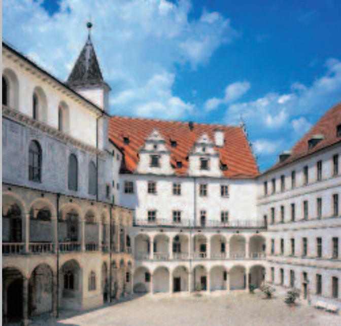
Innenhof von Schloss Neuburg mit Arkadengängen und Sgraffito-Dekoration